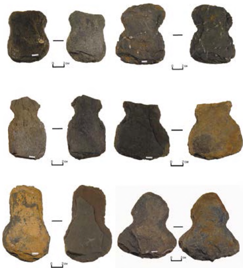
Рис. 10. – Акбауыр-2021. Поселение Акбауыр II. Мотыги

Также были найдены несколько бронзовых предметов. Среди найденных предметов можно особо отметить бронзовый наконечник стрелы. Наконечник стрелы трехгран-