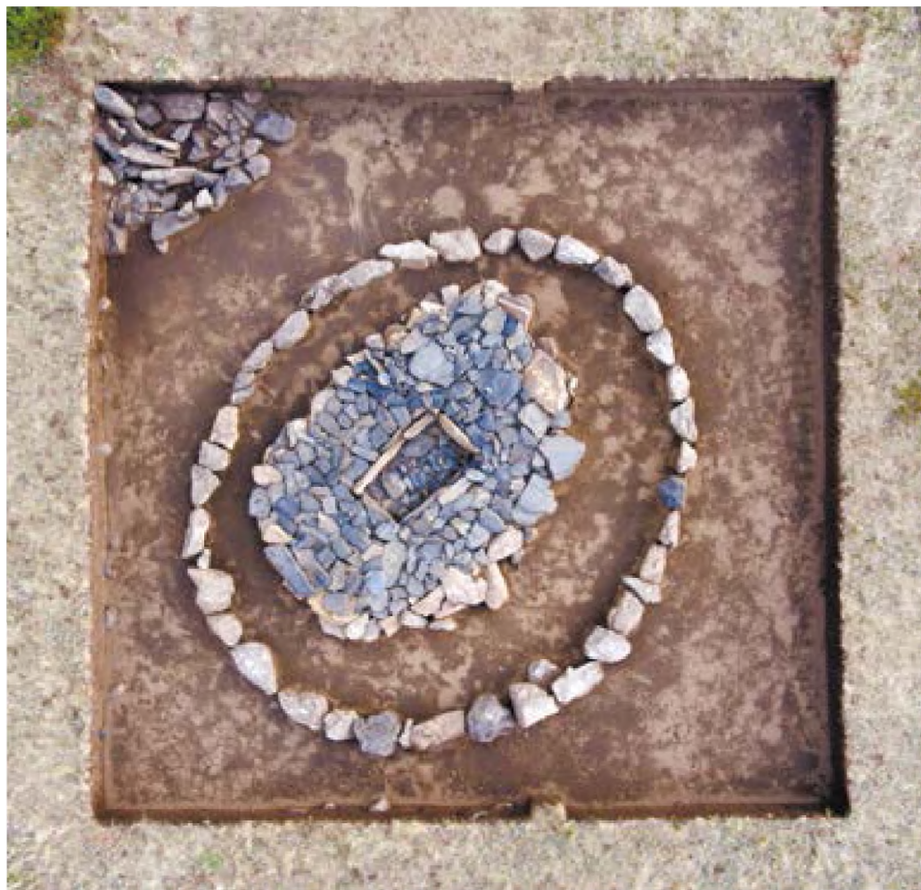
Рис. 16. – Акбауыр-2021. Курган №1. Вид после рекультивации

Таким образом в полевом сезоне 2021 года мы получили материалы, которые дали нам возможность определить культурно-хронологические рамки археологического комплекса Акбауыр.