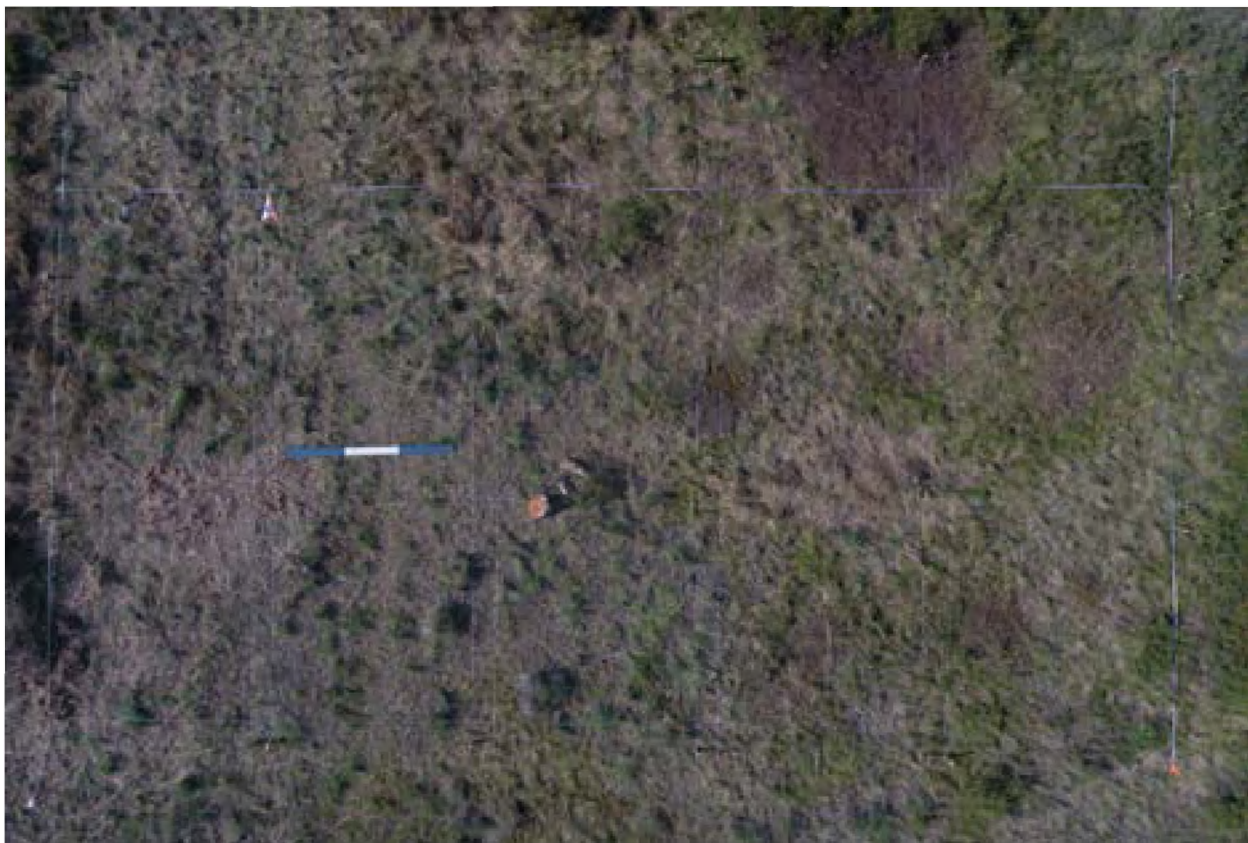
Рис. 2. – Акбауыр-2021. Поселение Акбауыр II. Вид сверху. Каменная конструкция

До раскопа на поселение была произведена георадарная съемка. Целью георадарной съемкой было определение территории памятника и получение планиграфической карты до начала раскопочных работ.