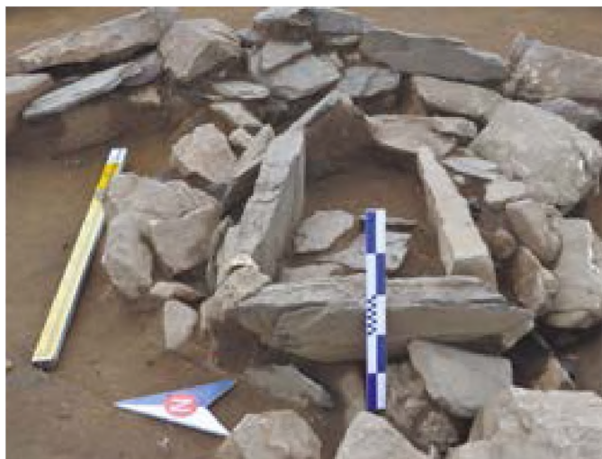
Рис. 13. – Акбауыр-2021. Курган №1. Каменный ящик

В ходе дальнейшего разбора конструкции кургана выявлено несколько конструктивных элементов наземной конструкции. Курган был сложен из двух каменных колец. Расстояние между кольцами составляло около 80 см в западной части и 100 см в восточной части кургана (Рис.15). Пространство между кольцами забутовано камнями мелкого и среднего размера. Северо-Западная часть кургана была разгружена грабительским вторжением.