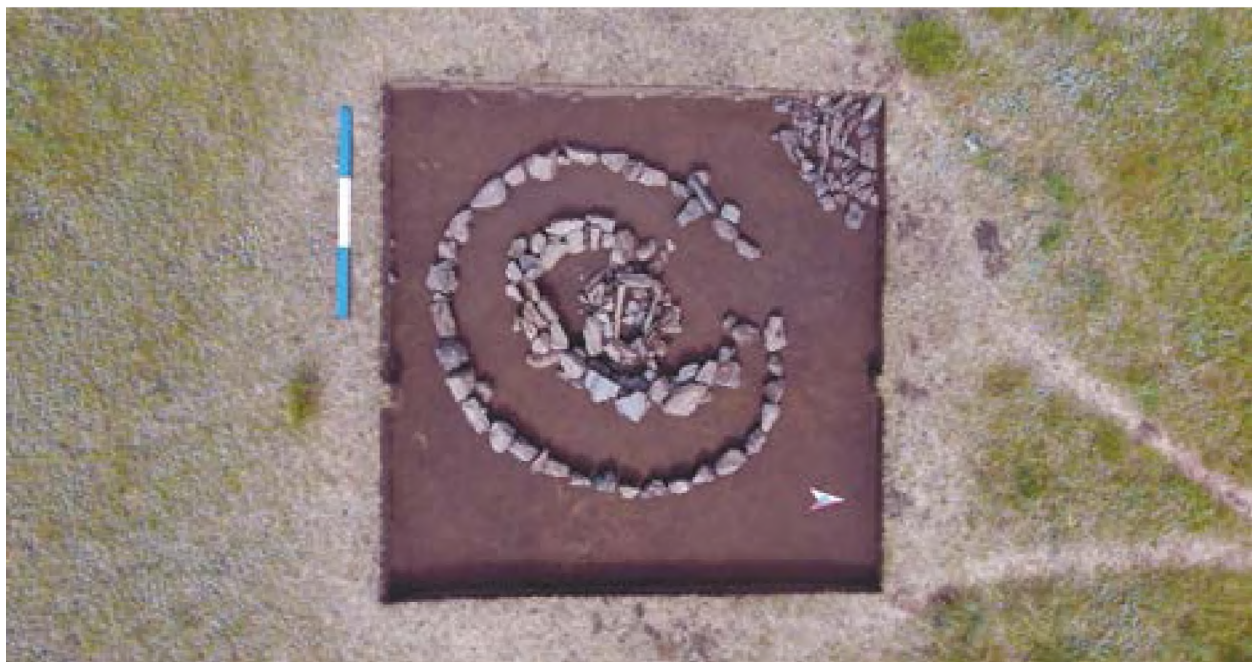
Рис. 14. – Акбауыр-2021. Курган №1. Вид после разбора каменной насыпи.

Под каменным ящиком была выявлена каменная забутовка могильной ямы. По контуру забутовки были определены границы могильной ямы. Могильная яма на уровне зачист-