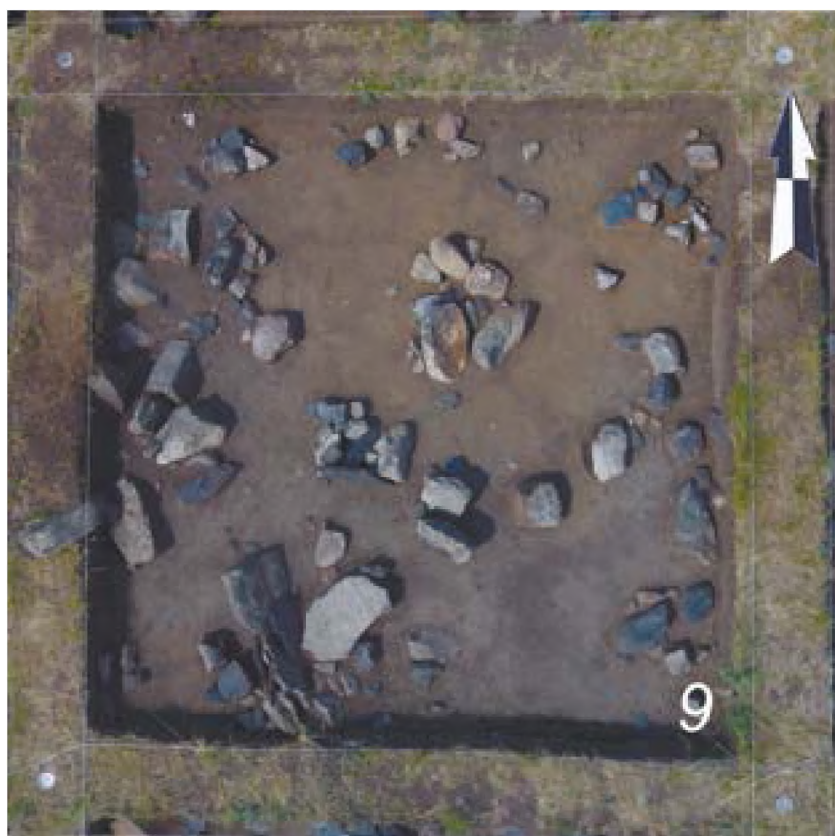
Рис. 9. – Акбауыр-2021. Поселение Акбауыр II. Помещение 2. Очаг