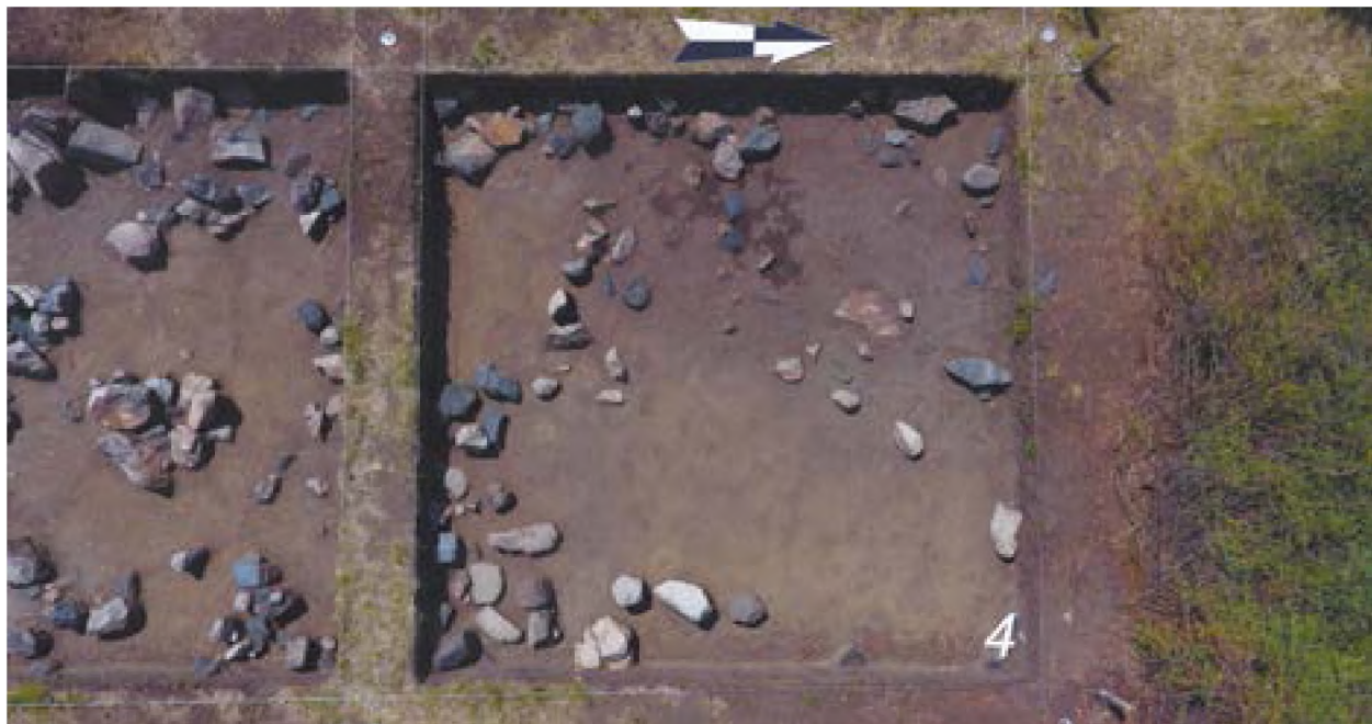
Рис. 8. – Акбауыр-2021. Поселение Акбауыр II. Вход в помещение