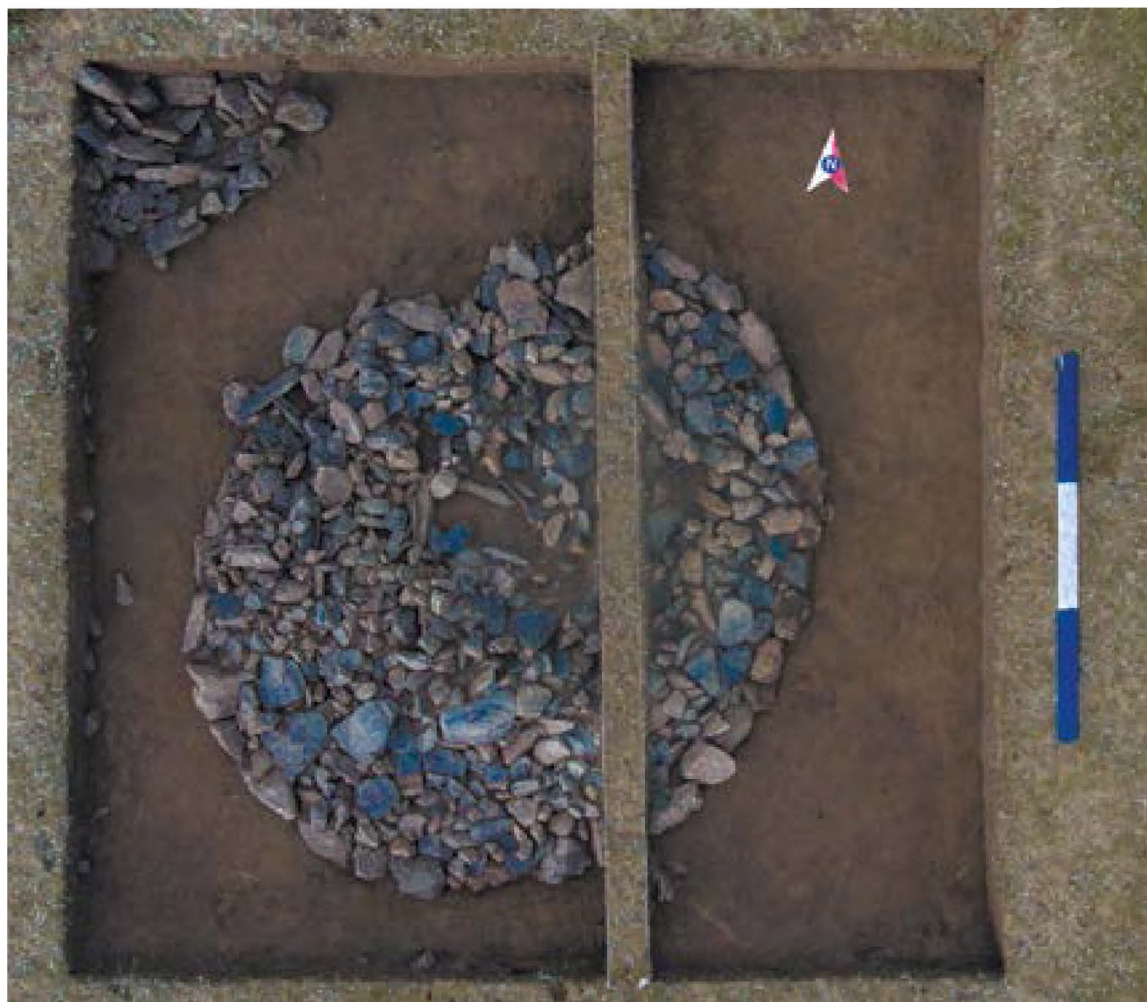
Рис. 12. – Акбауыр-2021. Курган №1. Вид после снятия дерна

После удаления завала была выявлена основная конструкция кургана. Курган в плане овальной формы. Ориентированный по линий СВ-ЮЗ. Размеры кургана по линий СВ-ЮЗ – 7 м, СЗ-ЮВ – 5 м. Основанием кургана было каменное кольцо, сложенное из рванного гранита средних размеров. Внутренняя часть кольца заполнена мелкими камнями. Местами поверх мелких камней лежали каменные плиты из сланца. После расчистки каменной конструкции было зафиксировано, что курган ограничен кольцом из более крупных камней гранитной породы.