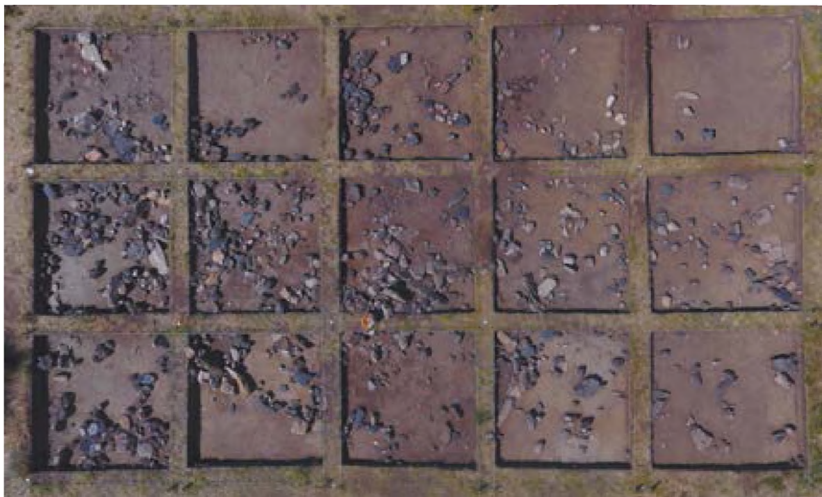
Рис. 5. – Акбауыр-2021. Поселение Акбауыр II. Вид после снятия дерна и зачистки