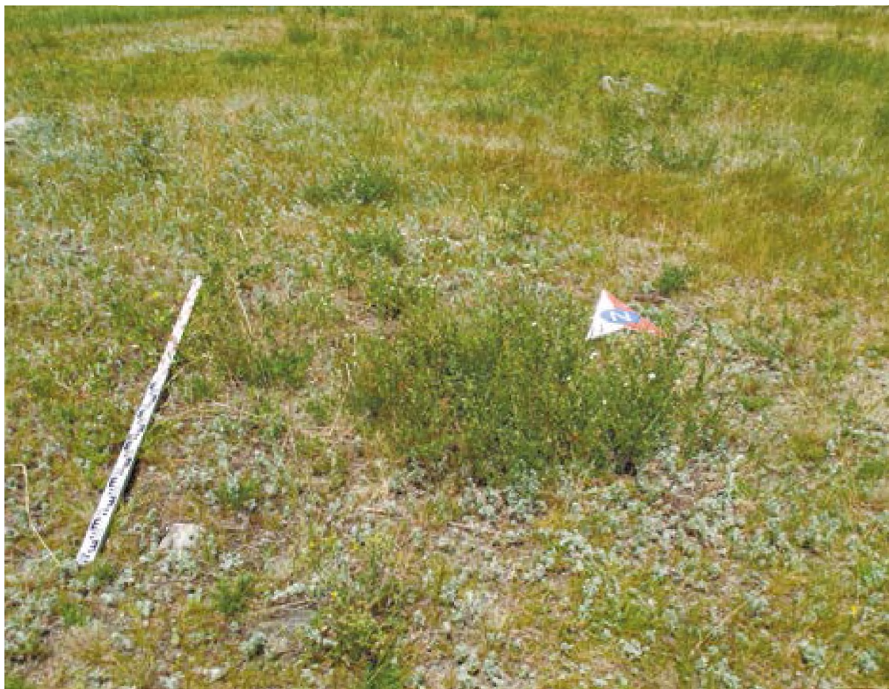
Рис. 11. – Акбауыр-2021. Курган №1. Вид до раскопа

После расчистки насыпи от дерна и гумусных отложений была выявлена округлая в плане каменная конструкция, сложенная из мелкого рванного камня и из сланцевых плит.