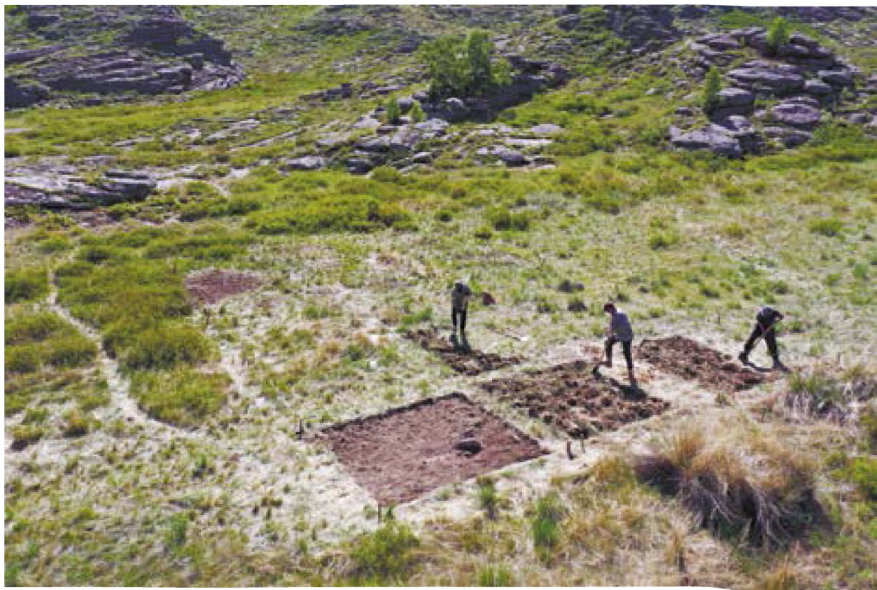
Рис. 4. – Акбауыр-2021. Поселение Акбауыр II. Рабочий момент. Процесс удаления дернового слоя

Заполнение представляет собой коричневый гумус с включением небольшого количество камней из сланцевой породы. На разных уровнях заполнения были зафиксированы фрагменты керамических сосудов, кости животных и каменные орудия труда и обработанные камни.