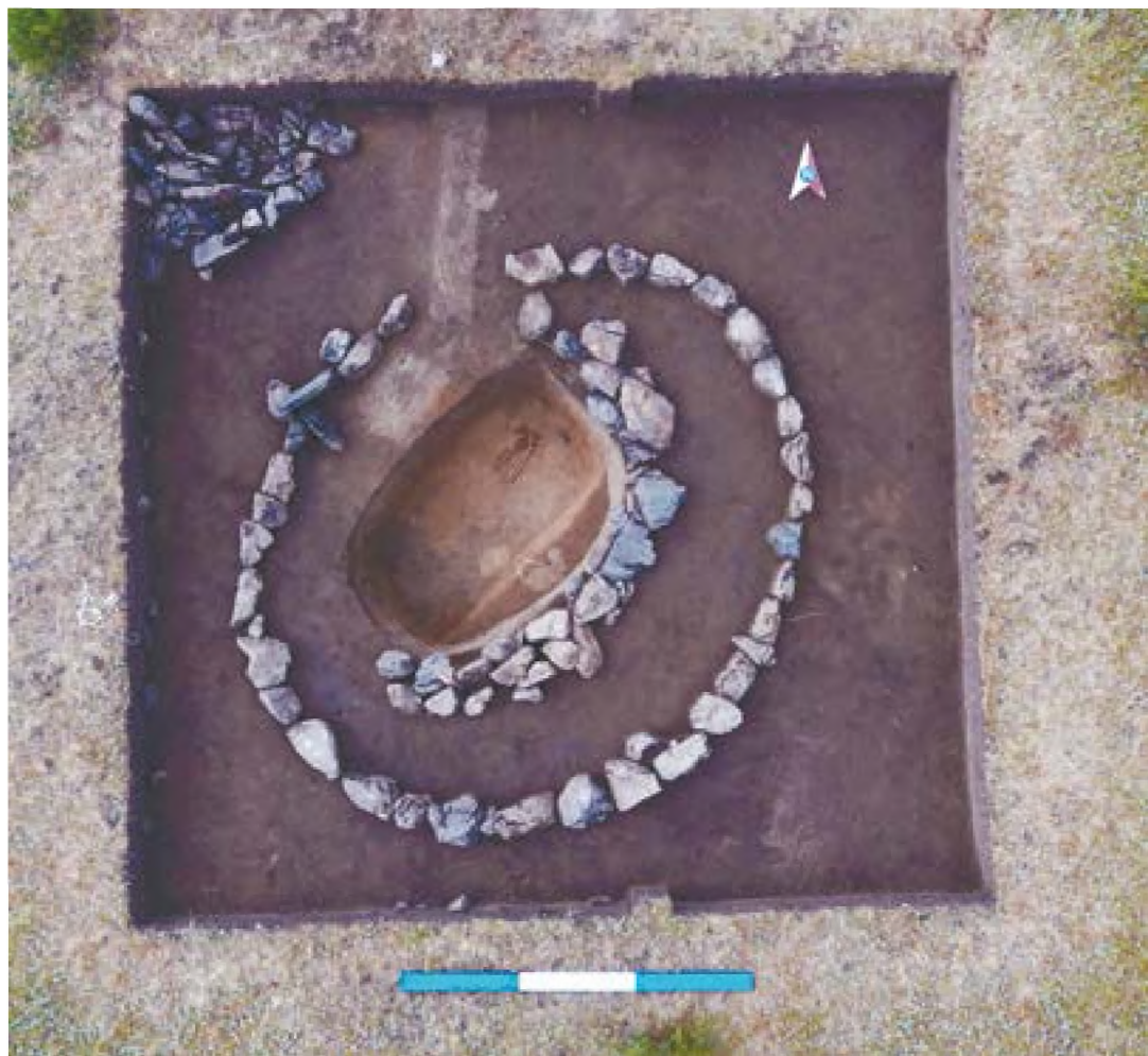
Рис. 15. – Акбауыр-2021. Курган №1. Могильная яма

После исследовательских работ курган был рекультивирован (Рис. 16).