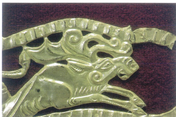
Рис. 8. Изображение рогов лося на золотой накладке ножен акинака из кургана Иссык.