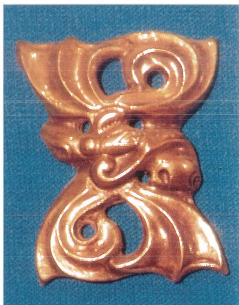
Рис. 9. Изображение рогов лося на золотых поясных бляхах из кургана Иссык.

рону относительно того, как они расположены в реальности, а роговая лопаца направлена вперед, тогда как у лося – назад. Гребешковидные очертания рогов берельских грифонов явно близки к кожаным аппликациям с петухами из Пазырыкских курганов [Грязнов, 1950, табл. XVII, 3; Руденко, 1948, с. 23, рис. 7, с. 49, рис. 29]. Они находят аналогии и в деревянных резных украшениях конской сбруи из кург. 11 Берельского некрополя (рис. 7), и в металлопластике из кургана Иссык (рис. 8, 9) [Акишев, 1978, с. 100–103]. Изображения рогов лосей из этого погребального комплекса также отличаются значительно развитые роговые лопацы, что характерно для животного зрелого возраста. Естественным особенностям строения рога соответствует и гребневидность отростков. У лосиных рогов они менее разветвлены, чем у оленьих, и равномерно распределены на роговой лопаце. Рога у берельских грифонов имеют определенные отличия. Они могли располагаться на одной линии либо под небольшим углом друг к другу. Кроме того, некоторые рога грифонов соединялись с клювом тонкими перемычками (псалии), а друг с другом шарни-