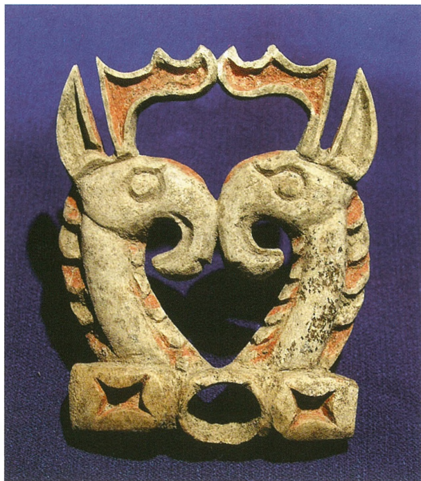
Рис. 6. Резные роговые протомы грифонов (украшения узды и упряжи). Кург. 36, Берель.

Роговые псалии, украшенные изображениями голов грифонов, из Берели (см. рис. 3) аналогичны сходным по материалу предметам из курганной группы Красный Яр-1 в северо-западных предгорьях Алтая [Сергеев, 1946], а также деревянным псалиям из Первого Пазырыкского кургана, Ак-Алахи-1, 3 [Грязнов, 1950, табл. VI, 2; Полосьмак, 2001, с. 46, рис. 25, с. 82, рис. 58, с. 86, рис. 62].