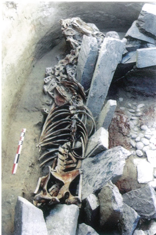
Рис. 1. Захоронение коня в могиле кург. 36 Берельского некрополя.

Убранство верхового коня (рис. 2–6) состояло из 66 предметов, изготовленных из рога марала и представляющих собой выдающиеся произведения косторезного искусства ранних кочевников Великого пояса степей. Такое количество высокохудожественных образцов резьбы по рогу, выполненных в скифо-сибирском зверином стиле, встречено впервые в погребальных комплексах ранних кочевников не только Алтая, но и Евразии. Как правило, в захоронениях верхнеобского бассейна второй поло-