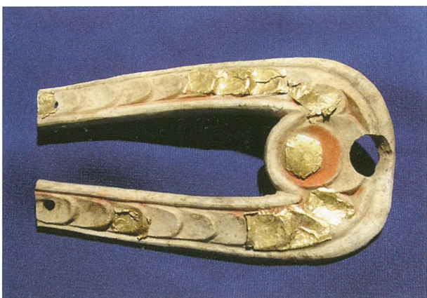
Рис. 4. Резное роговое украшение уздечных ремней из кург. 36 Берельского некрополя.