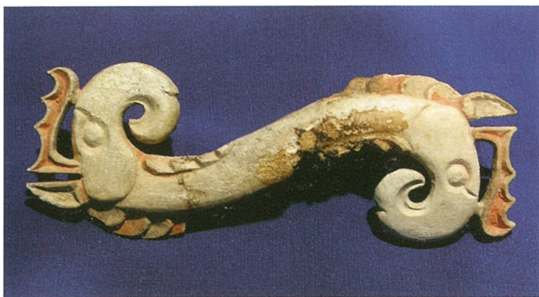
Рис. 3. Резной роговой псалий с изображениями голов грифонов. Кург. 36, Берель.