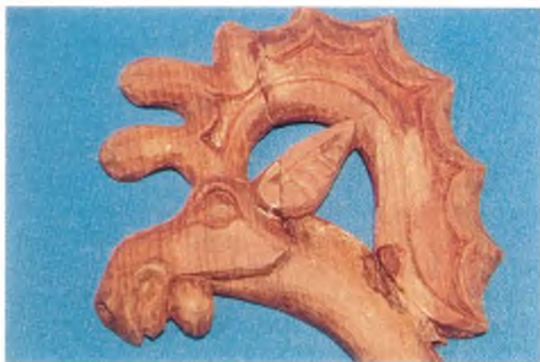
Рис. 7. Изображение рогов лося на окончаниях деревянных псалиев из кург. 11 Берельского некрополя.