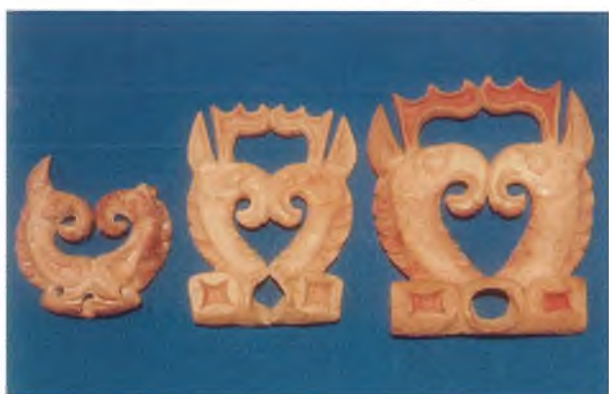
Рис. 11. Резные изображения грифонов различных размеров. Кург. 36, Берель.