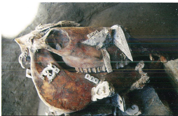
Рис. 2. Расположение роговых украшений узды на конском черепе из кург. 36 Берельского некрополя.

вины I тыс. до н.э. находили либо единичные резные предметы в составе конской упряжи (псалии, пряжки, бляхи, налобники), либо несколько роговых уздечных украшений [Троицкая, Бородовский, 1994, с. 37, рис. 1; Бородовский, 1997, с. 97, 98; 1999б].