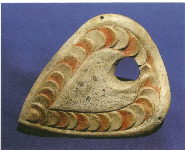
Рис. 5. Резной роговой нагрудник упряжи из кург. 36 Берельского некрополя.