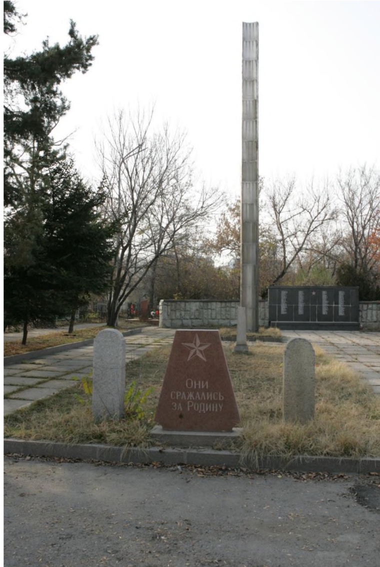
Иллюстрация 2. Мемориал на месте захоронения советских солдат и офицеров на участке № 1.

Мемориал «реконструирован» в 2015 г. к 70-летию Победы: стальная стела (перенесенная на кладбище из парка имени 28 гвардейцев-панфиловцев в 1970 г.) была снесена, на ее месте установлен обелиск из светлого гранита на прямоугольном постаменте с изображением на ордена Великой Отечественной войны, и текстом «Никто не забыт, ничто не забыто». Установленная в 1970 г. гранитная стела с пилоном подверглась непрофессиональной «реконструкции», в результате чего первоначальный вид памятника оказался уничтожен.