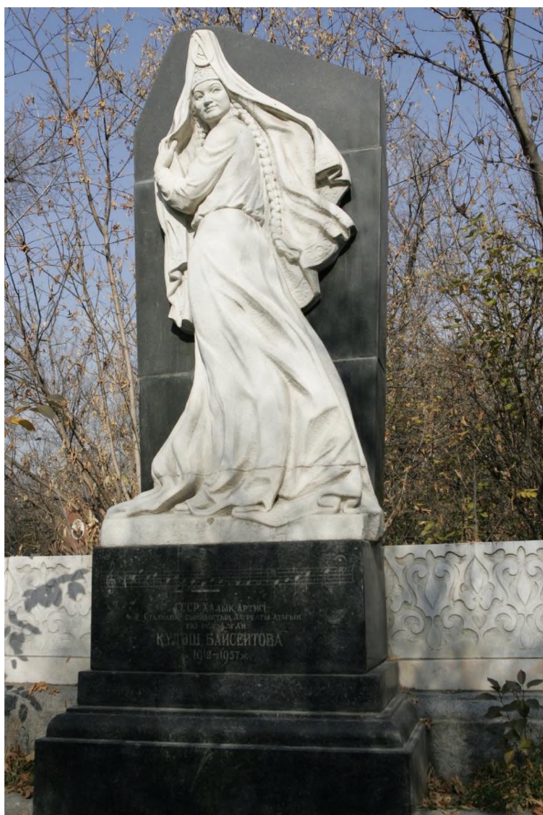
Иллюстрация 3. Памятник народной артистке СССР К.Ж.Байсеитовой .

Памятник установлен (в юго-западной части мемориальной зоны, на коровинской дорожке, на которой похоронен Герой Советского Союза Я.И.Коровин ) в 1960 г., и до настоящего времени является непревзойденным образцом надгробного ваяния по силе выразительности, точности использования художественных средств, совершенству формы. Памятник был поврежден вандалами (реставрирован скульптором П.И.Шороховым ), а архитектурное оформление после 2010 г. было существенно деформировано сотрудниками спецкомбината ритуальных услуг (внесены изначально отсутствовавшие и художественно и идейно чуждые монументу религиозные тексты), в настоящее время первоначальный вид мемориала утрачен.