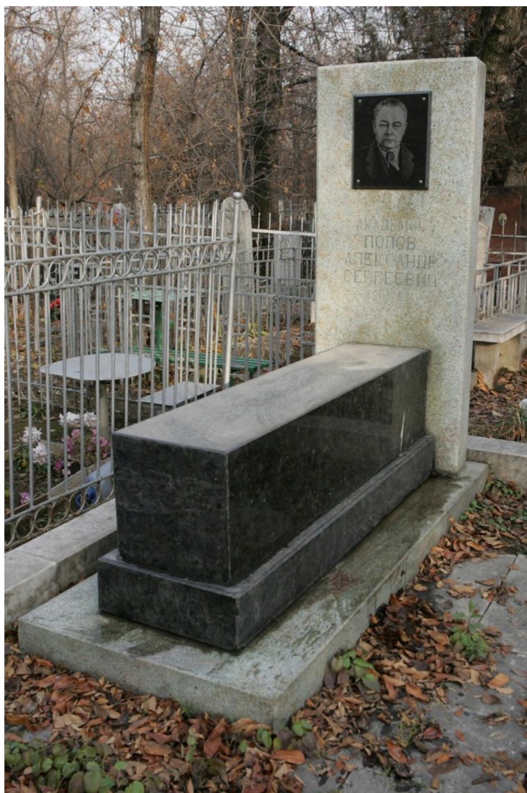
Иллюстрация 9. Памятник академику А.С.Попову .

руды на Курской магнитной аномалии – крупнейшем в мире месторождении магнитного железняка, разработке которого важнейшее значение придавал В.И.Ленин . В 2023 г. этому событию исполняется 100 лет [59].