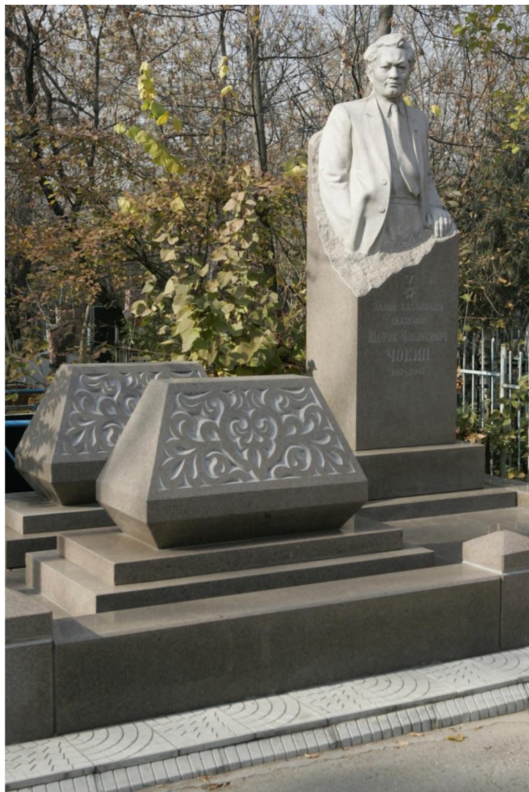
Иллюстрация 10. Памятник Народному Герою Казахстана, академику Ш. Ч. Чокину .

Наш опыт изучения данного некрополя даёт богатый материал для региональной истории и краеведения, основанный на нетрадиционных источниках: перечни похороненных лиц, типология и художественные особенности надгробных памятников, семантика изображений и эпитафий. Включение этого и других историко-мемориальных кладбищ в общее «поле» культуры актуально и потому, что некрополистические исследования вызывают живой интерес, запрос общества на них выражается в популярности экскурсий и литературы соответствующей тематики.