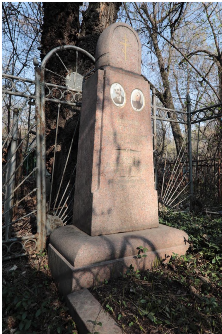
Иллюстрация 7. Памятник астроному, академику Г.А.Тихову .

А захоронение Народного художника Казахской ССР, одного из основоположников казахстанского профессионального изобразительного искусства А.М.Черкасского , похороненного в 1967 г. рядом с центральной аллеей, у которого тоже не осталось родных и близких, найти, увы, уже не удалось.