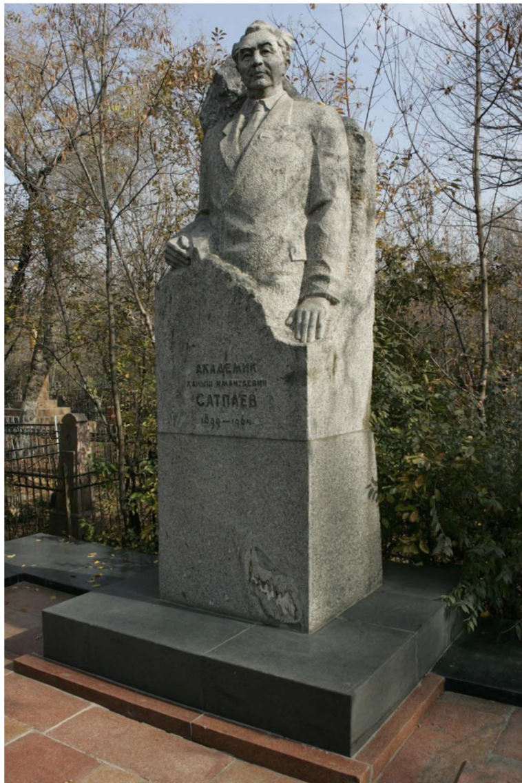
Иллюстрация 6. Памятник Президенту Академии наук Казахстана К.И.Сатпаеву.