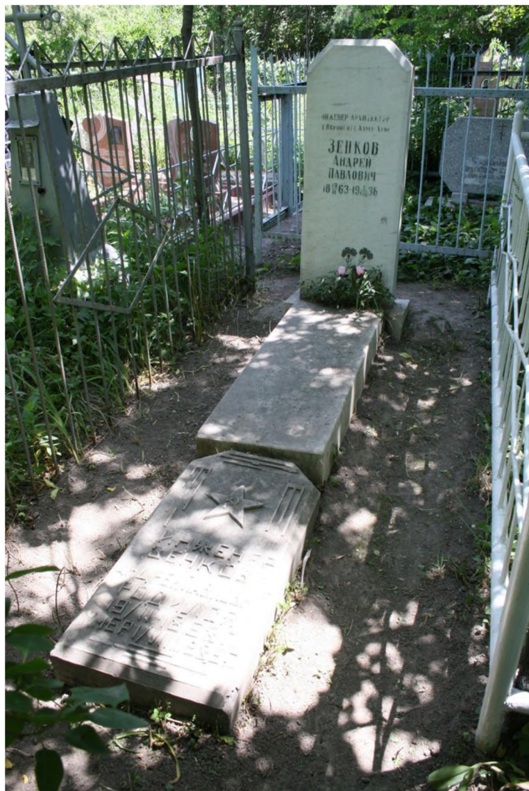
Иллюстрация 1. Памятник архитектору А.П.Зенкову .

В этот период на исторической территории были похоронены заслуженный деятель искусств, лауреат Всемирного этнографического конкурса в Париже певец Амре Кашаубаев , первый председатель Революционного комитета г. Верного Г.Т.Кислов , военный архитектор, основоположник сейсмостойкого строительства А.П.Зенков (ил.1) , руководивший строительством Вознесенского кафедрального собора.