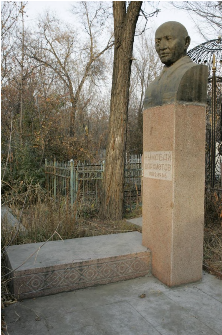
Иллюстрация 4. Памятник Первому секретарю ЦК Компартии Казахстана Ж.Ш.Шаяхметову .

Центральное место в мемориальной зоне занимает захоронение выдающегося государственного деятеля Жумабая Шаяхметова – Первого секретаря ЦК Компартии Казахстана, Председателя Совета Национальностей Верховного Совета СССР, первого этнического казаха, занявшего высший руководящий пост в республике. Бюст из бетона, выполненный по модели скульптора В.Ю.Рахманова (архитектор М.М.Мендикулов ) установлен в 1970 г. (ил.4).