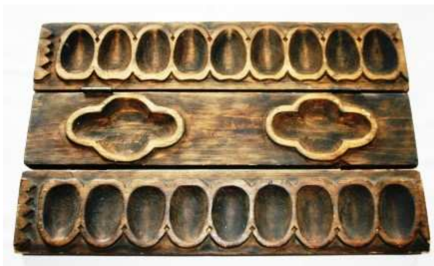
А.Құнанбайұлы ойнаған тоғызқұмалақ тақтасы. Семей қаласы, Абай мұражайы.

Зерделік ойындарды зерттеушілер шахматты – үндіге, гоны – қытайға, нардыны – парсыға, дойбыны – грекке, ал маңғалатектес ойындарды африкалық-тұрандық ортаға телиді. Осыған қарай бұл ақыл спорттарын сәйкес қауымдарда қалыптасқан ойлау жүйесінің көрінісі деп қарастыруға болады. Дегенмен, әлі күнге шахмат пен дойбының шығу тегі нақты қай ортада орын алды деген мәселе нақты жауабын тапқан жоқ. Бүгінгі жаһандық үрдіс жайлаған заманда ол жауаптың қажеті де болмас. Алайда аталмыш зерделік ойындардың шығу ортасын аңдау арқылы сол қауымдардың әлеуетін тануға болады.