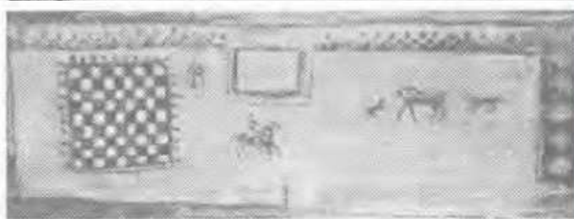
Батыс қабырғадағы №9 склептегі суреттер /фрескалар/