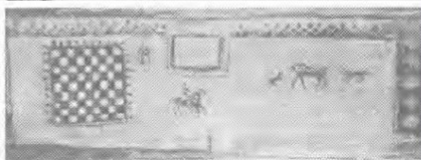
Батыс қабырғадағы №9 склептегі суреттер /фрескалар/