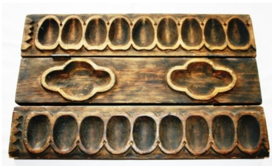
А.Құнанбайұлы ойнаған тоғызқұмалақ тақтасы. Семей қаласы, Абай мұражайы.

Зерделік ойындарды зерттеушілер шахматты – үндіге, гоны – қытайға, нардыны – парсыға, дойбыны – грекке, ал маңғалатектес ойындарды африкалық-тұрандық ортаға телиді. Осыған қарай бұл ақыл спорттарын сәйкес қауымдарда қалыптасқан ойлау жүйесінің көрінісі деп қарастыруға болады. Дегенмен, әлі күнге шахмат пен дойбының шығу тегі нақты қай ортада орын алды деген мәселе нақты жауабын тапқан жоқ. Бүгінгі жаһандық үрдіс жайлаған заманда ол жауаптың қажеті де болмас. Алайда аталмыш зерделік ойындардың шығу ортасын аңдау арқылы сол қауымдардың әлеуетін тануға болады.