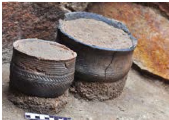
Рисунок 6 – Глиняный сосуд с орнаментом. Погребение №4

Погребение 3 Ограды 1 каменная циста. Расположен в одной линии с предыдущими ящиками, с их южной стороны. На поверхности сохранилась одна из двух массивных плит, предназначенных для перекрытия. Отдельные обломки от плиты перекрытия были разбросаны вокруг ящика и внутри него. Западная половина верхней части кладки цисты частично разрушена. Стены цисты сложены из сероватой породы камня, с вкраплениями кварцита и плит очень аккуратно, верх ящика слегка наклонен во внутреннюю сторону. Размеры цисты по верхнему уровню камней – 1,8х1,3 м (рис. 3).