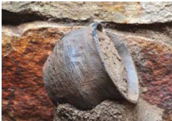
Рисунок 5 – Глиняный сосуд с орнаментом. Погребение №3