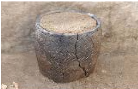
Рисунок 4 – Глиняный сосуд с орнаментом. Погребение №2

Погребение 2 Ограды 1 каменная циста. Расположен в одном ряду, с южной стороны предыдущей погребальной камеры и наиболее подвергнут к разрушению – часть обломанных плит от перекрытия лежали внутри ящика. Конструктивно имеет существенное различие от предыдущей погребальной камеры-цисты. В данном случае погребальная камера сооружена комбинированной техникой – торцевые части выполнены из цельных плит, а боковые – из составных плит серого гранита. Размеры цисты по верхнему уровню камней – 1,85x1,25 м. На дне каменного ящика лежали почти неповрежденные кости молодой особи, головой на запад, с согнутыми ногами. Поверх этого скелета лежали несколько трубчатых костей взрослого человека (рис. 3).