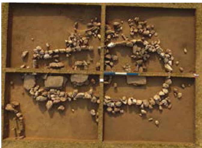
Рисунок 1 – Ограда после снятия дернового слоя. Вид с востока

В процессе исследования на площади кварцевой ограды проводились глубинные геофизическое сканирование.