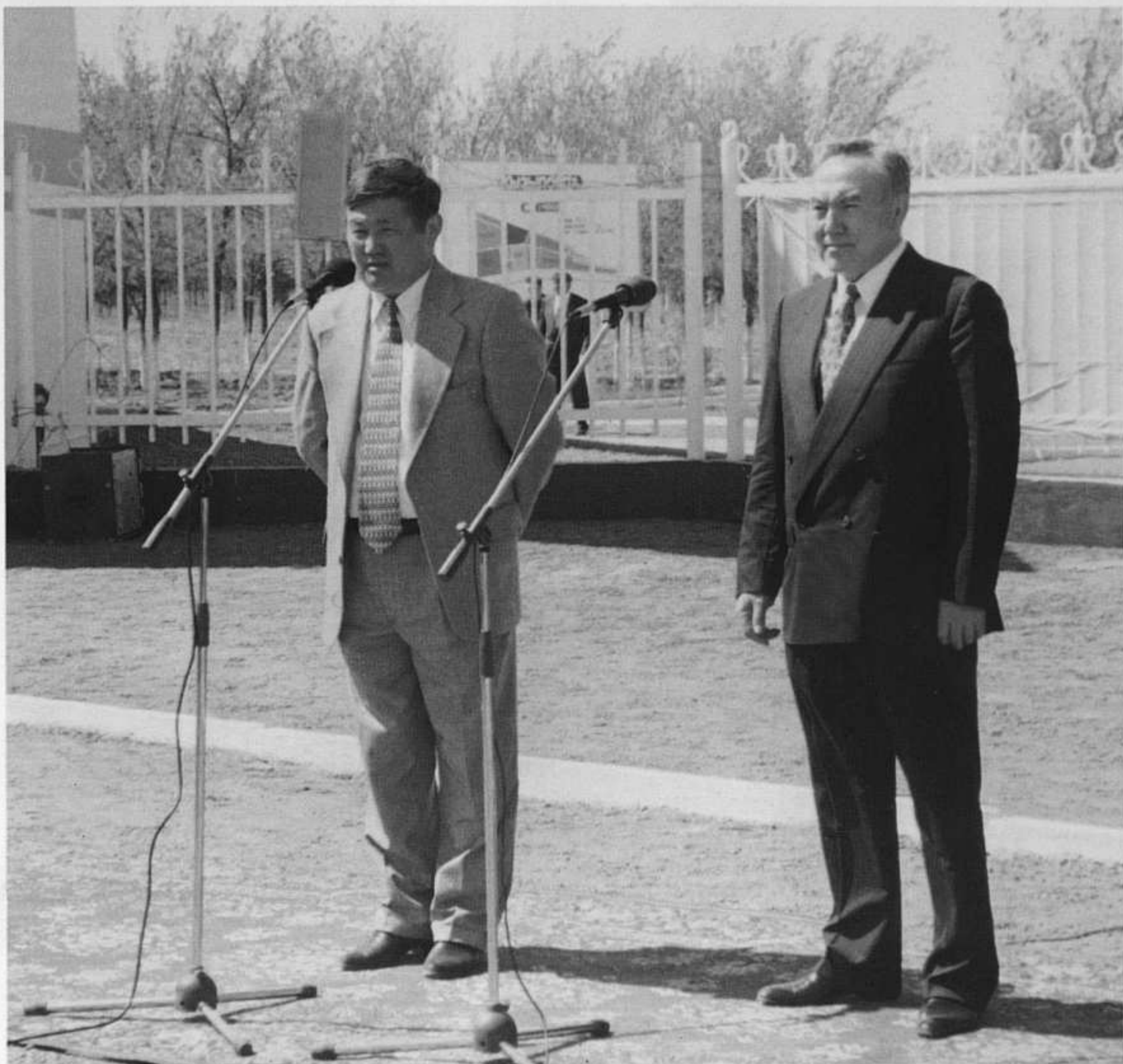
Президент Республики Казахстан Нурсултан Абишевич НАЗАРБАЕВ и аким Кызылординской области Бердибек Маибекович САПАРБАЕВ в городе Кызылорде