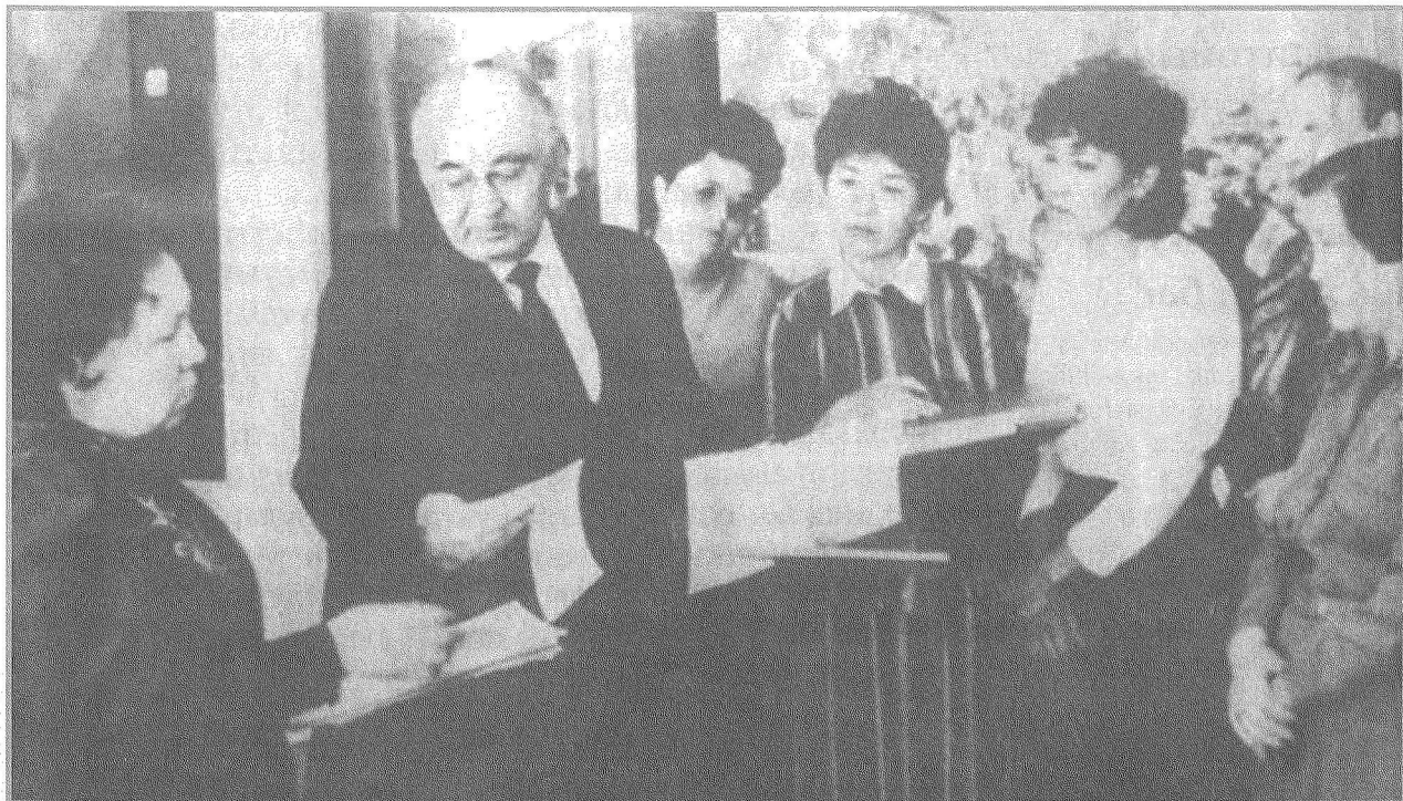
Т.Кәкішұлы С.Сейфуллин атындағы мұражайда.

Мына костюм тек жалғыз ғана екен, басқасы жоқ па деп екі-үш рет сұрадым. Жоқ екен. Амалсыз мынаны да ала салдым, юбкасын ептеп келтелеуге бо-