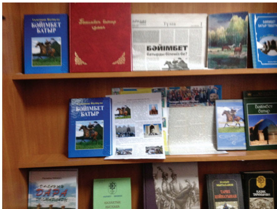
Сурет 13. Кітап көрмесі