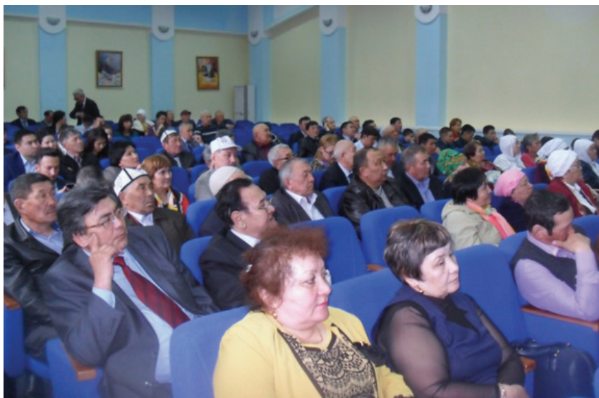
Сурет 10. Конференцияға қатысушылар