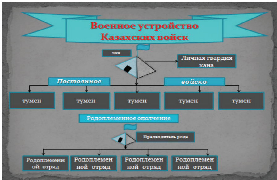
Схема 1 – Военное устройство Казахских войск (составлена авторами)

бился с хонтайшой» [4с.,90-93] ]. Числа 50, 70 тысяч очень часто встречаются в документах этого времени. Эти сведения опровергаются данными смежных, более объективных источников, которые сообщают, что «с ханом де Казачьи орды силы на поле выезжают тысяч по десяти и больше» [4 с.101].