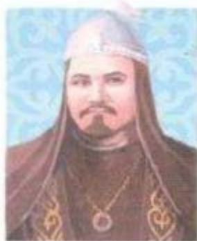
БӘЙІМБЕТ ТӨБЕТҰЛЫ (1708-1790)