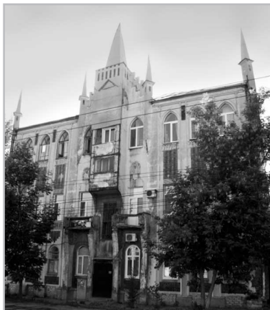
Фото № 4: Дом князя В. А. Кугушева в Самаре, расположенный по адресу: ул. Казанская, 30. Весь период пребывания в ссылке в Самаре в 1909–1917 гг. А. Н. Букейхан вместе с семьей проживал в этом доме.

4-сурет: Кнәз В. А. Кугушевтің Самар қаласындағы Қазан көшесі, 30 мекенжайында орналасқан 3 қабатты үйі. 1909–1917 жылдары Самарада саяси айдауда жүрген Ә. Н. Бөкейхан отбасымен бірге осы үйде тұрды.