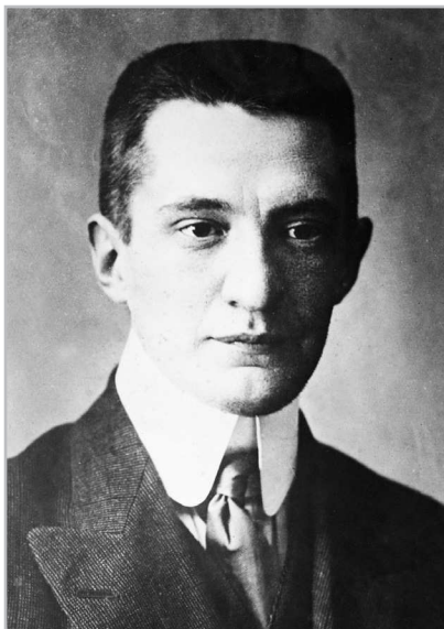
3-сурет (Фото № 2): А. Ф. Керенский (1881–1970).