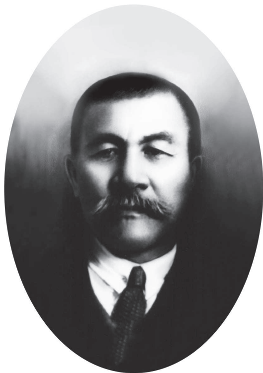
ӘЛИХАН НҰРМҰХАМЕДУЛЫ БӨКЕЙХАН

Потомки ханов имеют непреходящий долг перед казаками и, пока я жив, не перестану служить казахам!..