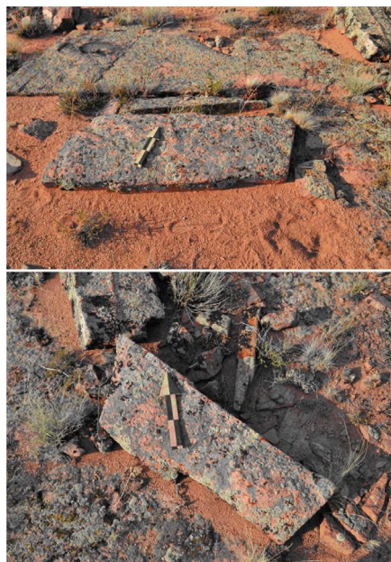
Рисунок 2 – Койшоки. Природные камни со скошенным верхом