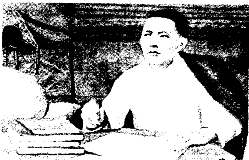
Молодой Абай. Худ. Кастеев А. 1968 г.

меня". У этих людей не хватало твердости внять голосу рассудка. Возможно, так сложи- лось из-за тотальной зависимости от клима- тических условий, социально-экономических разногласий, хозяйственных условий, обус- ловливающих центростремительные тенден- ции в номадской среде, что привело к угаса- нию благих дедовских традиций. В те вре- мена жизнь степняков с ранних времен была постоянной борьбой за пищу и другие пред- меты первой необходимости. Бедствий на их долю приходилось предостаточно, и думать