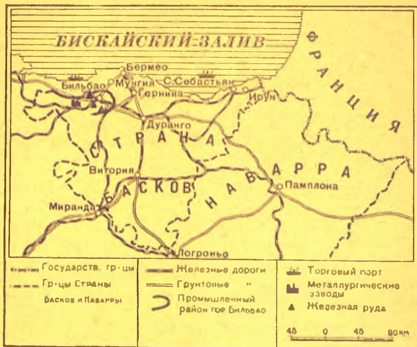
Схематическая карта Страны басков