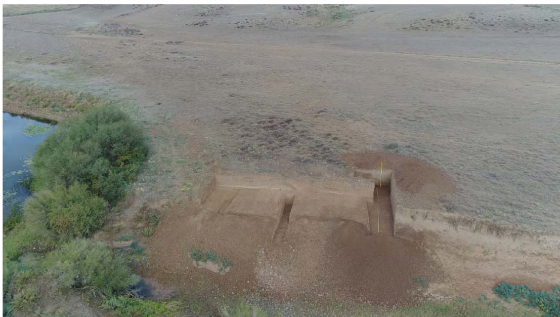
Рисунок 5. Улкен Жезды, раскоп 2018 года