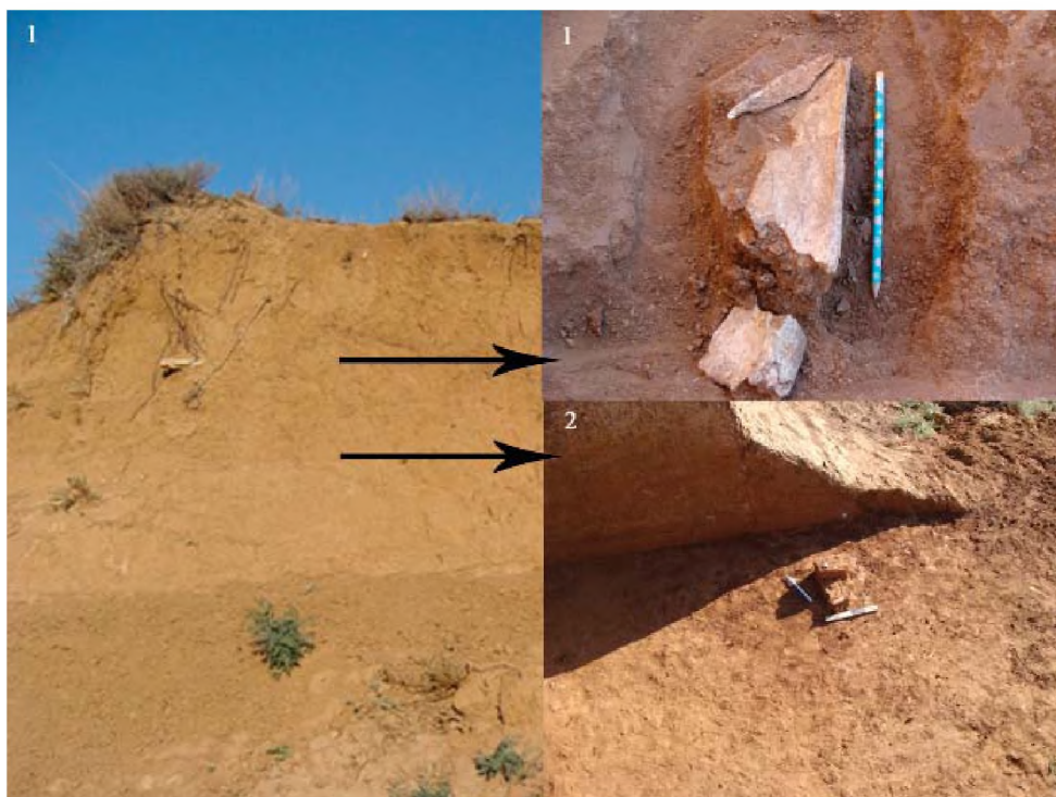
Рисунок 2. Улкен Жезды: 1. зачистка 2012 года, фрагмент кости на глубине 1,2 м; 2. каменные артефакты на глубине 1,6-1,7 м (2013 г.)

ми каменными осколками и мелкими обломками костей животных. Стратиграфическая канава (до руслового аллювия) показала, что кости и артефакты сосредоточены в верхних двух метрах.