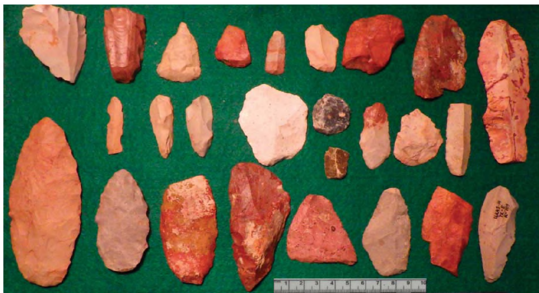
Рисунок 3. Улкен Жезды, «клад» каменных орудий, 2014 год

Площадь распространения каменных артефактов несколько увеличилась. В 1,5 м к югу от «клада» на глубине 1,1 м найдено еще одно скопление из 8 артефактов, 4 из которых представляют собой орудия: одинарное боковое выпуклое скребло, двойное прямо-выпуклое скребло, скребок и резец. Несколько очень выразительных орудий было найдено в осыпи, образованной обвалившейся стенкой раскопа 2013 г. Артефакты идентичны изделиям из «клада» 2014 г.