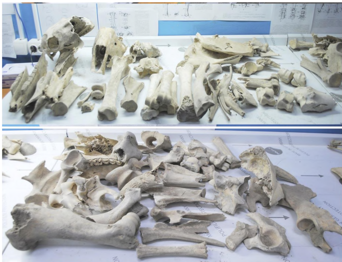
Рис. 2. Остеологические материалы городища Кастек