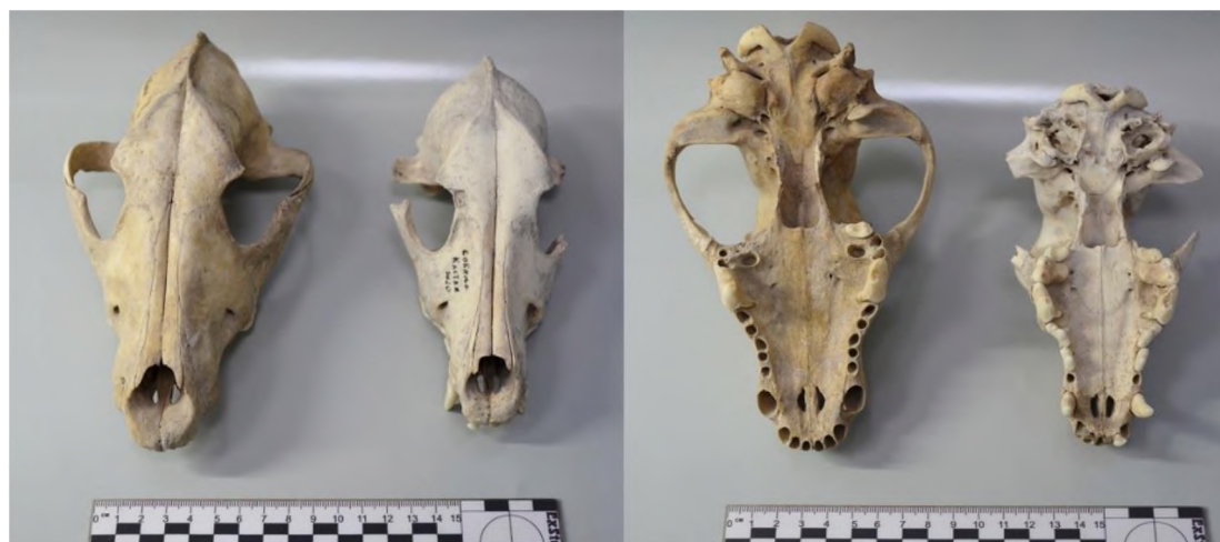
Рис. 4. Череп собаки из городища Кастек (материалы из раскопа 2019-2020 гг.)

Кастек широко использовали собаку в хозяйстве (охрана территории и скота). Кроме того, расположение городища Кастек в устье большого ущелья увеличивает необходимость использования собаки в охране.