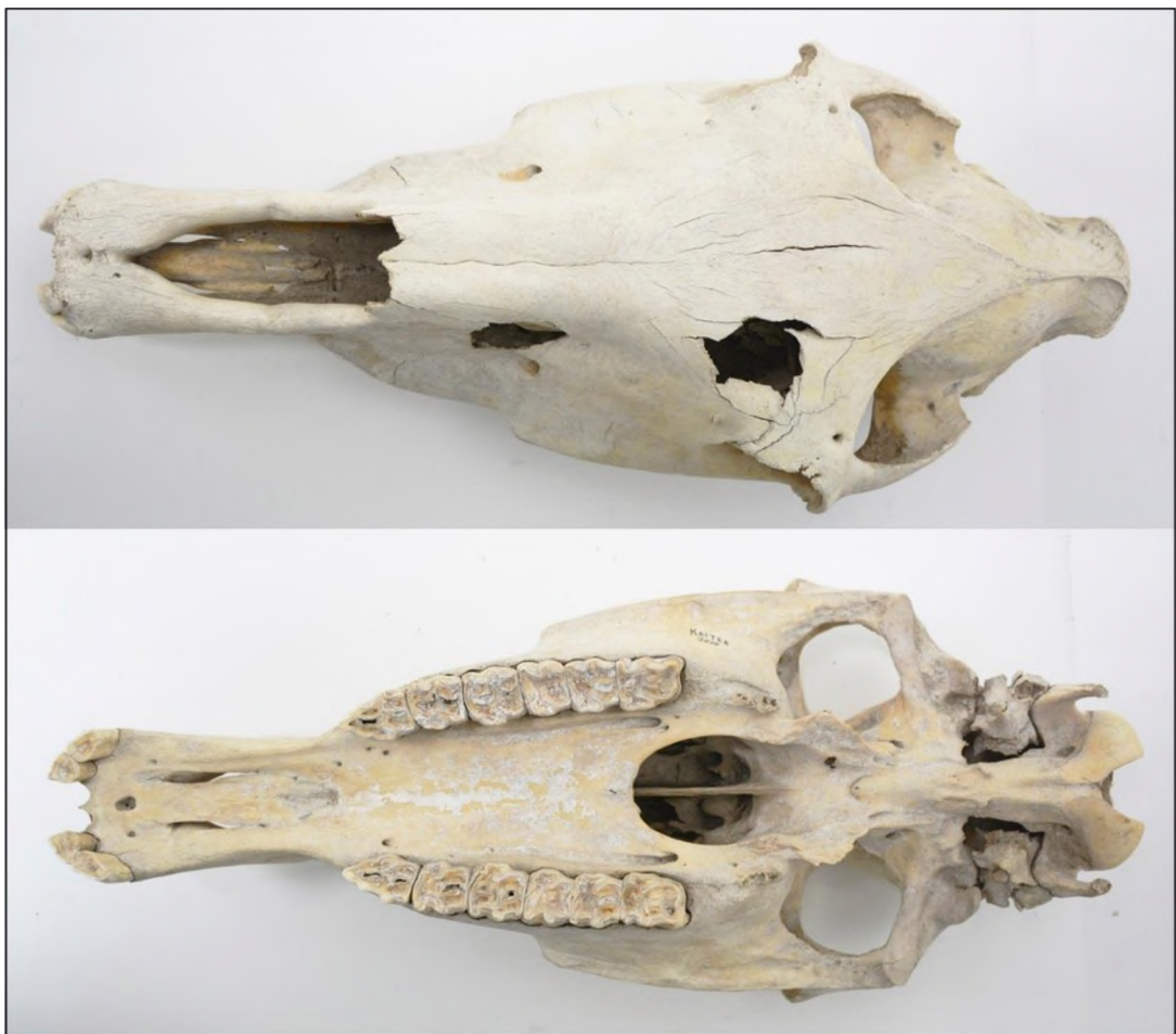
Рис. 3. Череп лошади (кобыла) из городища Кастек

Мелкий рогатый скот – Ovis et Capra . Этой группе животных принадлежит 20 костей. Минимальное количество МРС составляет 4 представителя группы (табл. 1). Овце принадлежат 13 костей (2 особь), козе - 2 кости (1 особь) и 5 костей определены как мелкий рогатый скот (табл. 1). Доля костей МРС занимает 15% от общего объема костей домашних животных. Основываясь на данных таблицы 2, можно заключить, что степень раздробленности костей - высокая (85%). Среди отделов скелета преобладают кости верхнего отдела скелета и головы, учитывая тот факт, что многие кости нижнего отдела конечностей весьма мелкие и нередко теряются при раскопках. Среди употребленной горожанами пищей в большом количестве присутствуют кости мелкого рогатого скота. Возрастной состав забиваемых животных определялся по состоянию зубной системы и прорастанию эпифизов. Отметим, что происходил забой как молодых (50%), так и взрослых животных (73%). 3 кости имеют следы погрызов, по-видимому, собаки. Кости с патологическими изменениями не обнаружены. В ранних исследованиях костных материалов городища Кастек, было высказано мнение (Д.О. Гимранов) о том, что овцеводство играло второстепенную роль в скотоводческой практике древнего населения городища Кастек (Нуржанов, Гимранов, 2019, с. 534). Результаты нового исследования остеологических материалов показывают, что с мнением Д. О. Гимранова можно согласиться.