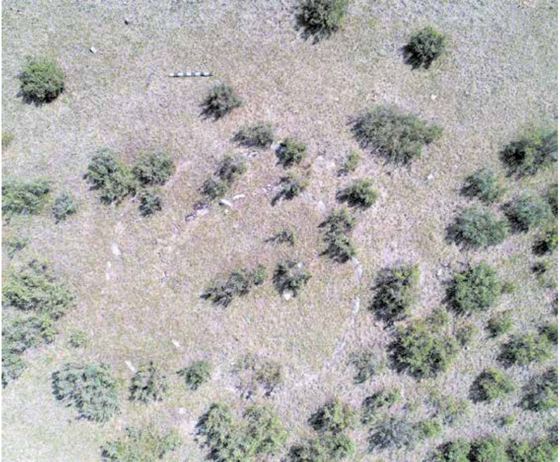
3 сурет. Ескерткіштің қазбаға дейінгі фотосы

қарағанмен жабылған, шөп өскен болды. (сур. 3) Қазбаға дейін әуеден түсірілген фото барысында қоршау шеңбер түрінде екендігі анық көрініп жатты. Қоршау тастары 0,02-0,10 м жер бетінде көрініп жатқан, олардың көпшілігі жалпақ күйде жатқандығы байқалды. Қоршаудың орталық бөлігі сәл дөңес болды, тонау белгілері байқалмады.