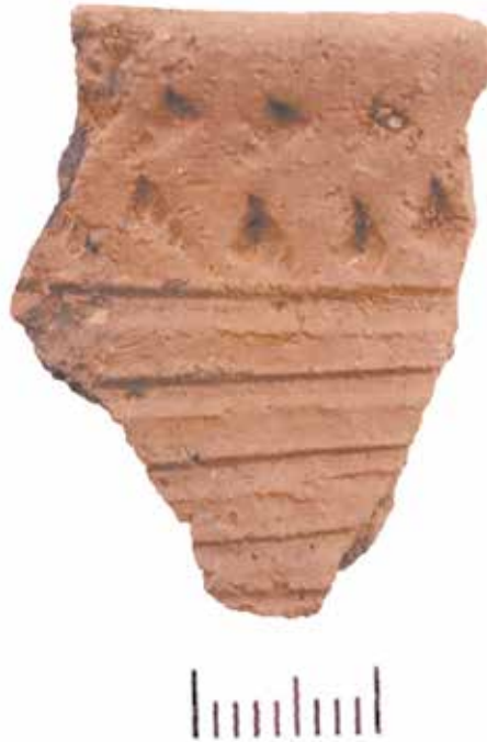
10 сурет. Тас жәшікте табылған қыш ыдыстың сынығы

Шығыс Қазақстан аумағының қола дәуірі ескерткіштерін зерттеу арқылы біз мұндағы жерлеу дәстүрінің сан алуандығы, керамикалық ыдыстардың әртүрлілігі, металлургияның негізгі орталықтарының бірі болғандығы, миграциялық үдерістердің үлкен толқынының жүргені туралы үлкен мәселелердің шешімін табуға мүмкіндік аламыз. Ескерткіштердің құрылымдық және табылымдарының ұқсастығы сол дәуірдегі мәдени байланыстардың белгілі бір деңгейінің көрінісін анықтайды.