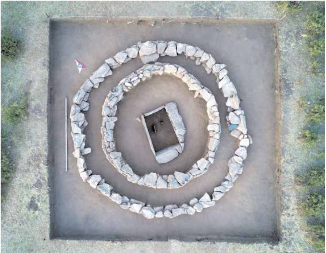
8 сурет. Ескерткіштің толығымен тазартылған көрінісі

Жәшіктің оңтүстік және батыс қабырғаларының үстінде тас қаландылар анықталды. Болжам бойынша, еден плиталары біркелкі орнатылуы үшін жәшіктің биіктігін теңестіру үшін тас қаландылар салынған. Жәшіктің оңтүстік қабырғасының үстінде 2 қатар тастар, төменгі қатарда – 5, жоғарғы – 1. Төменгі қатардағы тастар келесі өлшемдерге ие: ұзындығы – 0,38 м, қалыңдығы – 0,10 м; ұзындығы – 0,16 м, қалыңдығы – 0,08 м; ұзындығы – 0,45 м, қалыңдығы – 0,08 м; 0,55x0,37x0,10 м. Төменгі қатардағы тастарды жабатын үлкен плита келесі өлшемдерге ие: 145x0,48x0,14 м. Батыс қабырғадан жоғары жәшікке мынадай көлемдегі 4 тас орналастырылған: 0,34x0,15x0,10 м, 0,35x0,25x0,10 м, 0,95x0,46x0,12 м; ұзындығы – 0,20 м; қалыңдығы – 0,08 м.