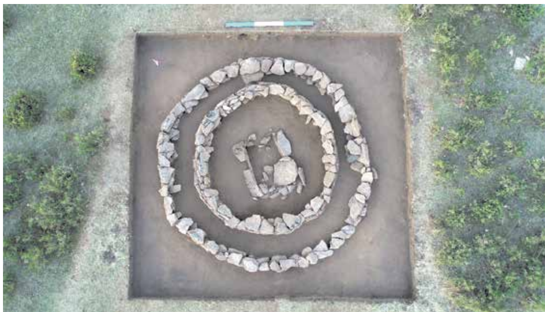
7 сурет. Материк деңгейіне дейінгі тазартылғаннан кейінгі көрінісі

Одан әрі қазу жұмыстары барысында қалыңдығы 0,20 м аралас қабат алынып, одан кейін тас жәшіктің қабырғалары анықталды (7 сур.). Тас жәшік О-С бағыты бойынша созылады, ОБ жағына аздап ауытқу байқалады.