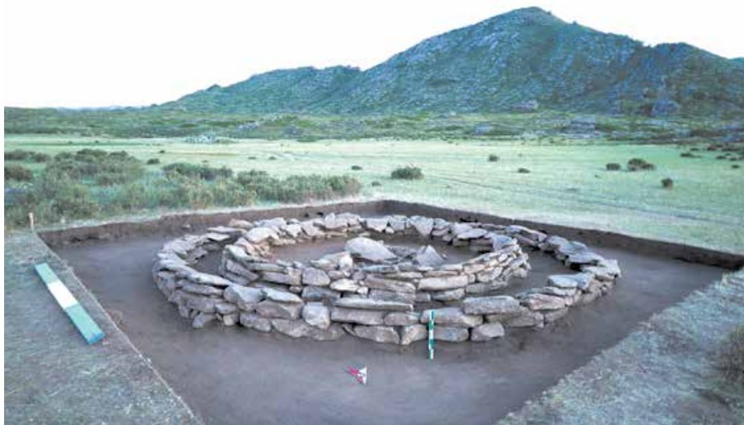
6 сурет. Қоршаудың тас қаландыларының көрінісі

Одан әрі қазу жұмыстары барысында қалыңдығы 0,20 м аралас қабат алынып, одан кейін тас жәшіктің қабырғалары анықталды (7 сур.). Тас жәшік О-С бағыты бойынша созылады, ОБ жағына аздап ауытқу байқалады.