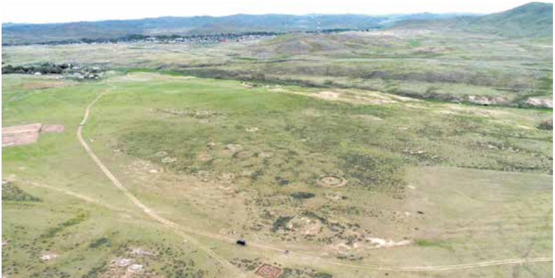
1 сурет. Қызылтас қорымының жалпы көрінісі

Мұнда барлау және ескерткіштерді есепке алу жұмыстары және топографиялық түсірілім жүргізіліп, жоспарға 113 нысан енгізілді (2 сур.). Көптеген ескерткіштер қола дәуірінің қорғандары мен қоршаулары, сондай-ақ ерте темір дәуірінің обаларынан тұрады. Бұдан басқа, қорымда топырақ үйінділі қорғандар, көне және қазіргі қазақ зираттары бар. Ескерткіштердің бір бөлігі 1970-ші жылдары зерттелген. Соның нәтижесінде қорымдағы екі мұртты оба, бірнеше қола дәуірінің қоршаулары қазылған [Арсланова Ф. Х. және басқалар 1974, 465 б.]. Ерте темір дәуірінің біраз обаларын А.А. Ткачев деген маман қазған.