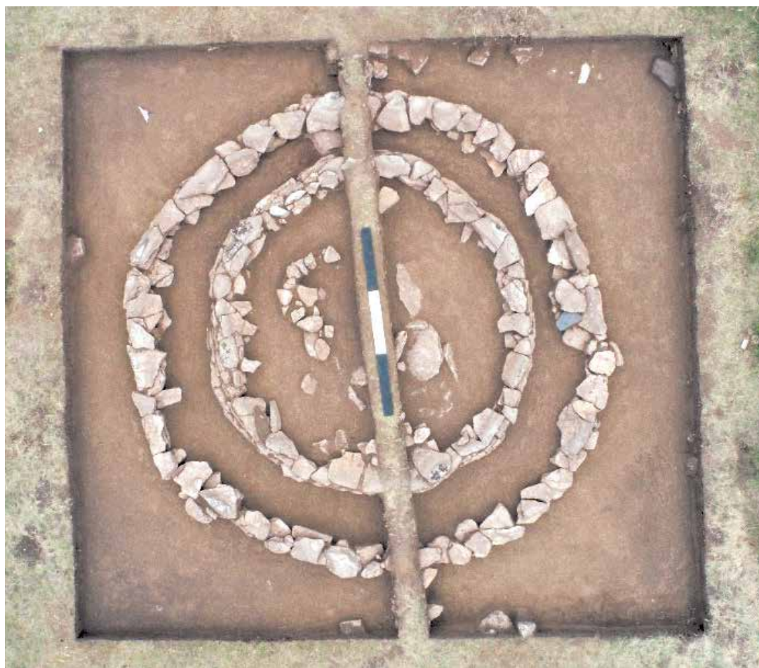
4 сурет. Қоршаудың шымтезек және қарашірік қабаты алынғаннан кейінгі көрінісі

Сыртқы қоршаудың оңтүстік бөлігінде өлшемі 0,97x0,55x0,12 м болатын үлкен плиталар белгілі болды. Сонымен қатар, орташа есеппен көптеген тастар табылды: ұзындығы – 0,29-0,55 м, ені – 0,21-0,49 м, қалыңдығы – 0,04-0,09 м. оңтүстік бөлігінде екі қоршаудың арасында ұзындығы – 0,28-0,34 м төрт тас пайда болды, олардың ені – 0,17-0,26 м, қалыңдығы – 0,06-0,12 м.