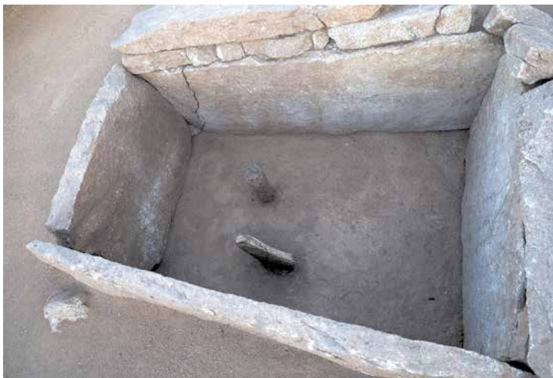
9 сурет. Тас жәшіктің ішкі көрінісі

Тас жәшіктің ішінен аралас топырақ шығып отырды. Заттай табылымдар бойынша жәшік бетінен 0,60 м тереңдікте адамның бір жілік сүйегі мен әр түрлі тереңдікте қыш ыдыстың геометриялық ою-өрнектермен безендірілген сынықтары кездесті (10 сур.). Салыстырмалы талдау нәтижесінде бұл олжалар қола дәуірінің соңғы кезеңіне жатады деген болжам жасалды. Заттардың жерлеу камерасында шашыраңқы күйде әр түрлі деңгейлерде табылуы мен қабір шұңқырының ішіндегі кездескен сынған тас бөліктеріне қарап ескерткіштің ерте заманда қатты тоналғанын болжауға болады.