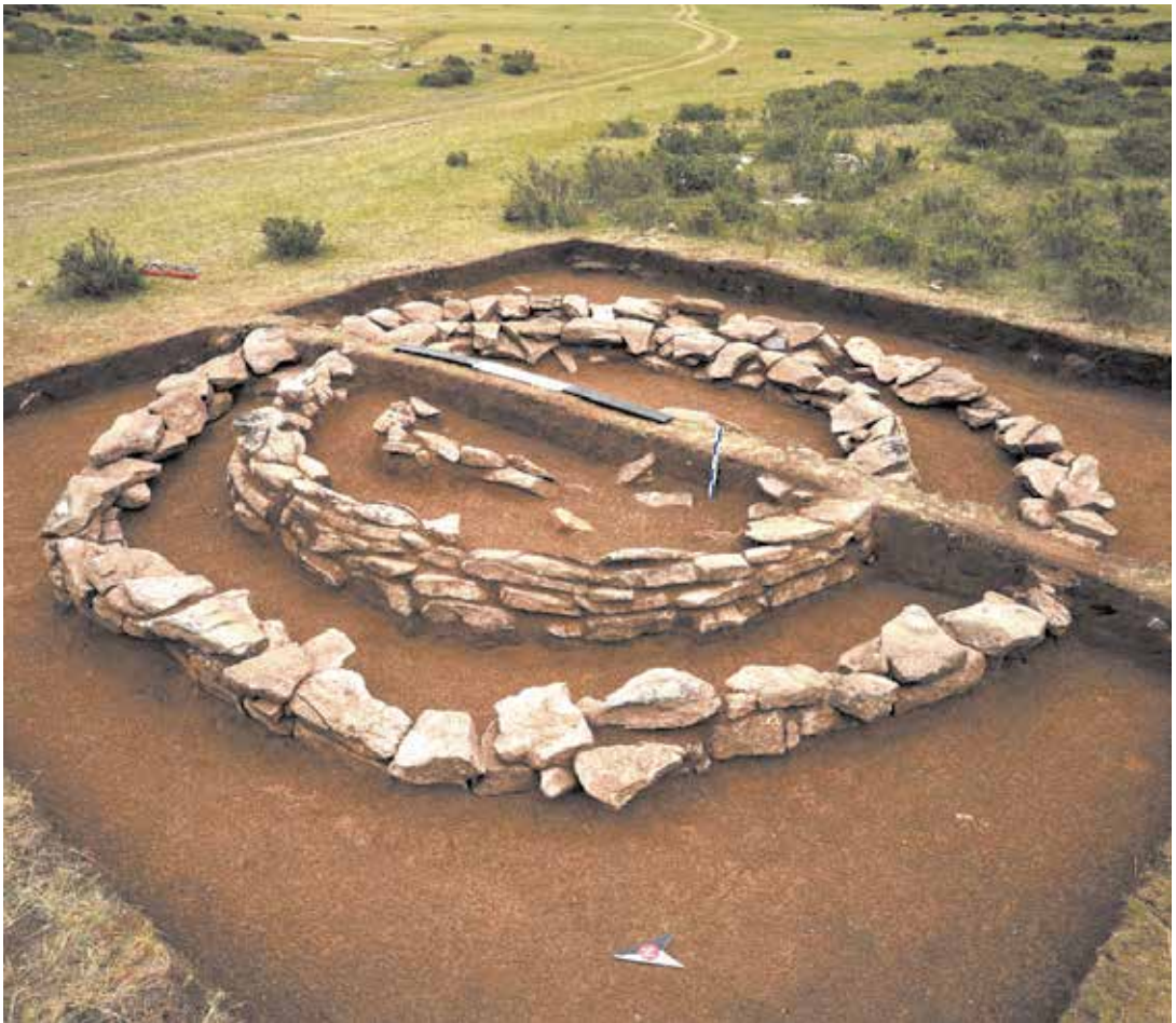
5 сурет. Топырақ үйіндісінен тазартылғаннан кейінгі көрінісі

Қазба жұмыстарының осы кезеңінде тас қоршаулардың құрылымы анықталды: оңтүстік бөлігінде сыртқы қоршаудың тастары 1-2 қатардан, ал ішкі қоршау 4-5 қатардан тұрады; батыс бөлігінде сыртқы қоршаудың тастары 2-3 қатардан, ішкі қоршаудың тастары 4-5 қатардан тұрады; солтүстік бөлігінде сыртқы қоршаудың тастары 2-3 қатардан, ішкі қоршаудың тастары 2-3 қатардан тұрады; шығыс бөлігінде сыртқы қоршаудың тастары 3 қатардан, ішкі қоршаудың тастары 3-4 қатардан тұрады (сур. 5, 6). Сыртқы қоршаудың ең төменгі нүктесіндегі биіктігі – 0,20 м, ең жоғары – 0,49 м. Ішкі тас қоршаудың ең төменгі нүктесіндегі биіктігі – 0,30 м, ең жоғары – 0,60 м. Қоршаулардың тастары ішке қарай қисайған. Ішкі қоршауда еден плиталарының сынықтары (оңтүстік және шығыс бөлігінде), сондай-ақ ұсақ тастардың жиналуы (солтүстік бөлігінде) белгілі болды.