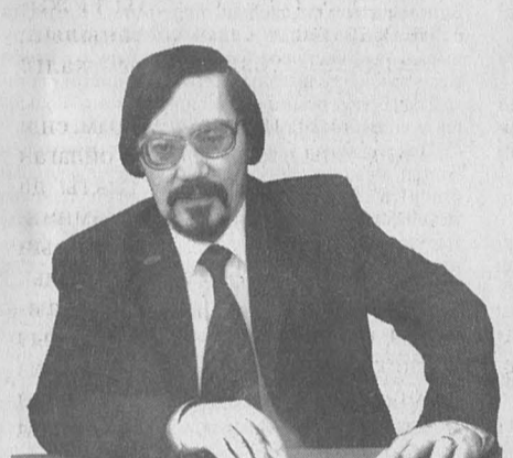
Жанат ЕЛШІБЕК, халықаралық «Алаш» сыйлығының лауреаты.