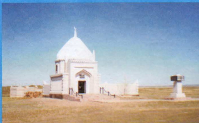
Сенкібай Қажының мавзолейі