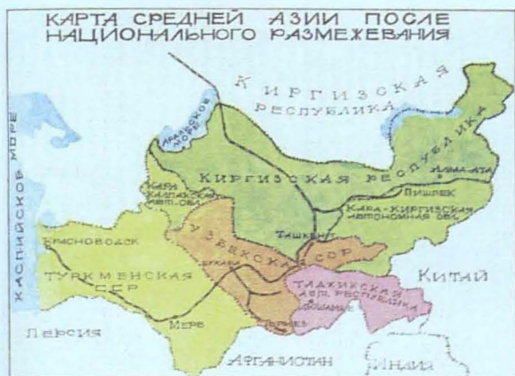
Үлттык же желеуден кейинги Орта Азия картасы