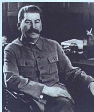
«Халыктар экеси» Иосиф Сталин