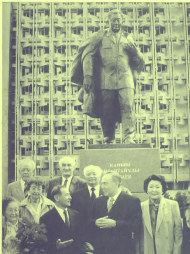
Қаныш Сәтбаев ескерткіші ашылған соң, Алматы, 12 сәуір 1999 жыл