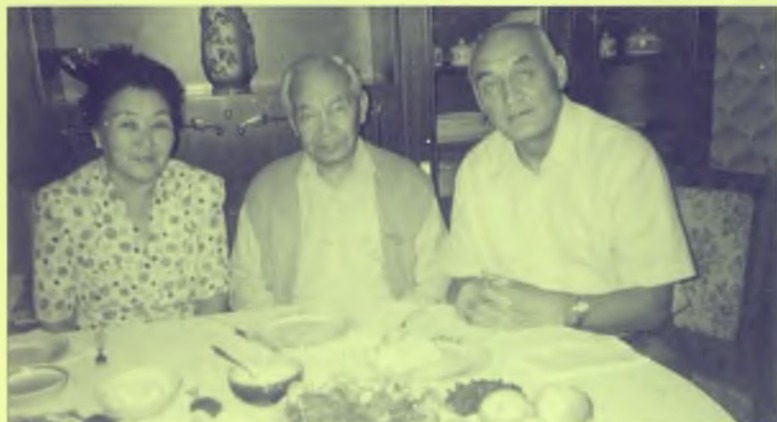
Халық жазушысы Әзілхан Нұршайықовтың үйінде: