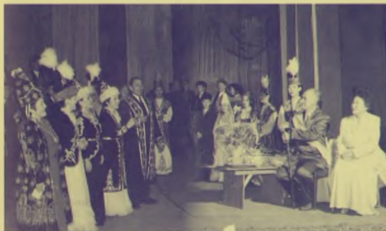
Абай ауданының "Қаламқас" ансамблі той иесін өнмен құттықтап тұр, Семей, қаңтар 1996 жыл