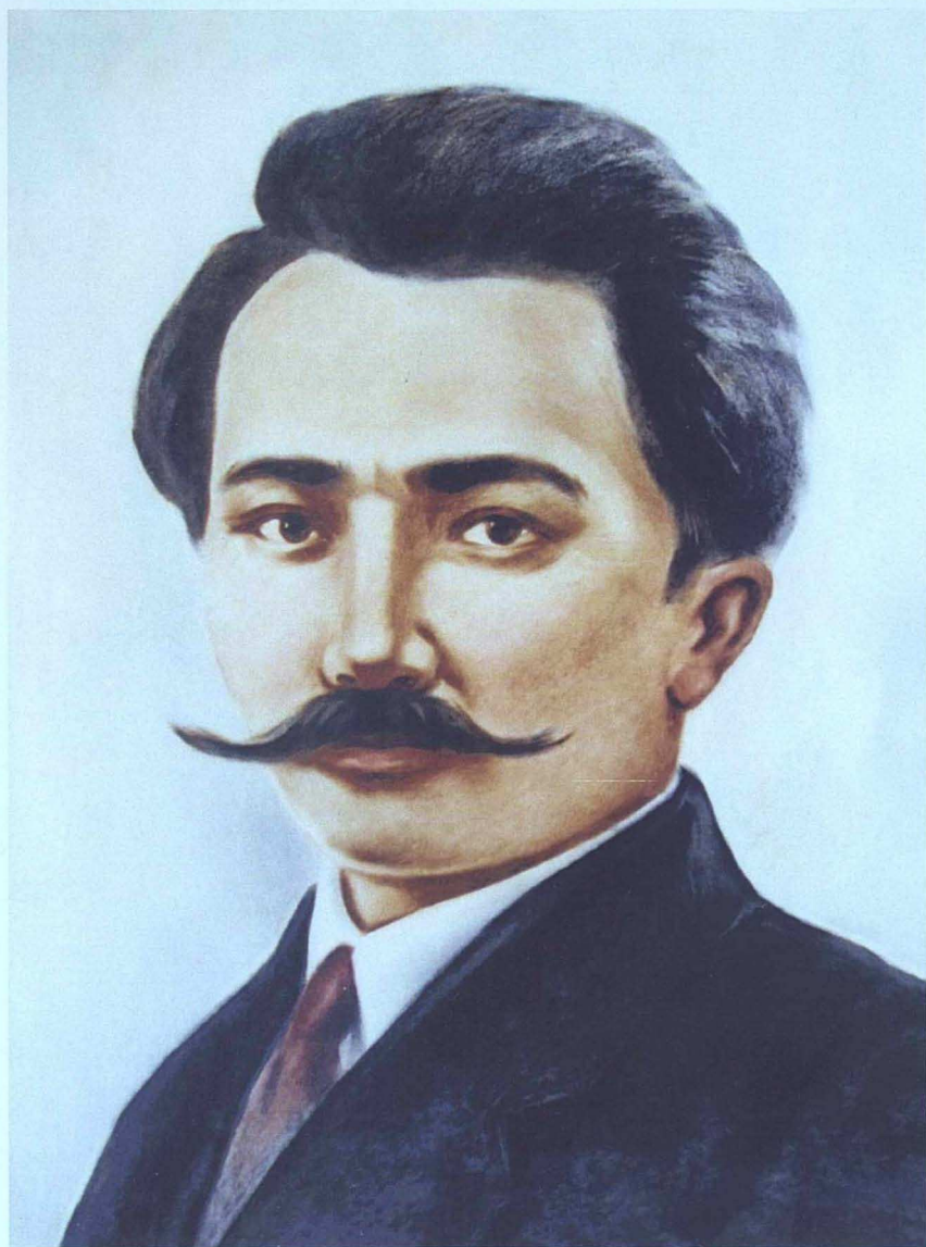
Сәкен Сейфуллин (1894-1939)