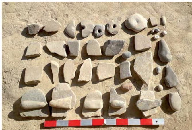
Сур. 7. Бурнооктябрьск. Тастан жасалған құралдар.