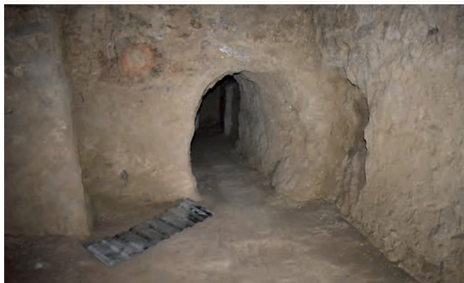
Сур. 4. Бурнооктябрьск. Қазба I, бөлме 5.