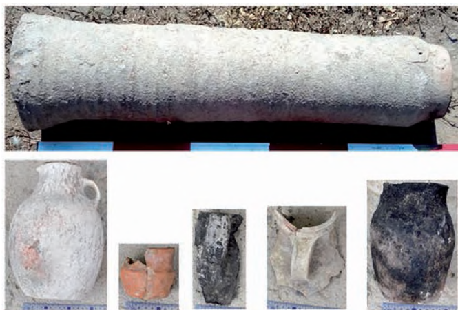
Сур. 6. Бурнооктябрьск. Керамика Fig. 6. Burnooktyabrsk. Ceramics

Қазбаның Батыс шетіндегі қабырғаның бойымен жердің бетінен 4,5 м, қабырғаның үстіңгі жағынан 3,5 м тереңдікке дейін қазылды. Оңтүстіктен солтүстікке қарай созылған 6 метрлік осы қабырғаның бетінде сырты күйе жалыннан қалған от іздері сақталған сылағы ір жерінде қалыпты. Қабырғаның шығыс шетінен 2 м кеңейтілген қазбаның ішінен ешқандай құрылыс іздері анықталмады. Топырақ және сынған кесек араласқан массамен толтырылған осы бет кешеннің жоғарғы қабатының сыртқы қабырғасының тыс бетіне ұқсас. Шама-сы кешен дәурен құрып тұрған кезде осы шығыс бет оның ауласы болған қас бетіне ұқсайды. Осы қабырғаның солтүстік шетінен жалғасып, шығысқа қарай бағытталған екінші қабырға 5 м кейін солтүстікке қарай бұрылады. Бұл қабырғаның тереңдігі де батыс қабырғамен бірдей. Тек екі қабырғаның бойы да тұтас, ешқандай есік қуысы жоқ болып шықты. Тек батыс қабырғаның оңтүстік бұрышы мен оның солтүстік қабырғамен түйіскен жерінен диаметрі 1 м бо-