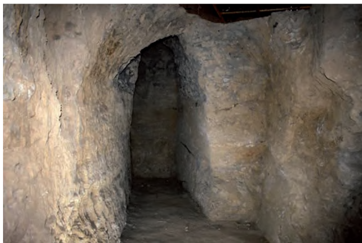
Сур. 3. Бурнооктябрьск. Қазба I, бөлме 3. Fig. 3. Burnooktyabrsk. Excavation I, room 3.