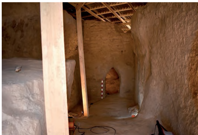
Сур. 2. Бурнооктябрьск. Қазба I, бөлме 1.