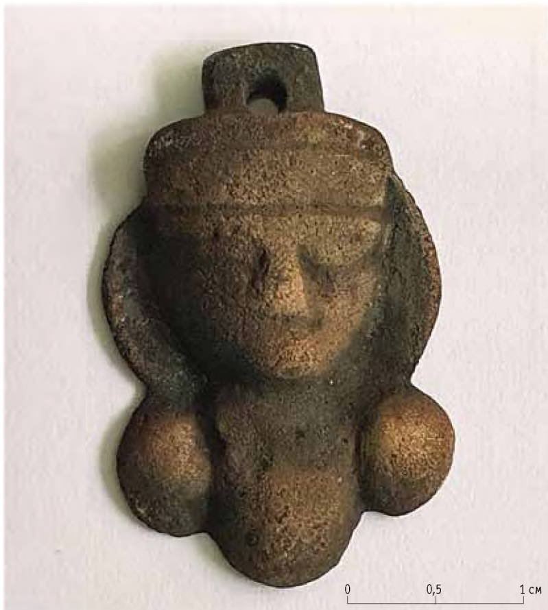
Фото 1. Бронзовая буддийская подвеска-оберег. Случайная находка на городище Актобе

Бронзовая подвеска (Фото 1, Рис. 1), вылитая в цельной форме, размеры: 3,2 × 2,1 см, толщина 0,4 см (ширина – по изображению нимба – наиболее широкой части подвески). Скульптурное изображение мелкой пластики представляет собой изображение мужского лица, монголоидного типа; его общий округлый контур мягко моделирован, тонко проработаны нос и брови, глаза слегка наклонены вниз внутренними углами, достаточно высоко подняты брови, плавно спающиеся в переносице. На голове – убор в виде лобной повязки