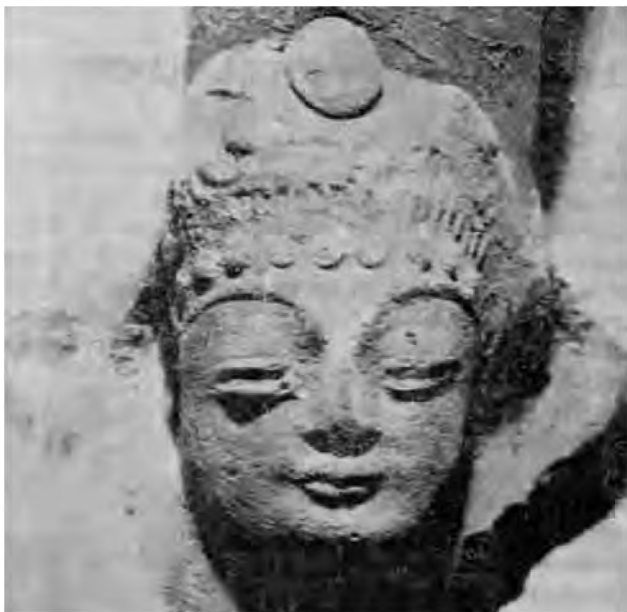
Фото 2. Буддийское портретное изображение на ручке сосуде из городища на р. Сокулук (Кыргызстан), по: Бернштам 1947: 50, рис. 33

с буддийским штампованным наделом из Сокулук VI–VII вв., по-видимому, слишком ранняя, в том числе и потому, что Сюаньцзан не обнаружил следов буддизма в 630 г. в Чуйской долине 15 . По нашему мнению, наиболее вероятна датировка этого сосуда: концом VII – первой половиной VIII вв. и была связана с китайской экспансией, в регион, в частности в Чуйскую и Таласскую долины до 751 г.