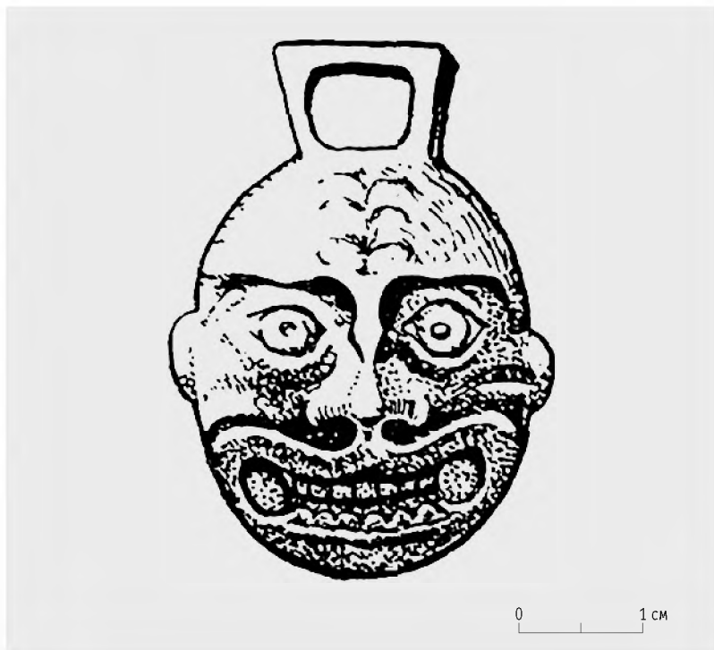
Рис. 3. Прорисовка бронзового медальона с «буддийским» изображением. Случайная находка на городище Кысмычи (Казахстан), по: Сенигова 1970: 278. Рис. 1,3

Сохранившееся левое ухо находится на уровне угла раскрытого рта. Во рту видны два ряда зубов. В местах, где кончается рот, имеется по одному округлой формы отверстию. Волосы надвинуты на брови и показаны кружками. У верхней части головы сделан подквадратной формы выступ с отверстием, для шнура. Судя по общему облику изображенного, можно предположить, что перед нами один из религиозных персонажей буддийской иконографии. Ибо, согласно религиозным догматам буддизма, главный бог Будда всегда должен быть окружен менее значительными богами-помощниками, которых насчитывалось более тысячи. Очевидно, один из таких богов-помощников, неистовый страж, истребляющий «еретиков и безбожников», и изображен на медальоне» 25 . Наследие Т.Н.Сениговой остается крайне востребованным и сегодня.