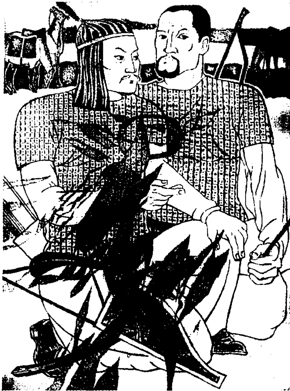
Т. Мұқатов. Исатай-Махамбет. Офорт. 1976