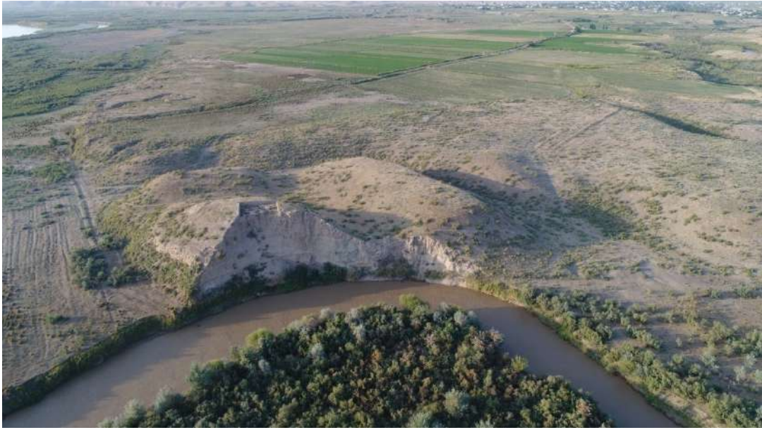
1-сурет. Күлтөбе қаласы