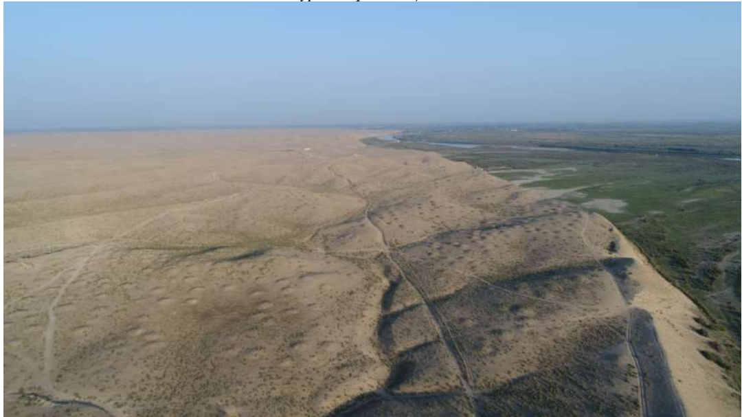
2-сурет. Мыңтөбе қорымы