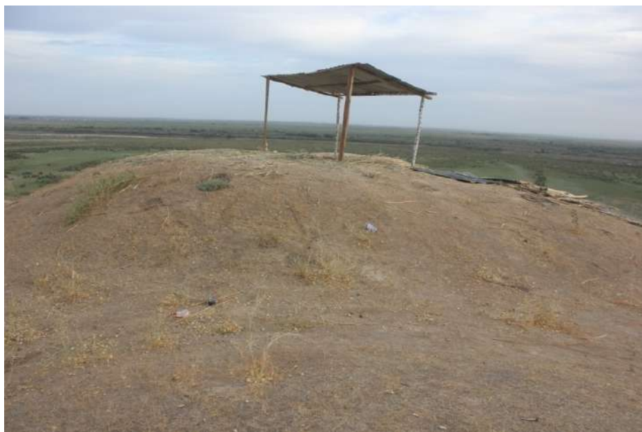
4- сурет. Мыңтөбе. Оба-қаруылтөбе