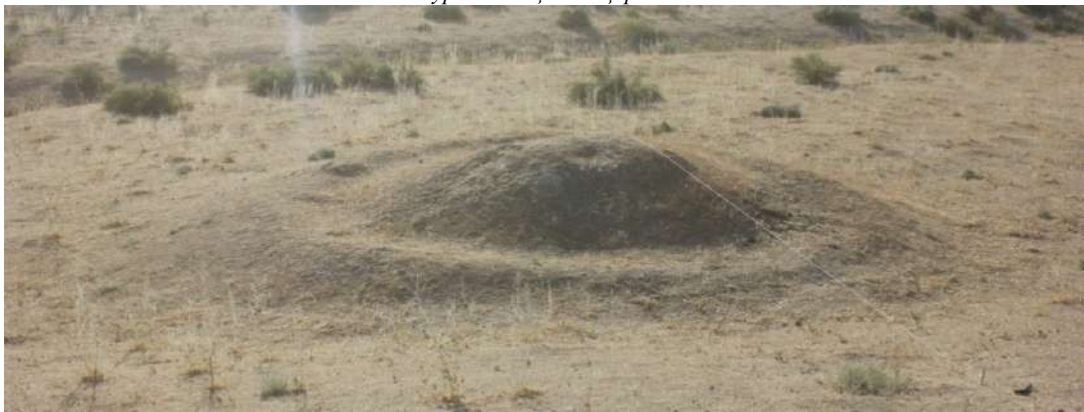
3- сурет. Мыңтөбе қорымы - Бөрік тәрізді» оба