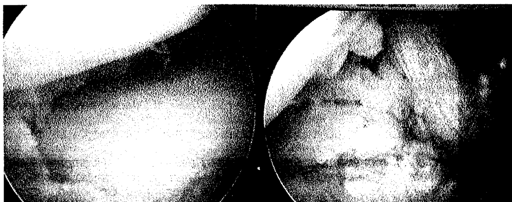
Рисунок 2 - Пациент С., 27 лет: перация – артроскопическая резекция мениска, пластика ПКС хамстринг сухожилием