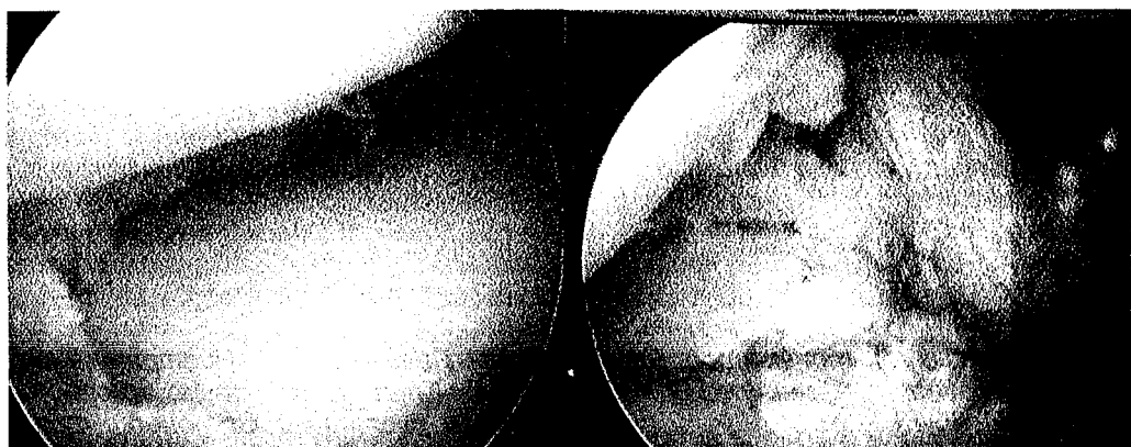
Рисунок 2 - Пациент С., 27 лет: перация – артроскопическая резекция мениска, пластика ПКС хамстринг сухожилием