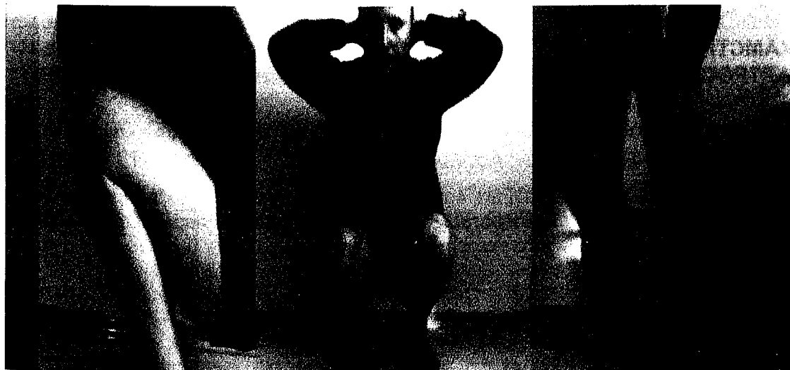
Рисунок 3 - Пациент С., 27 лет: Клинико-функциональный результат, объём движений в левом коленном суставе полный