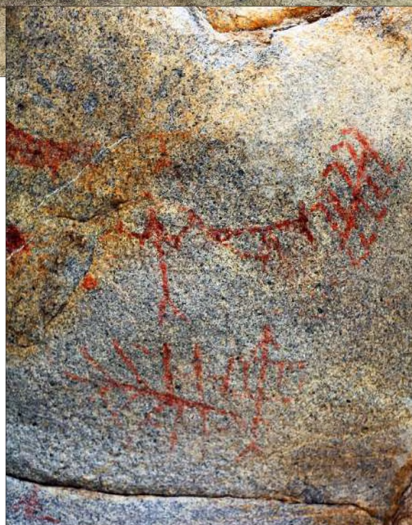
Рис. 28. Композиция на стене одного из гротов, состоящая из решётчатого ромба, антропоморфных и геометрических фигур

Остальные гроты и навесы с писаницами зафиксированы в непосредственной близости от исследуемых погребальных сооружений и поселений, которые приурочены к водным источникам, местам обильных травостоев, хорошо защищённых от ветра. Такие благоприятные для жизнедеятельности участки осваивались людьми на протяжении тысячелетий, вплоть до этнографической современности, и маркированы развалинами казахских зимовок.