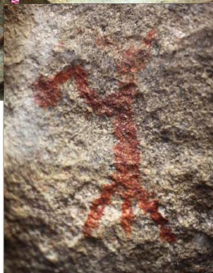
Рис. 24. Малый грот. Человек с палицей