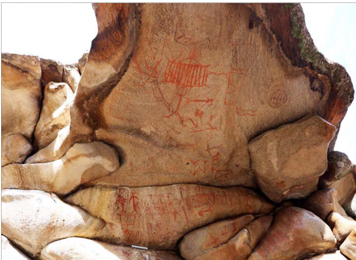
Рис. 4. Навес и стена основного грота с рисунками. Общий вид козырька с изображением круговой композиции