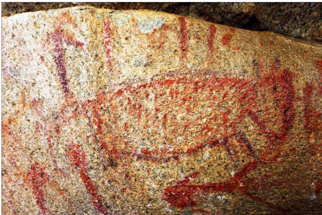
Рис. 14. Зооморфная фигура (фрагмент композиции)

части которой помещена крупная контурная фигура копытного животного (рис. 13).