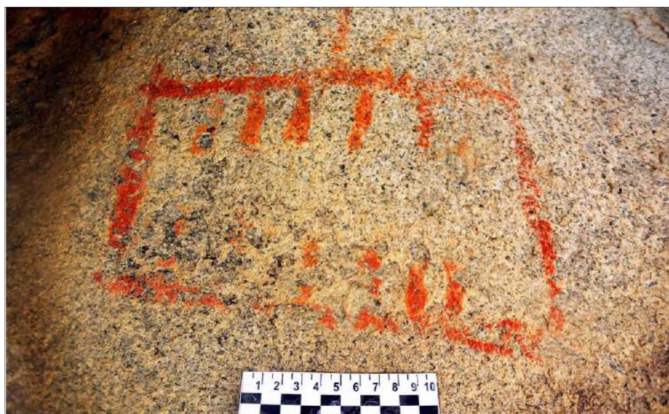
Рис. 11. Изображение многокамерного жилища (?)