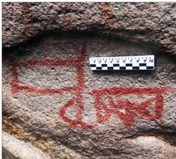
Рис. 25. Малый грот. Геометрические фигуры

В одном из следующих гротов сохранились изображения людей, расположенные вокруг прямоугольной геометрической фигуры с треугольниками внутри. Вершины треугольников направлены вверх, внутри них просматриваются точки (рис. 30). Левее и ниже этого знака показаны несколько антропоморфных персонажей, заключённых в прямоугольники. Встречаются знаки в виде косо́го креста.