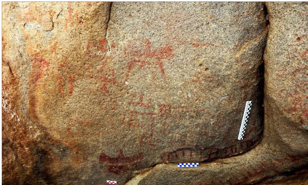
Рис. 19. Малый грот. Общий вид многофигурной композиции