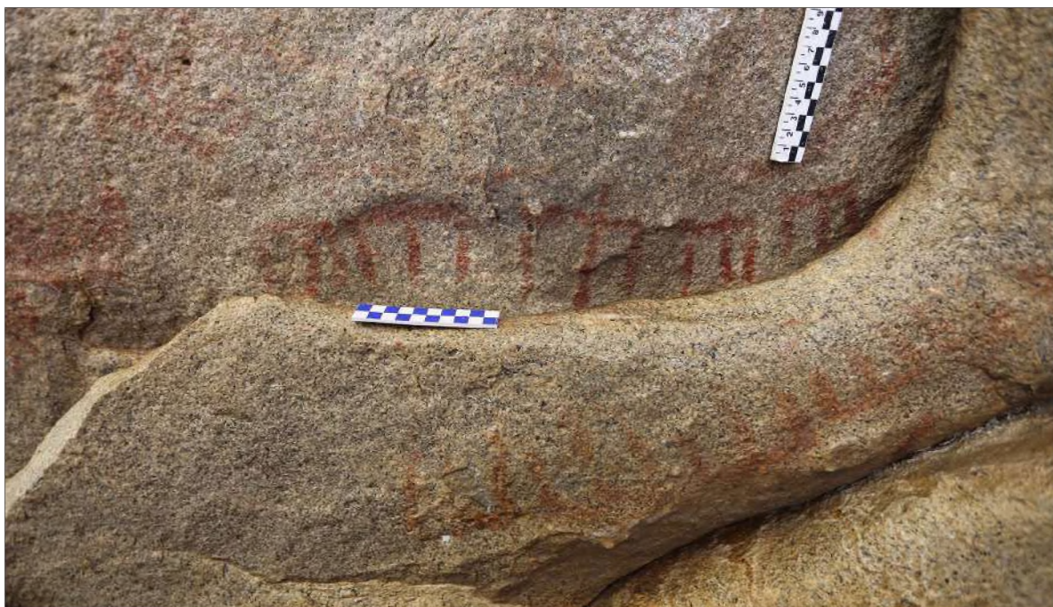
Рис. 22. Знаки-символы в виде коротких вертикальных чёрточек (фрагмент композиции)