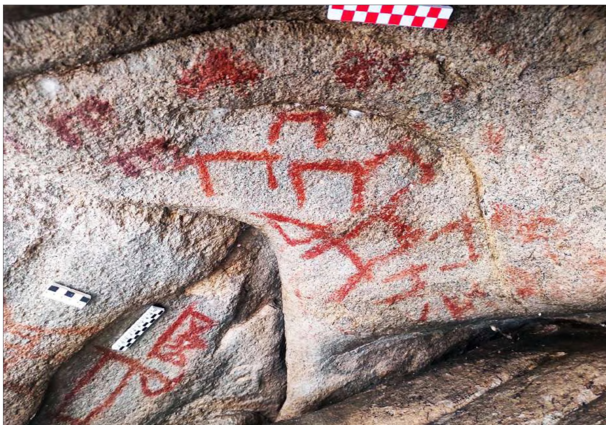
Рис. 26. Малый грот, правая часть стены. Изображения животных