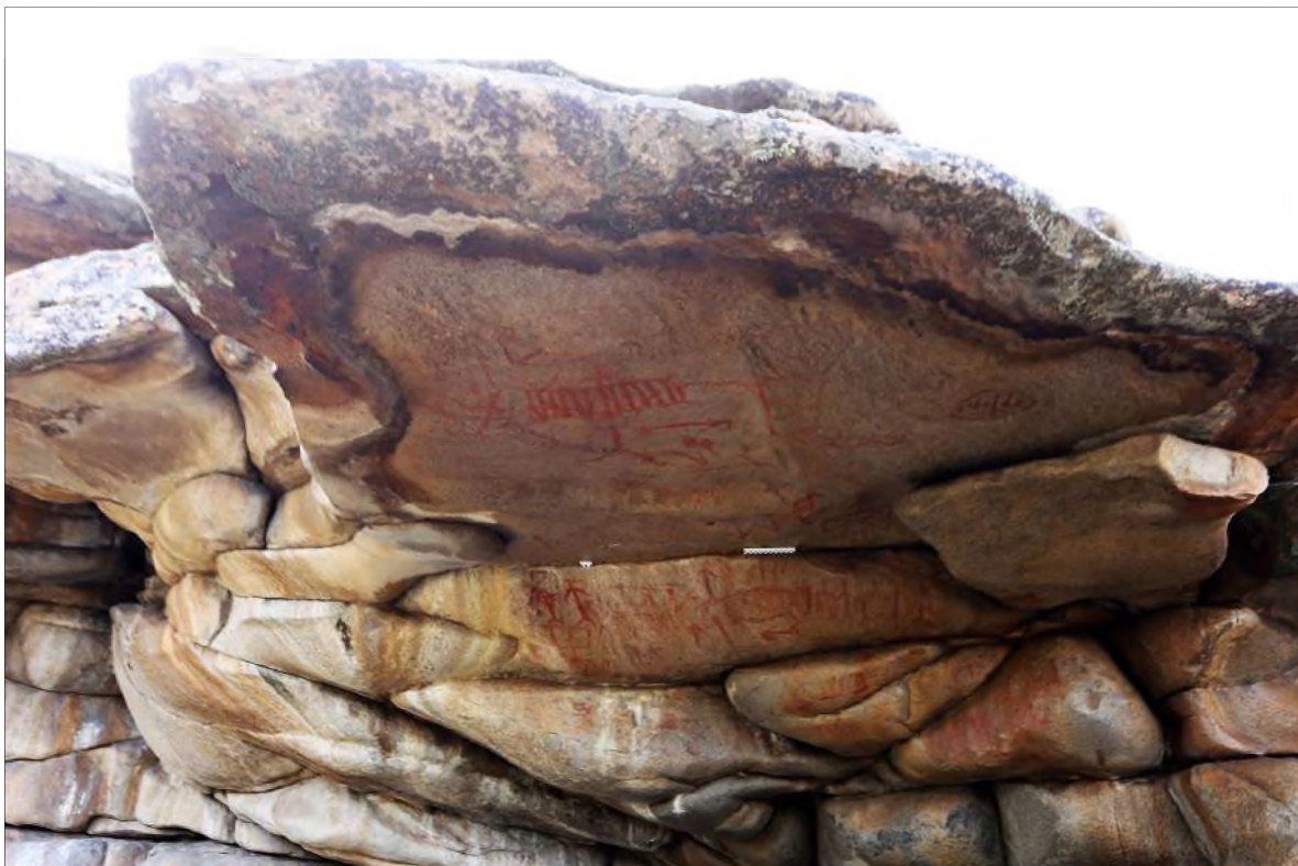
Рис. 3. Навес основного грота с писаницами