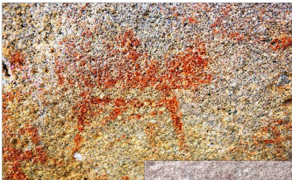
Рис. 20. Малый грот. Неопределённая фигура (фрагмент верхней части композиции)