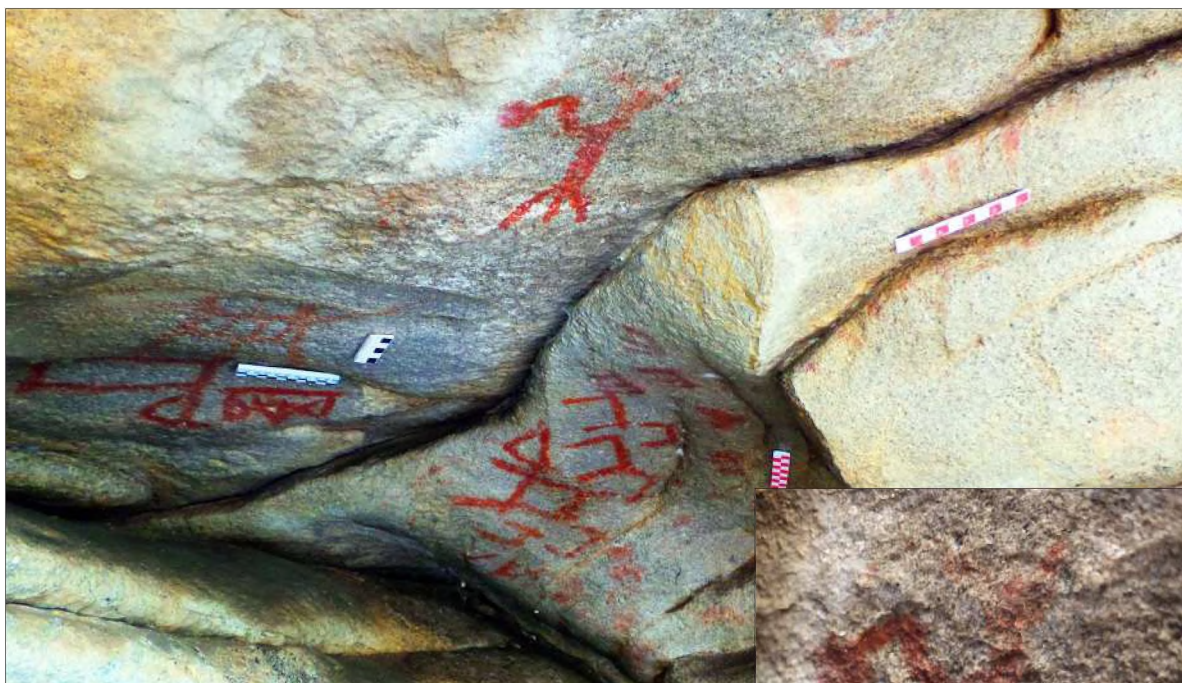
Рис. 23. Малый грот. Группы изображений в правой части стены грота