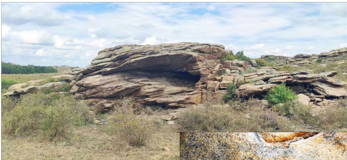
Рис. 27. Общий вид самого дальнего от исследуемого поселения и могильника грота

Отметим также небольшую контурную фигуру животного, сохранившуюся внутри одного из следующих гротов (рис. 31), изображённую в динамике.