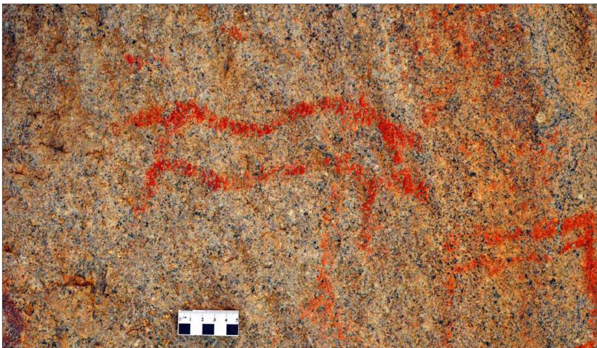
Рис. 7. Контурная фигура лошади