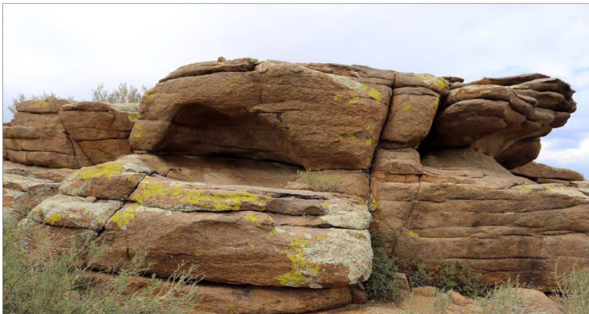
Рис. 18. Малый грот с писаницами

Ниже отмеченной фигуры человека с палицей запечатлены, по-видимому, совершающие какие-то действия люди. Сохранность рисунков слабая.