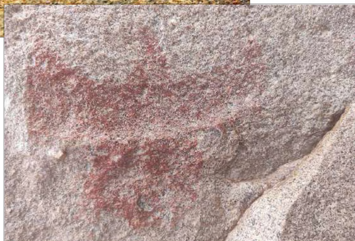
Рис. 21. Малый грот. Изображение парящей птицы (?) (фрагмент композиции)