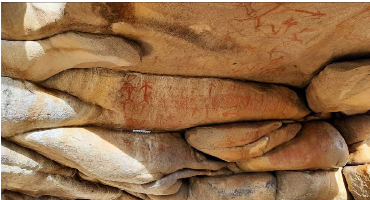
Рис. 13. Фриз в нижней части стены грота с изображениями человечков и фигуры животного

Фриз, образованный складчатой структурой скалы, содержит горизонтально организованную композицию, в центральной