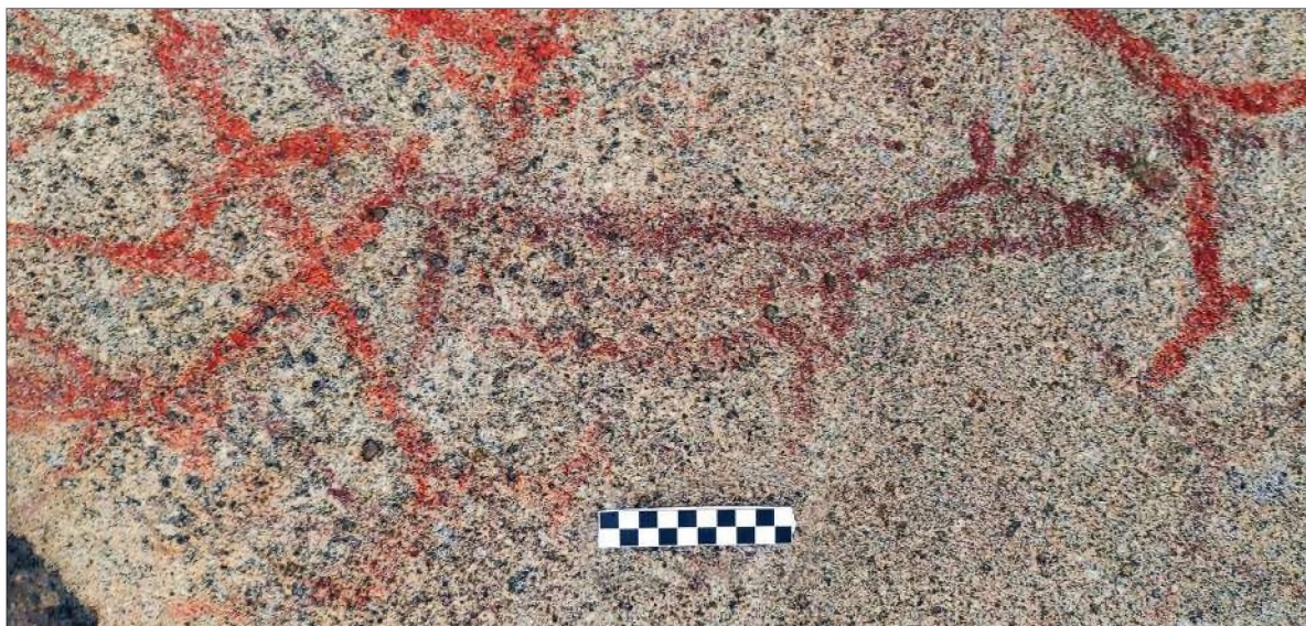
Рис. 6. Контурное изображение зооморфной фигуры с длинными ушами

Смысловое содержание данного рисунка можно связывать в некоторой степени с антропоморфизированной личиной-мас-