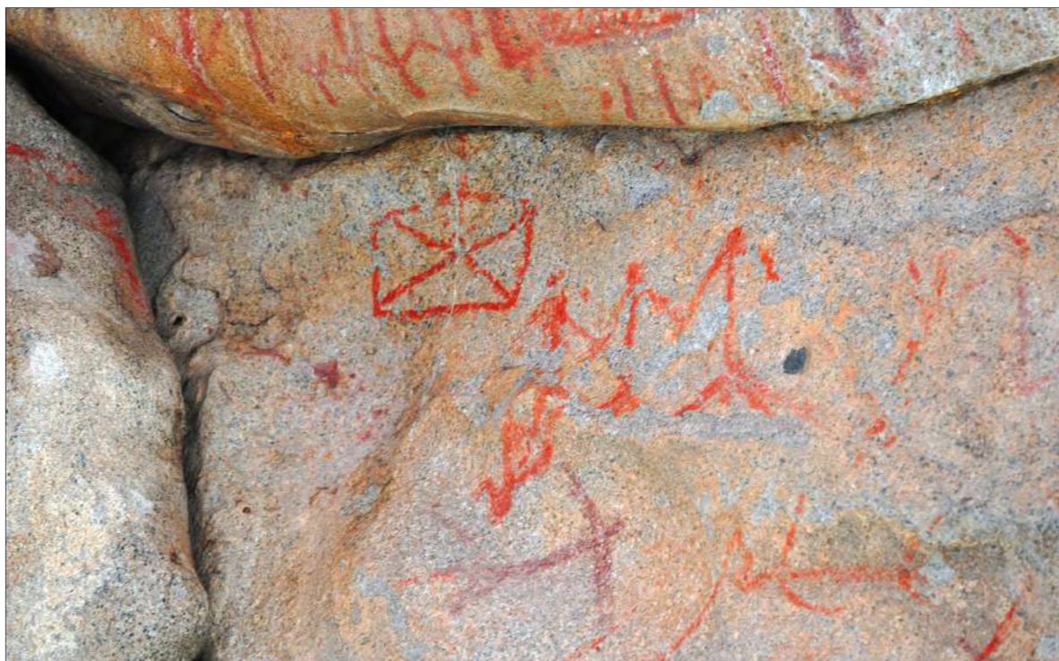
Рис. 9. Антропоморфные изображения возле прямоугольной геометрической фигуры у основания навеса

Подпрямоугольная геометрическая фигура со вписанными двумя треугольниками, вершины которых направлены друг к другу, но не соприкасаются между собой (рис. 10), является центром некоего сак-