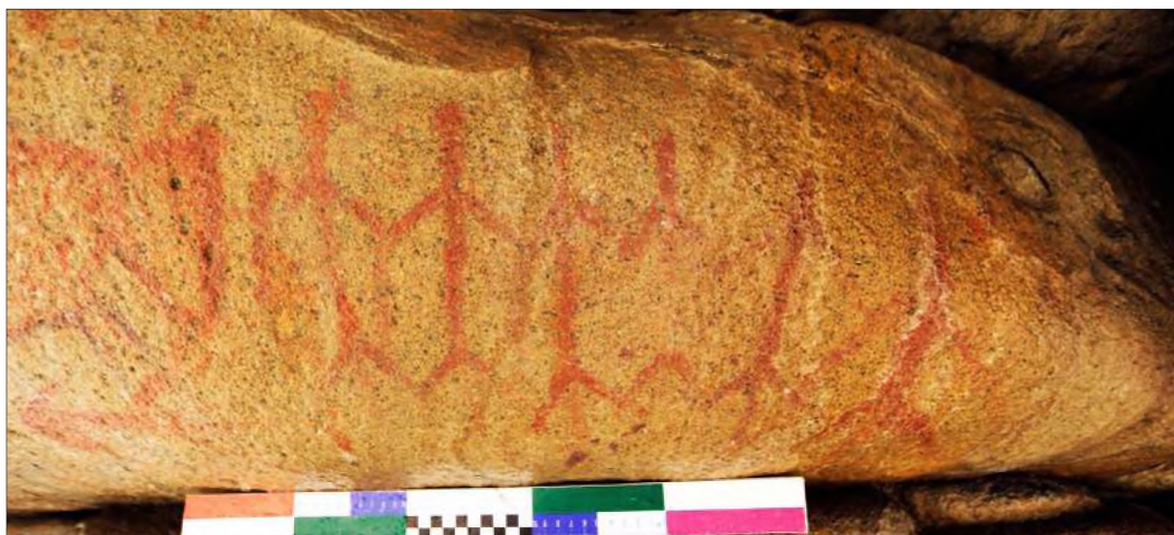
Рис. 15. Изображения «взявшихся за руки» человечков (фрагмент композиции)