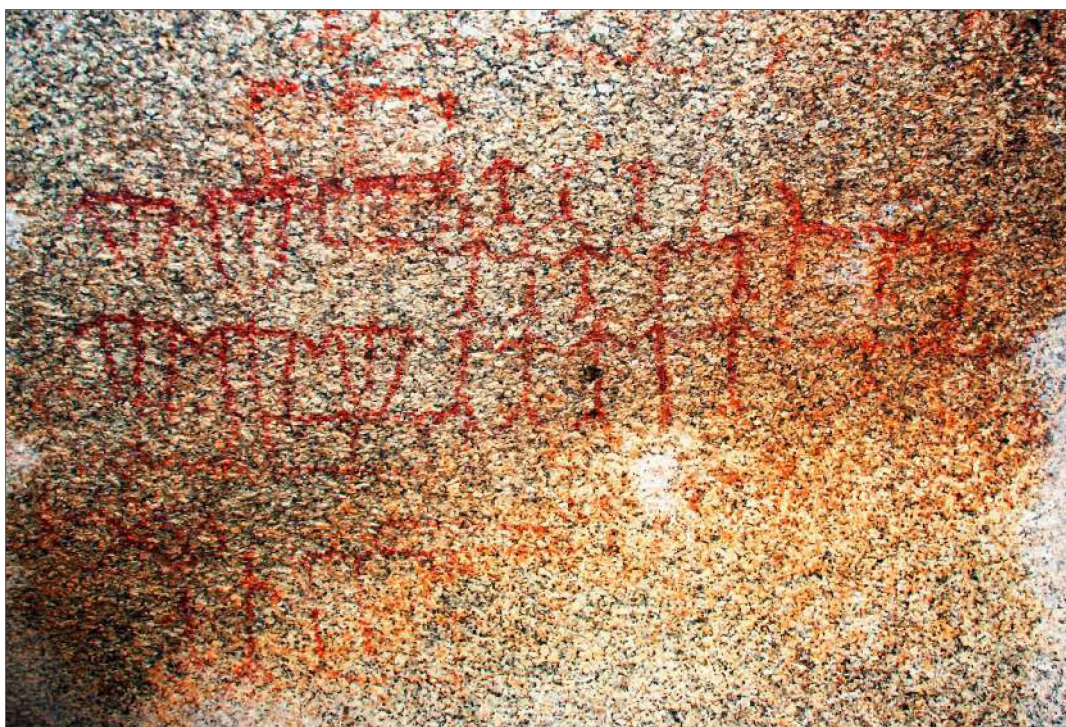
Рис. 16. Сартынбет. Фигуры «взявшихся за руки» человечков