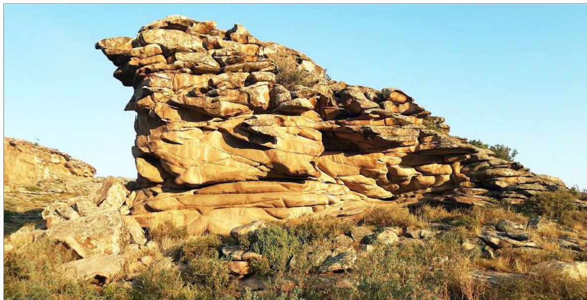
Рис. 2. Гранитный останец с писаницами

Относительно числовой символики заметим, что здесь явно присутствует значение 1 + 6 = 7 или с учётом сдвоенности боковых фигур можно указать на другое количество: 1 + 12 = 13 . Создатели данного полотна, вероятно, придавали какое-то значение числовому выражению фиксированных событий или отражённых в этих изобразительных текстах мифологем.