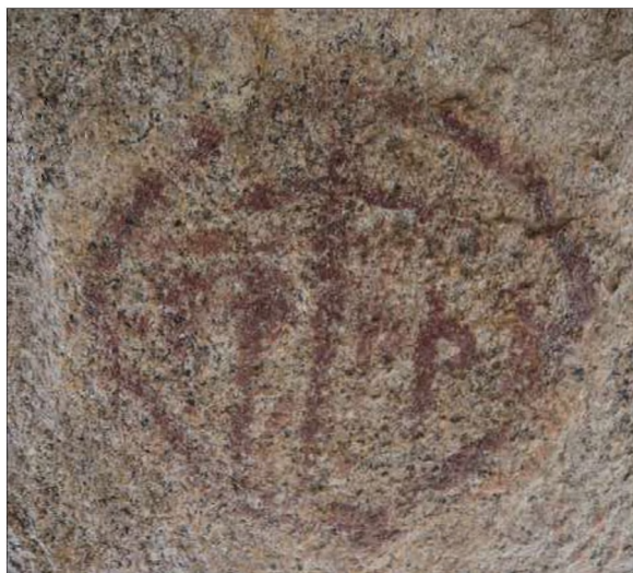
Рис. 8. Фигура, напоминающая личину, выполненная охрой коричневого цвета

кой, используемой во время мистериальных действий. Изображения личин широко распространены в петроглифах Центральной Азии, Сибири и некоторых других регионов и связаны с определёнными мировоззренческими ориентирами народов указанных территорий на разных этапах бронзового века.