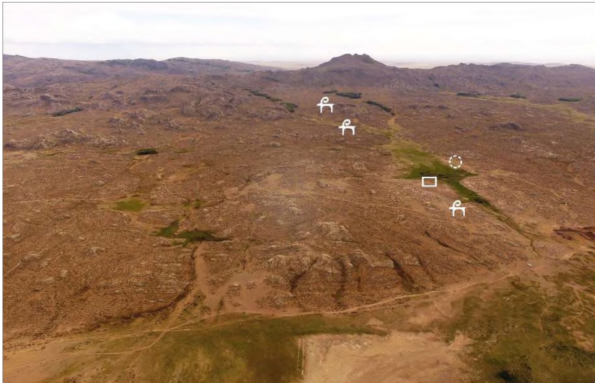
Рис. 1. Панорама участка северного предгорья Кокентау с наскальными изображениями и другими видами археологических памятников

Археологический комплекс, в состав которого входят писаницы, находится в северном предгорье Кокентау, западнее одноимённого села Абайской области Республики Казахстан. Рисунки могли принадлежать создателям поселенческих и погребально-поминальных объектов бронзового века, известных на данной территории [Доумани Дюпюй и др., 2020]. Погребальные сооружения и выложенные в определённом порядке остатки конструкций древних жилищ встречаются на обширных участках по берегам горных речек и маркированы родниками, деревьями и кустарниками. Все гроты Кокентау также приурочены к руслам ныне пересохших горных речек (рис. 1).