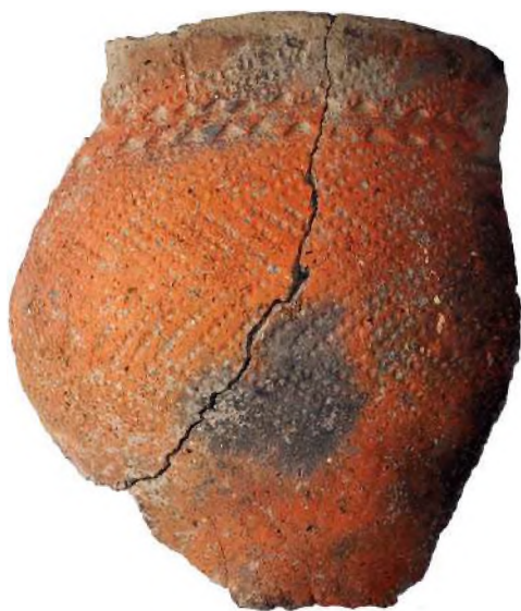
Рис. 32. Поселение Кокентау. Орнаментированная и ангобирванная керамика бронзового века

Как мы отмечали выше, некоторые рисунки, объединённые в многофигурные композиции, могут отражать идею жертвоприношения животных (естественно, в честь какого-то божества).