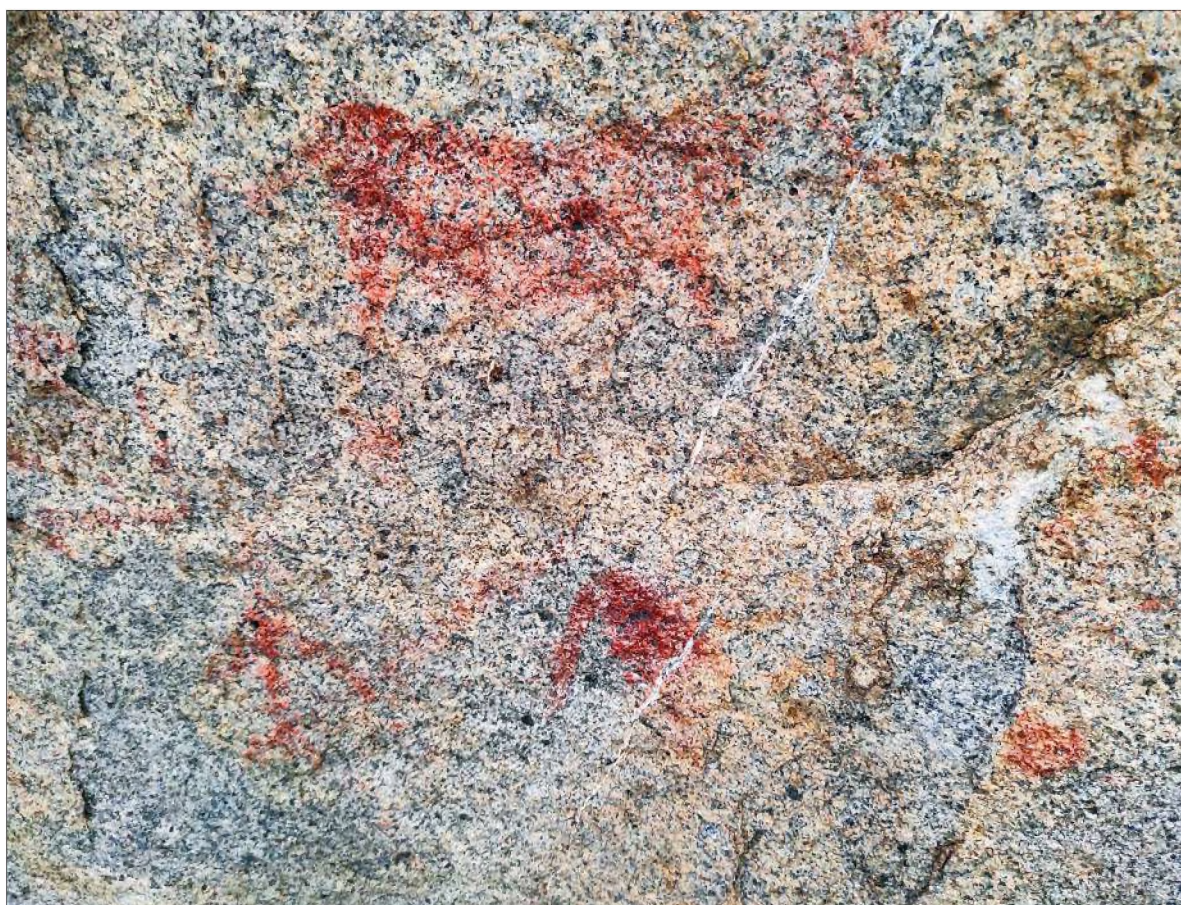
Рис. 31. Контурное изображение зооморфной фигуры