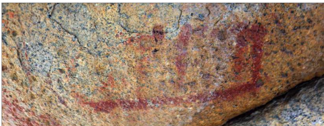
Рис. 17. Вертикальные чёрточки, «вырастающие» из горизонтальной основы