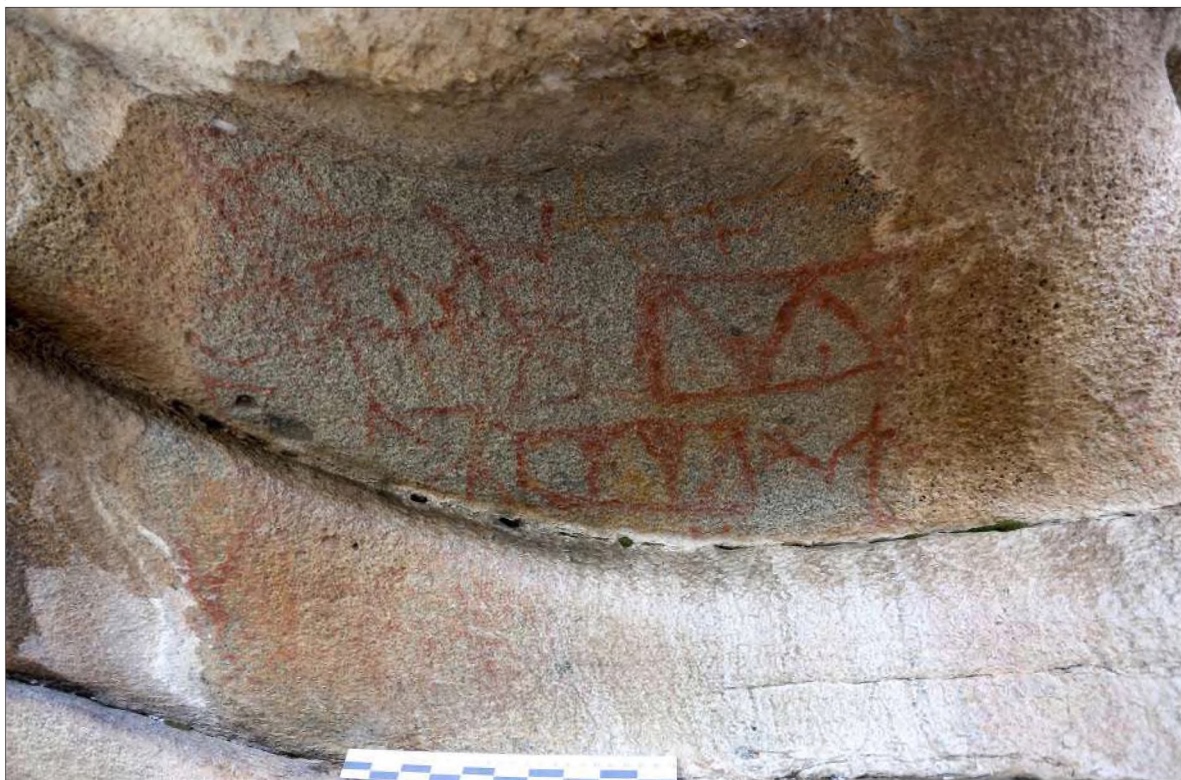
Рис. 30. Фрагмент композиции. Изображения геометрических знаков и человечков