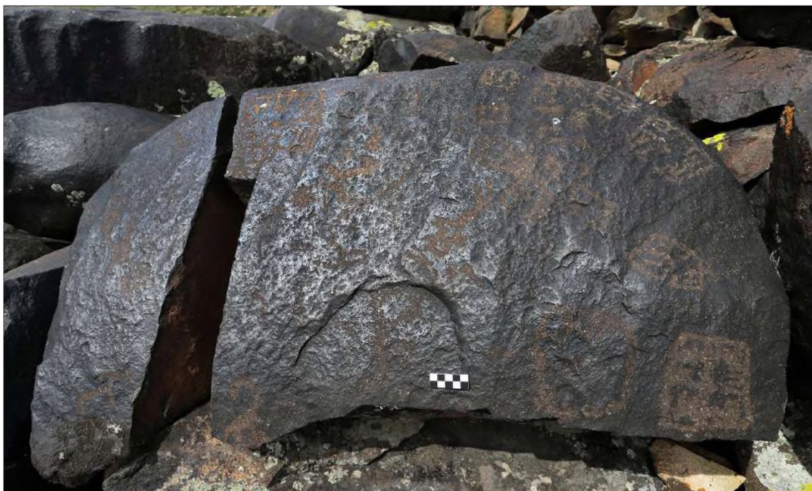
Рис. 12. Урочище Оралбай на Тарбагатае. Изображение поселения бронзового века

целые поселения – часто встречаются среди петроглифов бронзового века. В качестве примера укажем на изображения в урочище Оралбай на Тарбагатае в Восточном Казахстане (рис. 12).