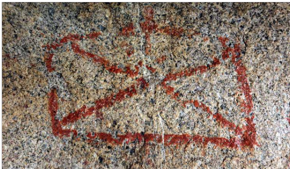
Рис. 10. Прямоугольная фигура с разрывом и двумя треугольниками, обращёнными друг к другу вершинами

Изображения комплекса жилищ, образующих некие освоенные пространства –