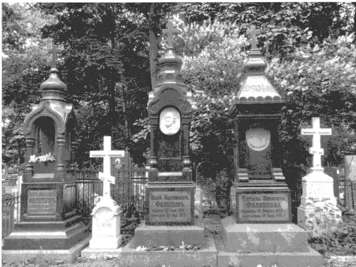
Ваганьковское кладбище в Москве