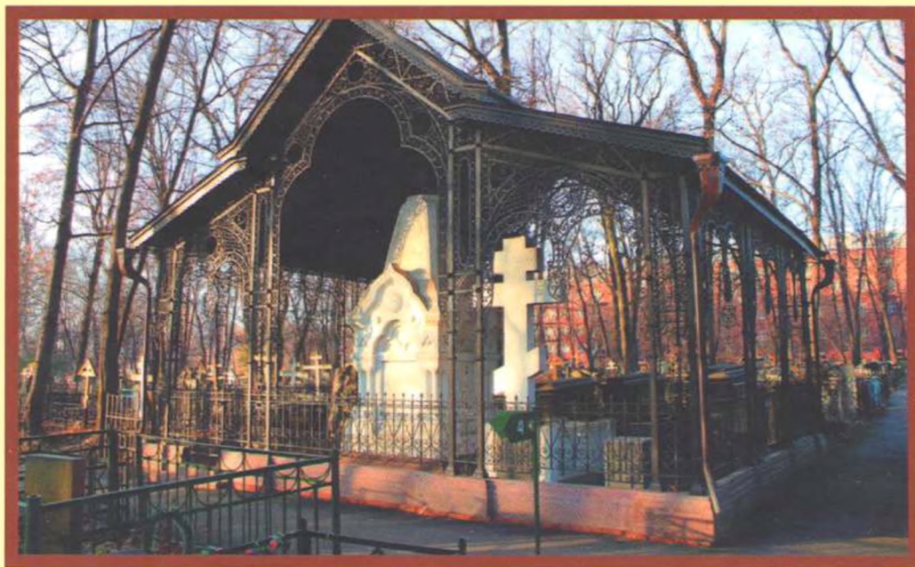
Усыпальница Морозовых на старообрядческом Рогожском кладбище в Москве

В настоящем сборнике в 4-х тематических разделах опубликована 31 статья — доклады и выступления, прозвучавшие на пленарных заседаниях и в рамках круглого стола в ходе IV Всероссийской научно-практической конференции «Исторический некрополь России как часть отечественного культурного наследия: проблемы изучения и охраны», состоявшейся в Москве 24–25 мая 2019 г. Организаторами конференции выступили Российский научно-исследовательский институт культурного и природного наследия им. Д.С.Лихачева в лице Центра краеведения, москвоведения и крымоведения при участии Фонда «История Отечества», Союза краеведов России, Московского краеведческого общества и Московской Митрополии Русской Православной Старообрядческой Церкви. В работе конференции приняли участие 65 человек, докладчики представляли 12 российских регионов и Республику Казахстан.