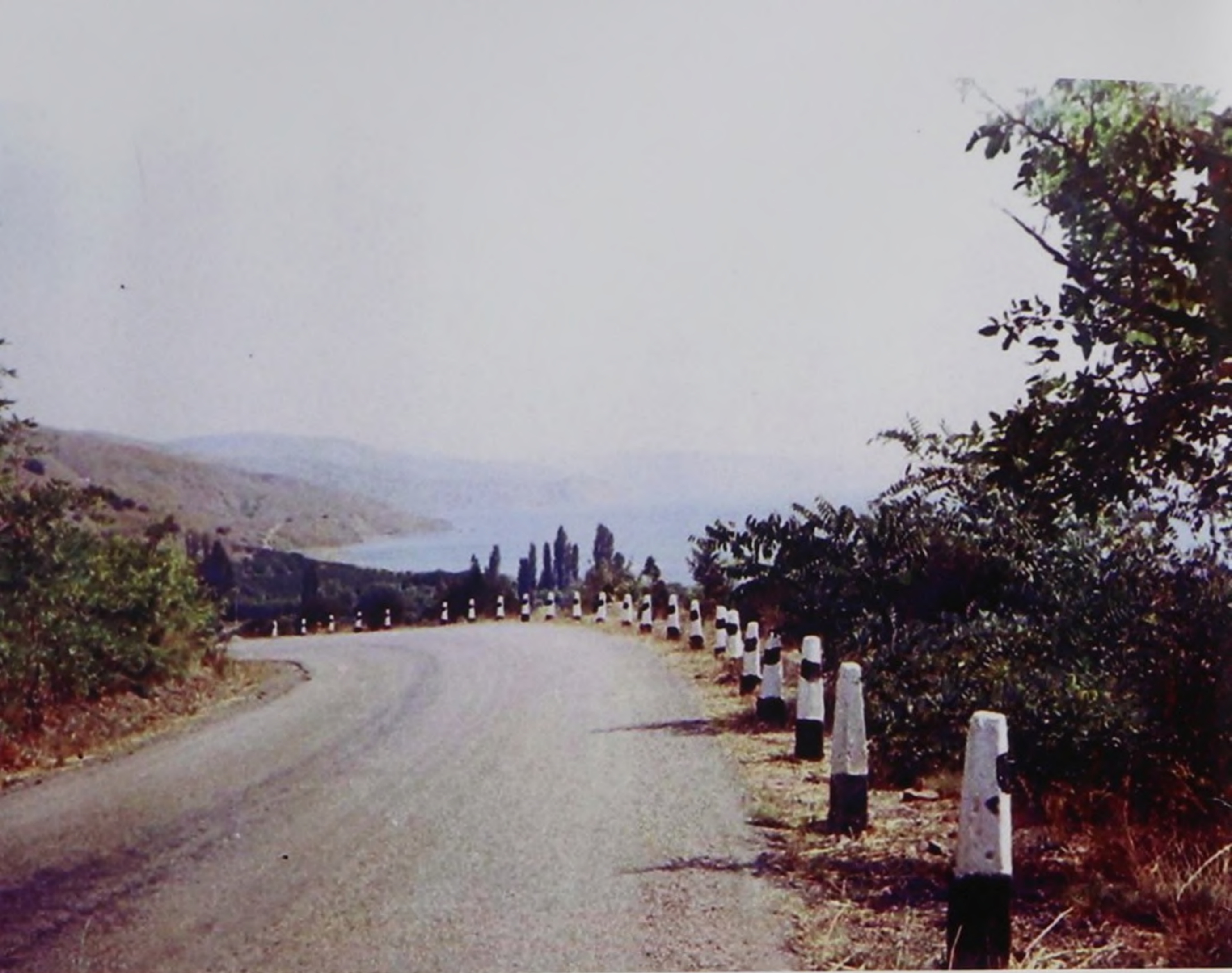
По дороге в г. Керчь

А жизнь летит, спрессовывая годы, Откладывая в памяти пласты То удивленья, то тревоги, То рухнувших надежд, То сбывшейся мечты.