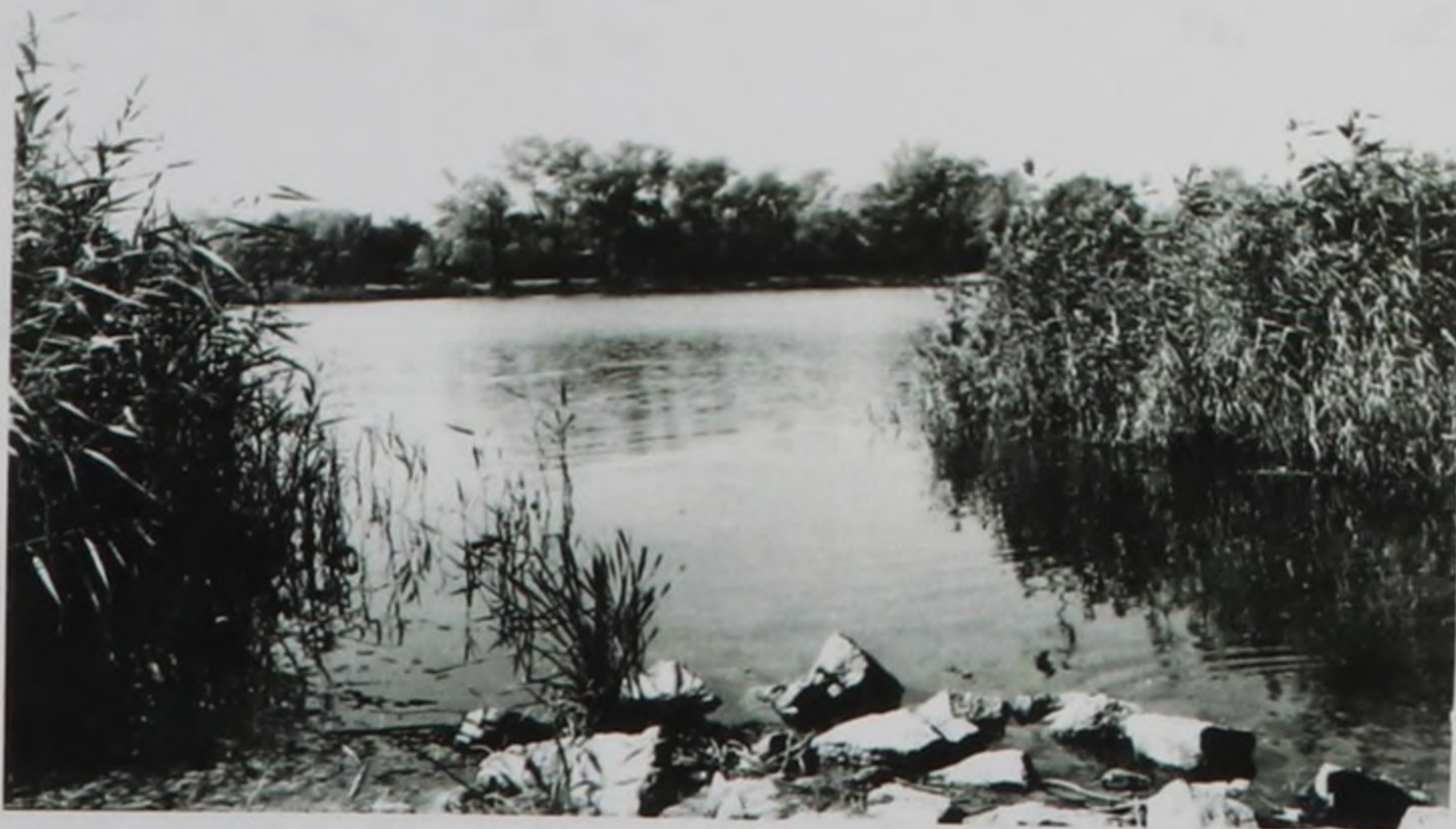
Фото автора песен

Все звёзды в небе вышли на свиданье, Дорожку освещая цвета роз. И волны, затаив своё дыханье, Застыли в миг рожденья, в миг рожденья грёз.