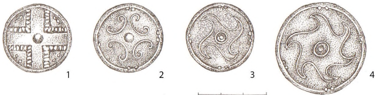
Рис. 3. 1–4: Могильник Ново-Ябалаклинский 1. курган 2. погребение 3. Челюстно-лицевая подвеска.

Бляшки: 1 – крест; 2 – крест с завитками; 3, 4 – крест в форме вихревой свастики. Автор рисунка Волкова Н. В.