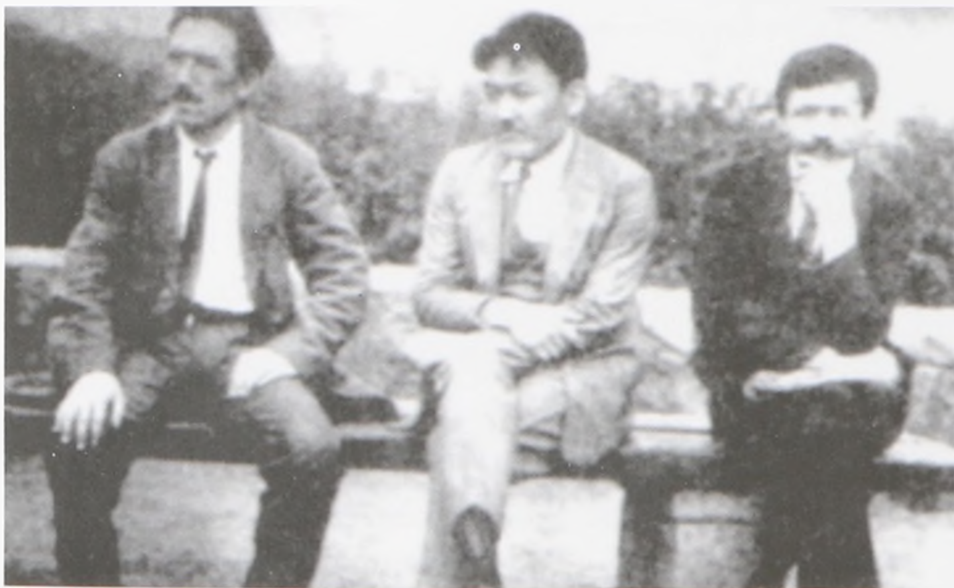
Мұстафа Шоқайдың пікірлес достары: Зәки Уәлиди Тоған, Әзімбек Бірімжанов және Абдулкадир Інан. Берлин. 1924 жыл.