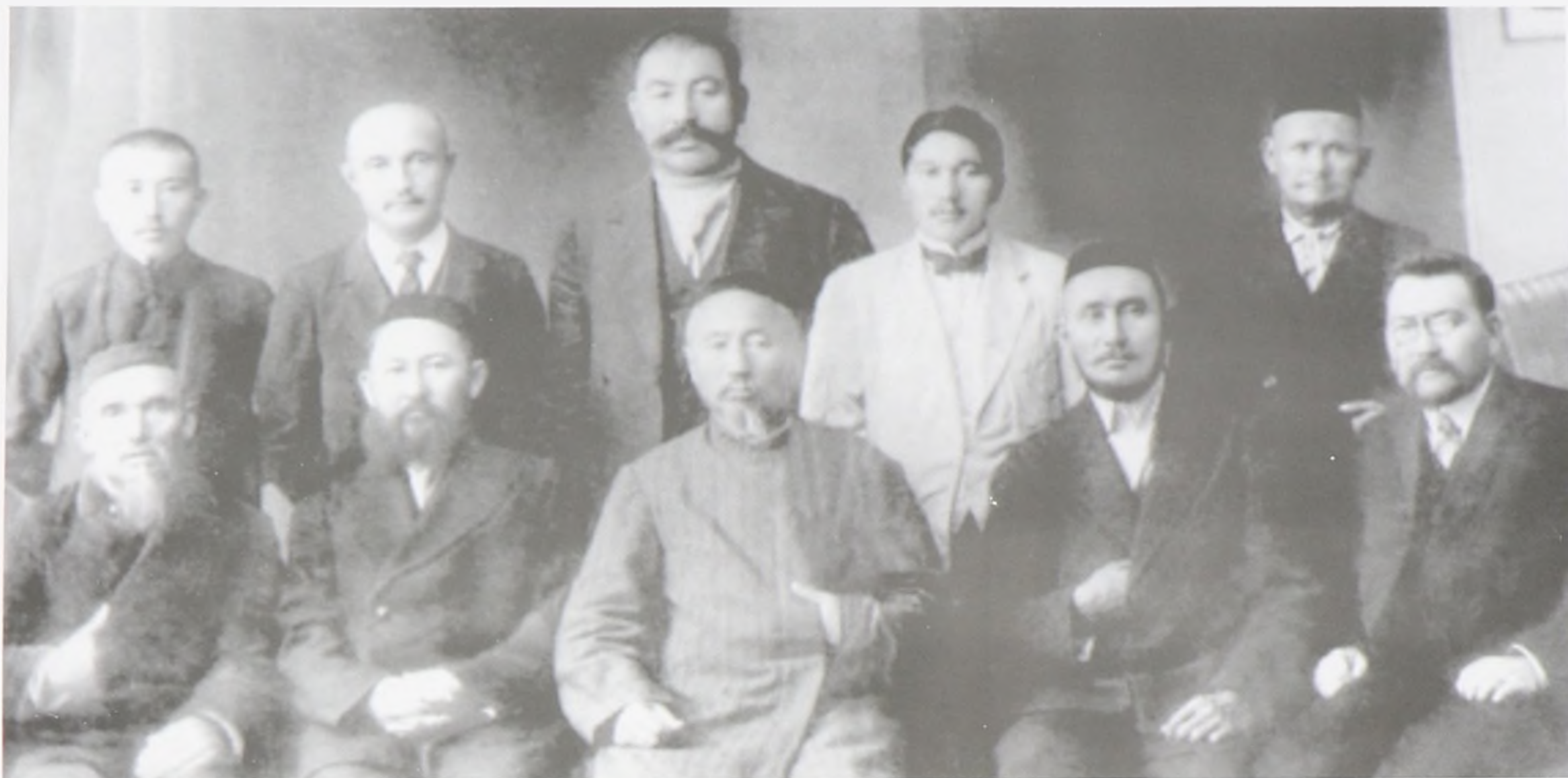
Ахмет Байтұрсынұлы мен Міржакып Дулатұлының 1918 жылдың көктемінде Шәуешекке аттанарда достарымен бірге түскен суреті. Отырғандар: (солдан оңға қарай) Ахмет Байтұрсынұлы, Мұқан (Мұхамеджан) Жәкежанұлы, Көкбай Жанатайұлы, Тұрағұл Абайұлы, Жакабай Әтікұлы. Түрегеліп тұрғандар: (оңнан солға қарай) Жұбандық Балғынбайұлы, Міржакып Дулатұлы, Қажымұқан Мұңайтпасұлы, Сейдәзім Қадырбайұлы, Елдес Омарұлы. Семей. 1918 жыл.