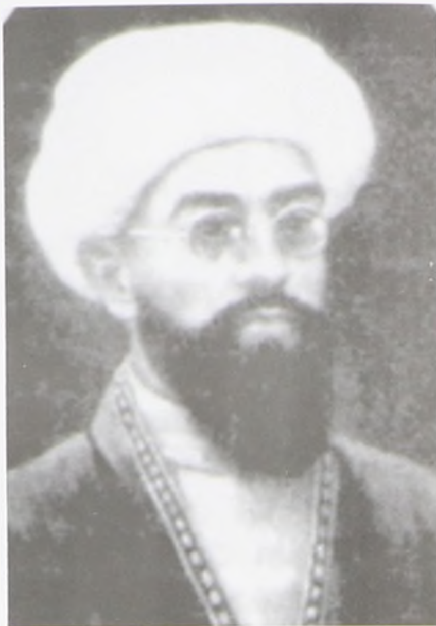
Түркістан ұлт-азаттық қозғалысы жетекшілерінің бірі Махмұд хожа Бехбуди (1875-1919 ж.ж.)