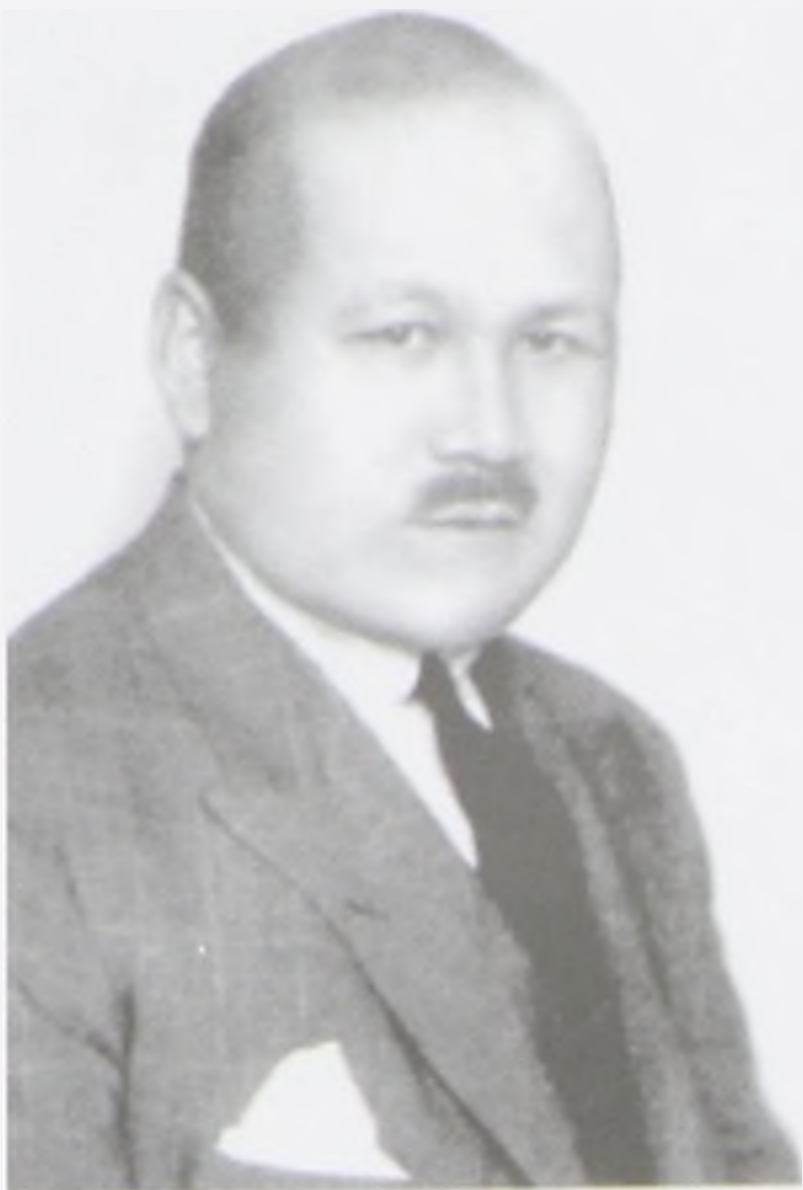
Мұстафа Шоқай Парижде