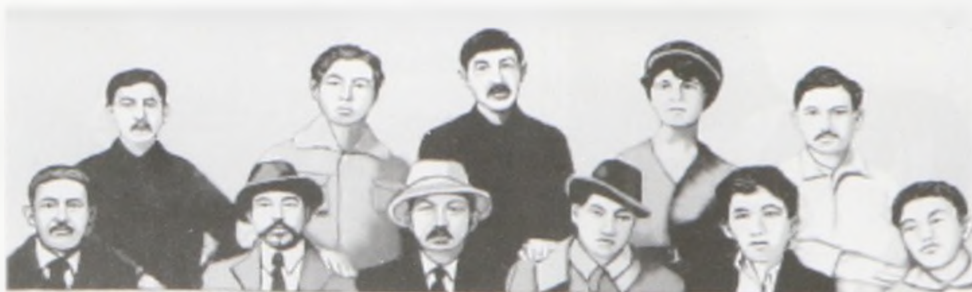
Күн басына біздің ордамыз. Ортада: Алаш бастықтары. Солдан оңға қарай: 11. Міржакып Дулатов (1), Халел Досмұхамедұлы (2), Жаһанша Досмұхамедұлы (3), Мырзағашы Есполов (4), Мырзағашы Есполов (5), Мырзағашы Есполов (6), Мырзағашы Есполов (7), Мырзағашы Есполов (8), Мырзағашы Есполов (9), Мырзағашы Есполов (10), Мырзағашы Есполов (11).