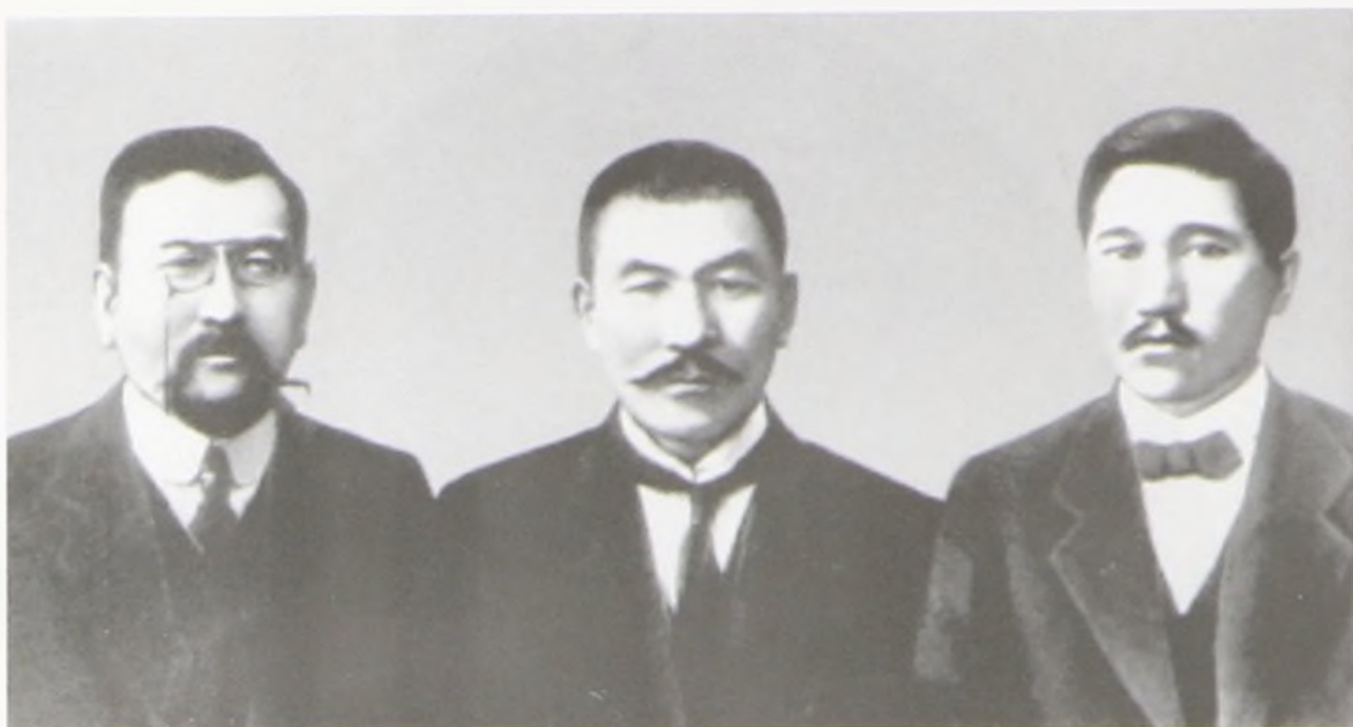
Ахмет Байтұрсынұлы, Әлихан Бөкейханов, Міржакып Дулатұлы. Орынбор. 1913 жыл.