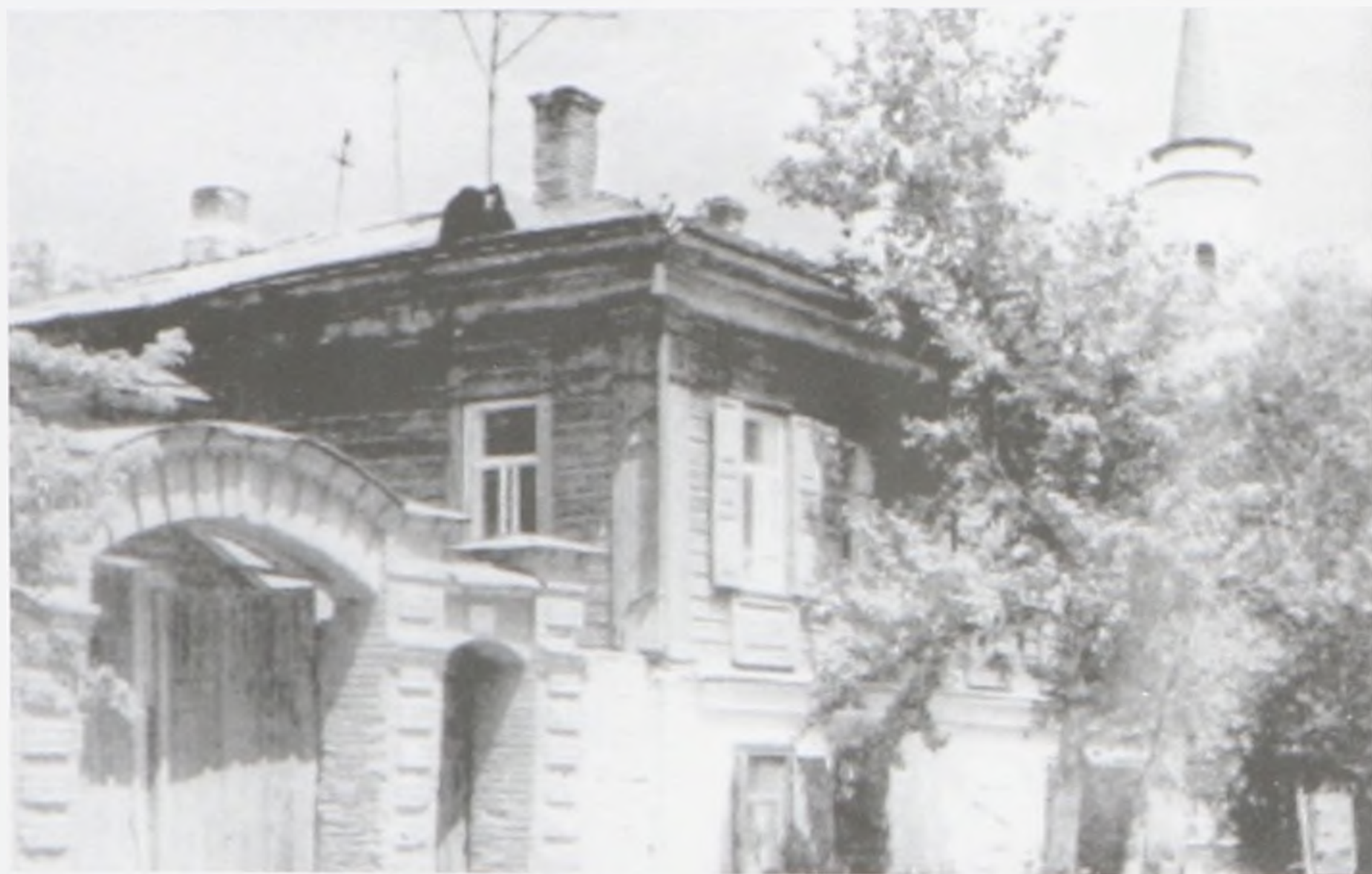
Әлихан Бөкейханов пен Міржакып Дулатұлы отбасымен тұрған Семейдегі Комиссар көшесіндегі үйдің сыртқы көрінісі. Семей. 1921-1922 жылдар.