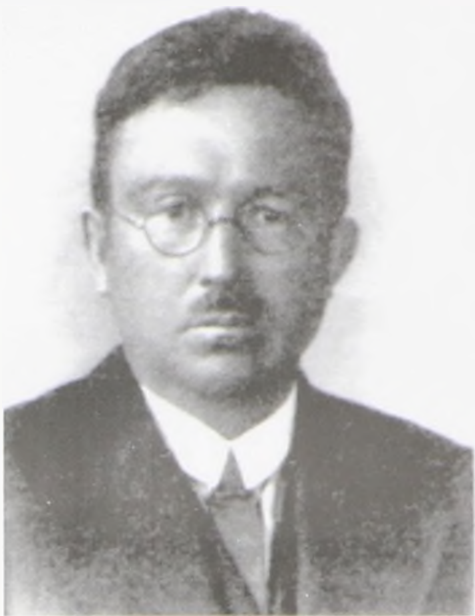
Зәки Уәлиди Тоған (1890-1970 ж.ж.)