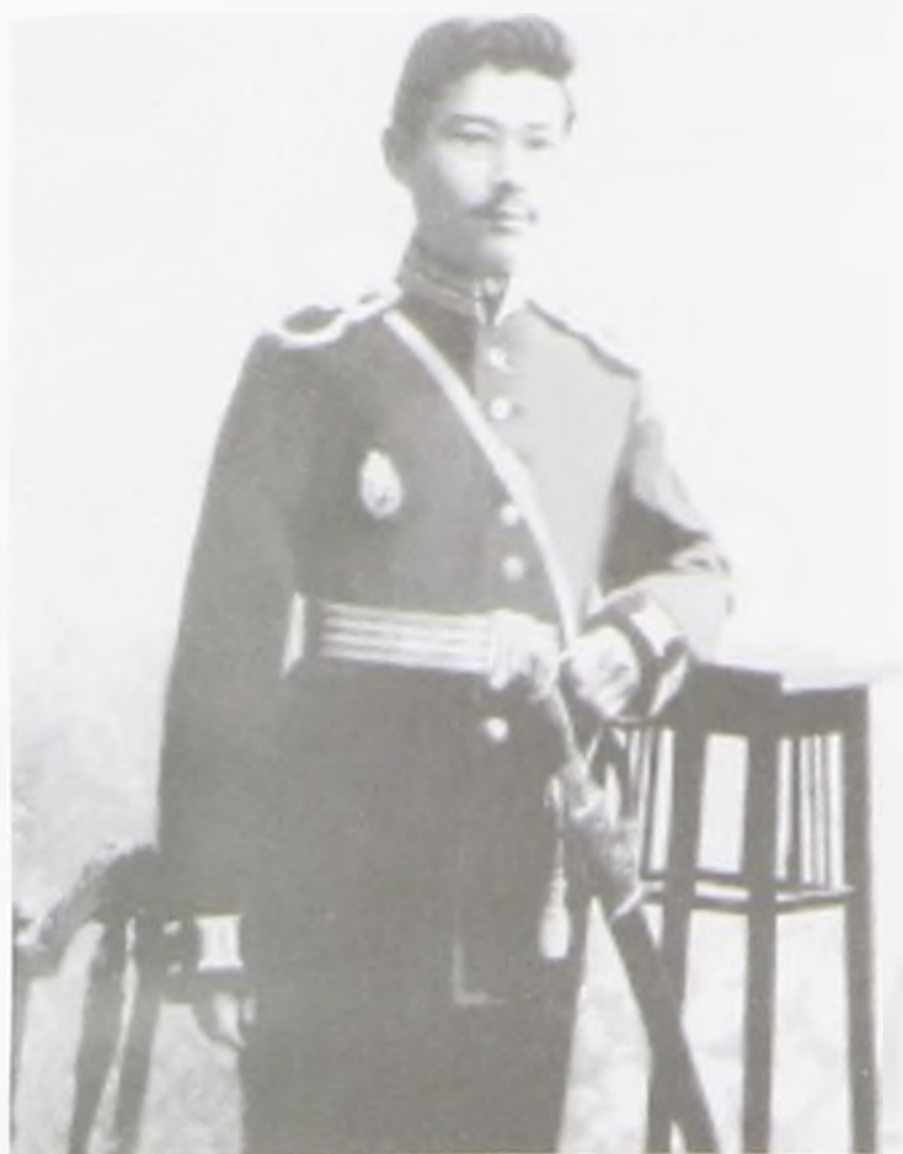
Императорлық әскери-медицина академиясын бітірген кезі. С-Петербург. 9 қазан 1909 жыл.