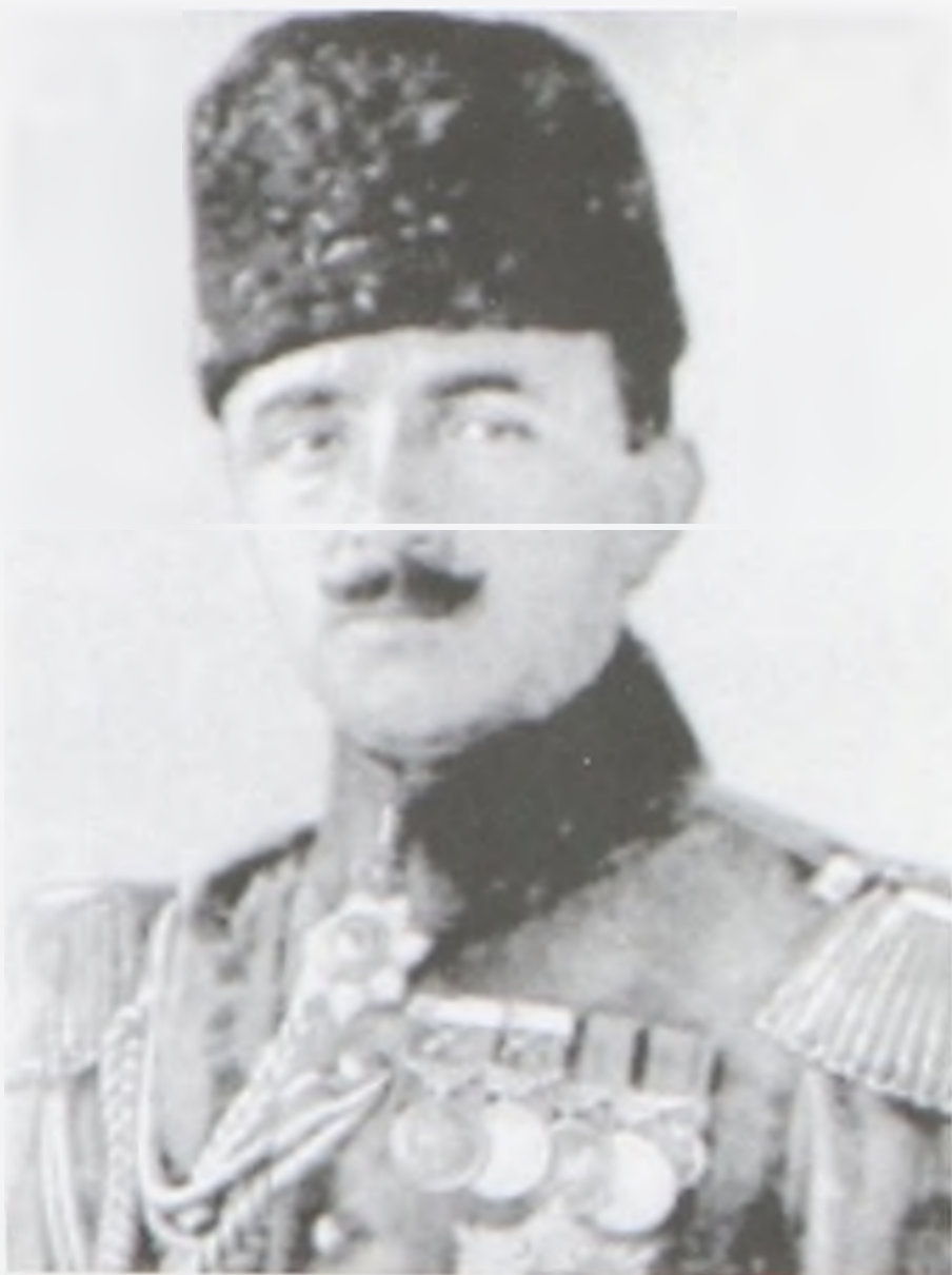
Әйгілі Әнуар паша