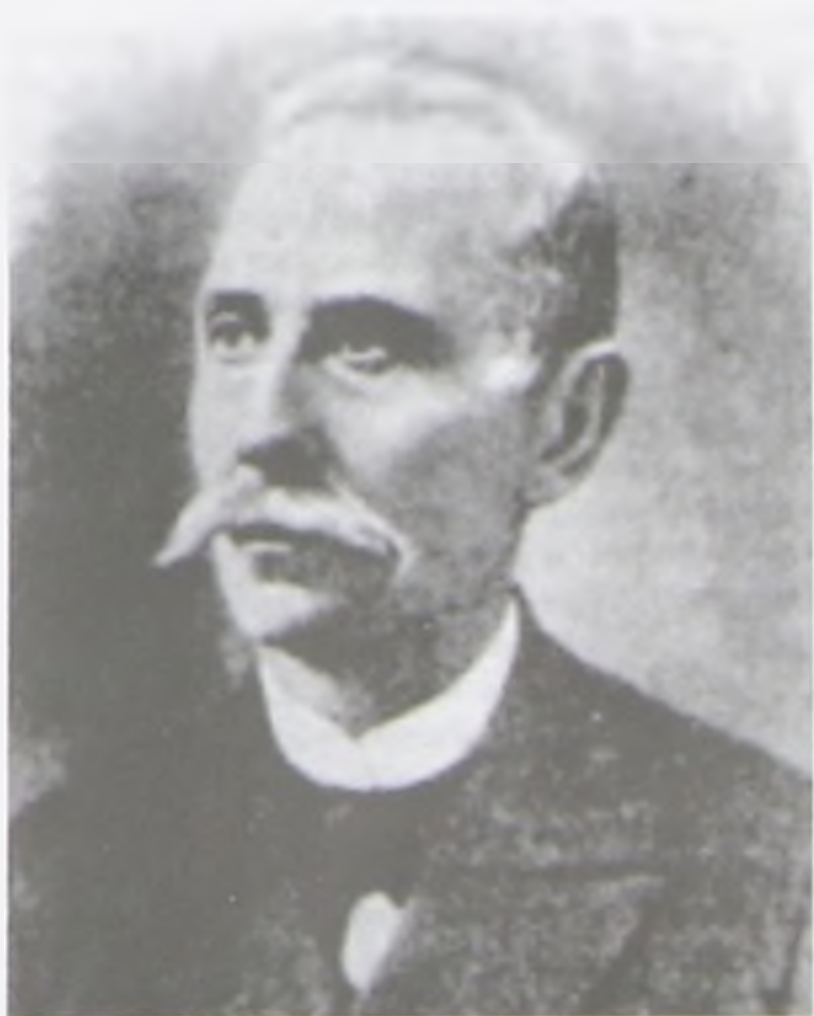
Жәдитшілдік қозғалысының жолбасшысы мұсылман-түрік халықтарының рухани жетекшісі Исмайл Гаспринский (1851-1914 ж.ж.)