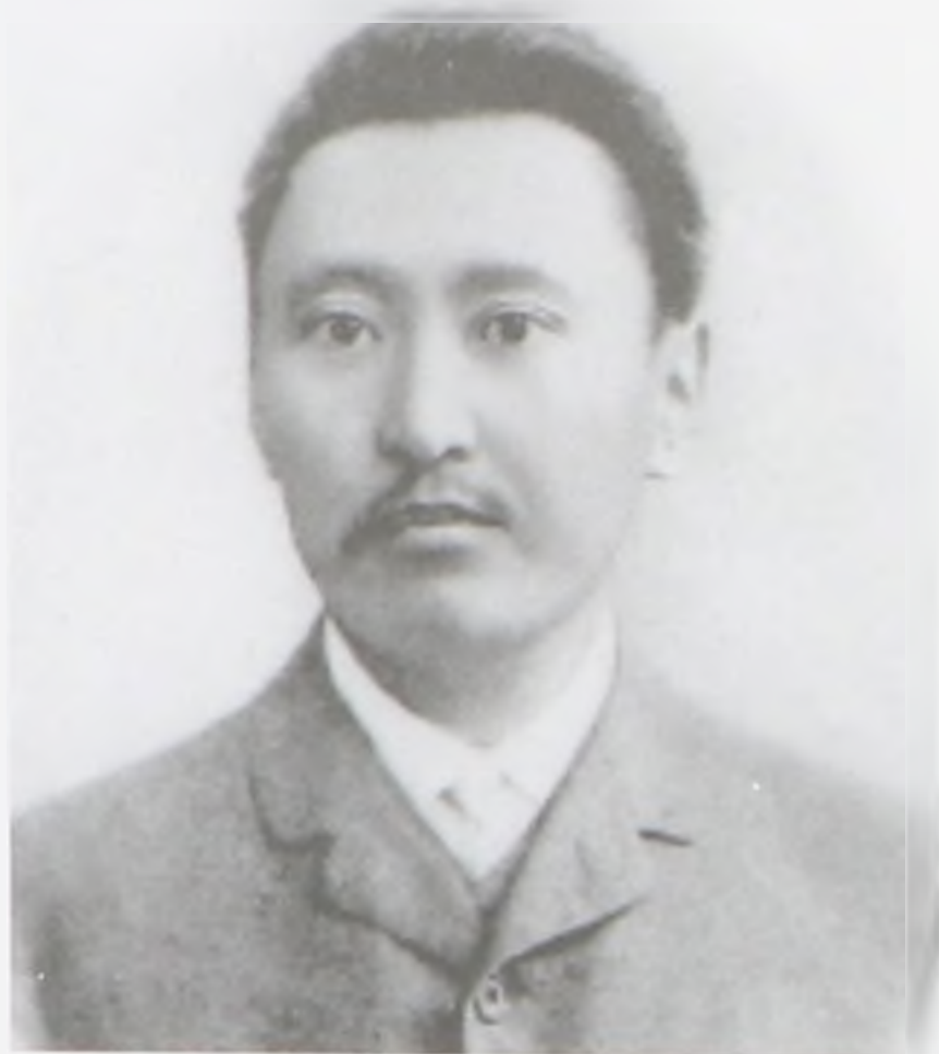
1905-1906 жылдардағы Ресей мемлекеттік I, II Думасының депутаты, Шақшақ Жәнібек батырдың ұрпағы, Алаш орда жетекшілерінің бірі Ахмет Қорғанбекұлы Бірімжанов.