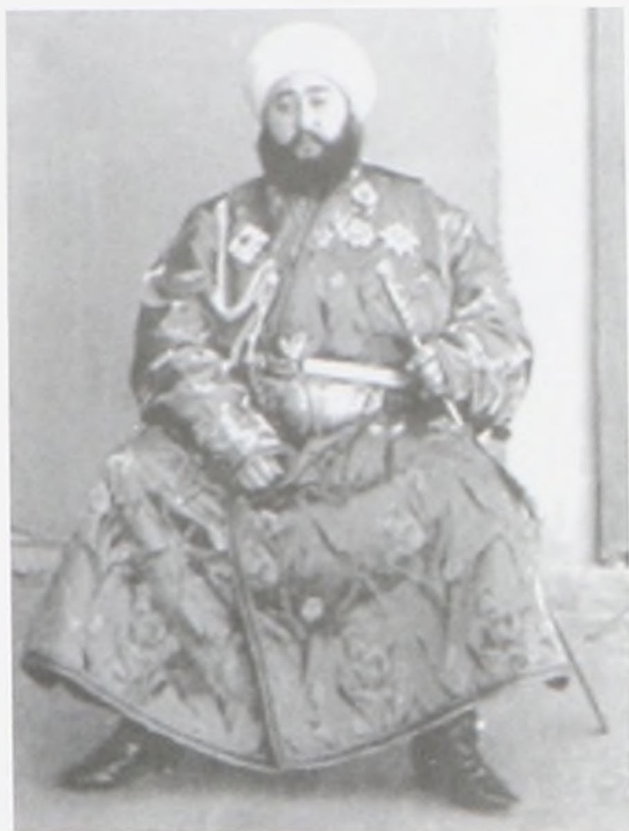
Бұхара әмірі Әлім хан