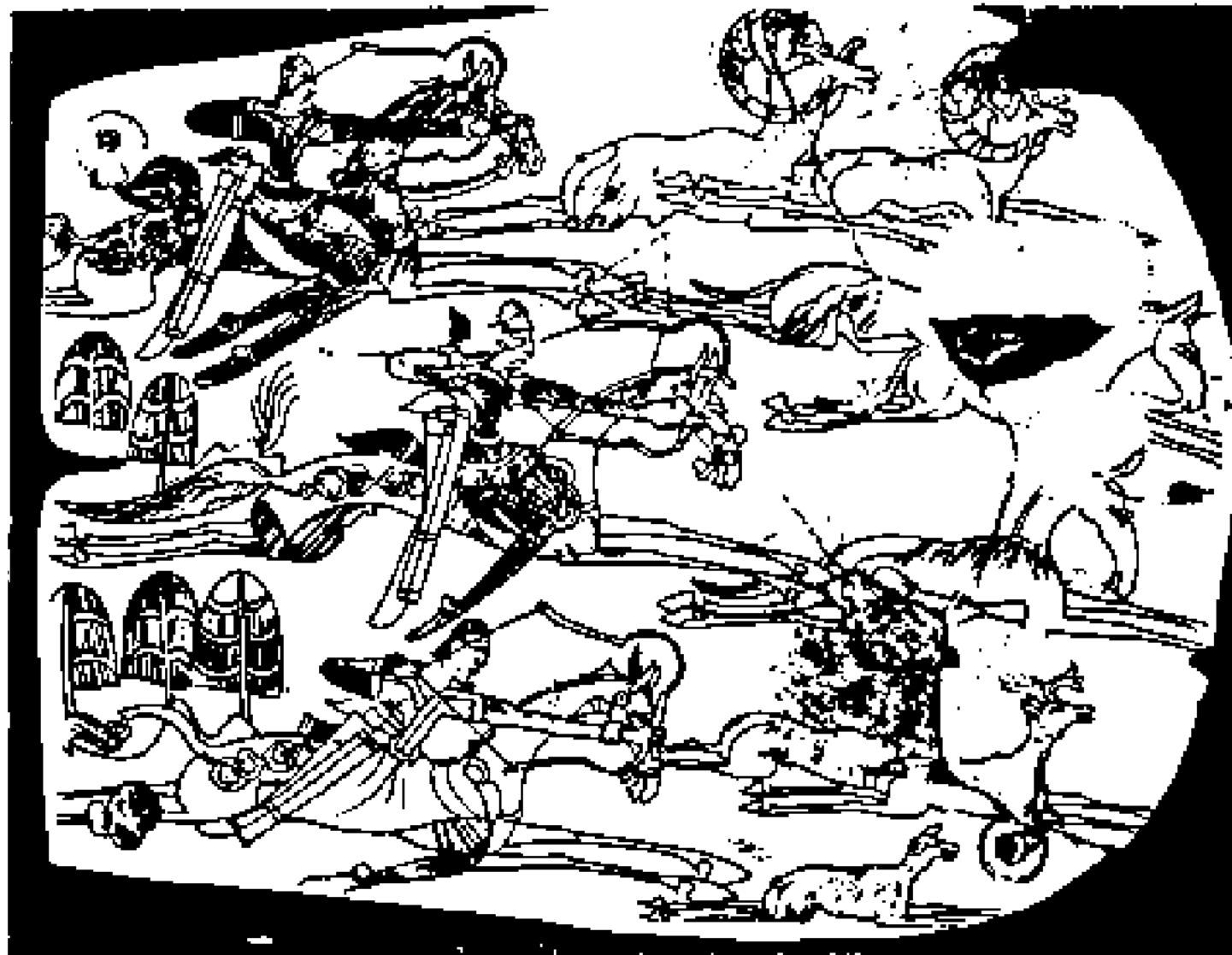
Қаңлы садақшыларының аңға шығуы: бірінші ғасырларда сүйек тақта бетіне салынған сурет. (Қорғантөбе)

Сырдарияның орта ағысы мен төменгі ағысында этносаяси ахуал бірінші мыңжылдықтың ортасында түркітілдес тайпалардың келуінің әсерінен күрт өзгеріске ұшырады. Ерте ортағасырда Кангу Тарбан феодалдық құрылымы қалыптаса бастады.