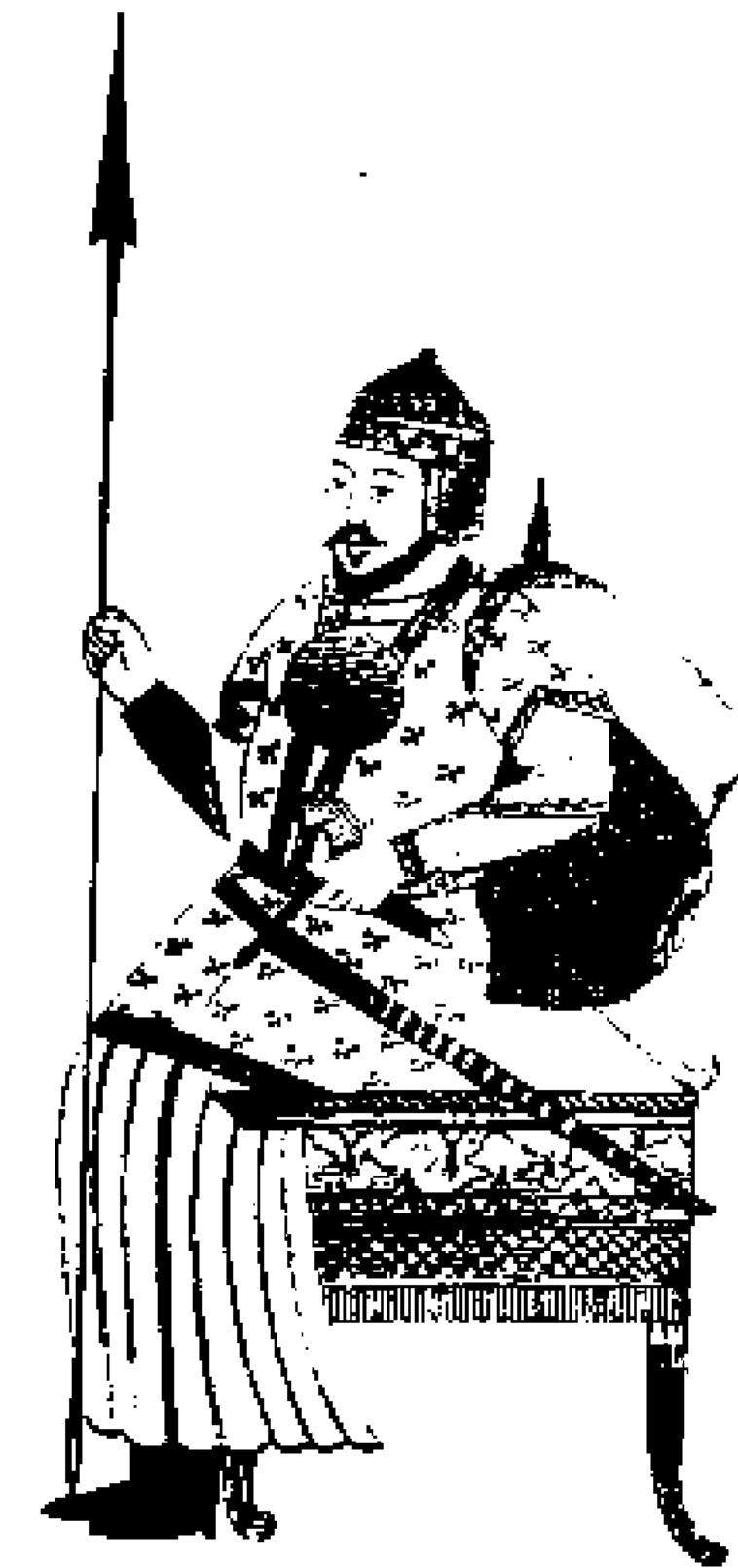
Тақта отырған Әмір Темір

басып алды. Бірақ билік үшін талас серттескен жақын достардың арасын суытып, бір-біріне жауластырып тынды. Темірдің жолы болды: 1370 жылы ол Хусейн бас сауғалаған Балқыны қоршады. Қатты қарсылық көрсеткен қала басып алынды, ал тұтқынға түскен Хусейн Темірдің үнсіз келісімімен өлтірілді. Енді онда күшті қарсылас болған жоқ және әскербасыларының құрылтайында оны мемлекет басшысы етіп жариялады.