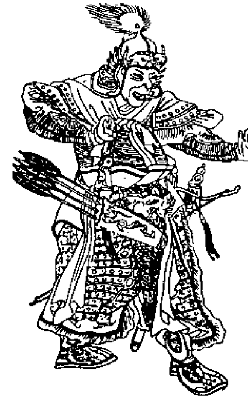
Моңғол қолбасшысы Сүбедей баһадүр. Қытай суреті

нуға жарайтын кең даланың жұрты оған бағынды. Ол жердегі тұрғындар оның ұлдары мен туысқандарына бөліп берілді. Ең ірі әкімшілік бірлігінің түмен 1 жауынгері болды. Әскербасының шақыруына әрбір арат 2 қару-жарағымен, атымен белгілі жерге жиналатын. Әскер құрамы ондық, жүздік және мындық болып, түменге біріккен. Олардың арасында темірдей тәртіп орнатылған, бір адам айыпты болса, оның айыбына ондықта оны бірдей, жүздікте жүзі бірдей, мындықта мыңы бірдей жазаланды. Әскер басында көшпенділердің аксүйектері — нойондар, баһадүрлер, мергендер болды. Билеуші өз маңында іріктелген мың жауынгер-ардагерлерден тұратын кешік 3 ұстады.