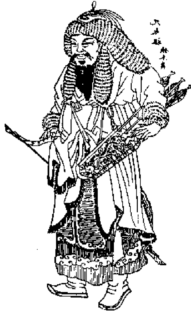
Шыңғысхан. Қытай суреті

стан жерінде, көптеген кең аймақта қалалар гүлденіп өсіп жатты. Бұхар және Тараз, Испиджаб және Самарқан, Үргеніш және Сауран, Мерв және Сығанақ, Шаш пен Талғар, Баласағұн және Қойлықта — экономика мен мәдениет XII — XIII ғ. басында гүлденудің жоғары дәрежесінде тұр еді.