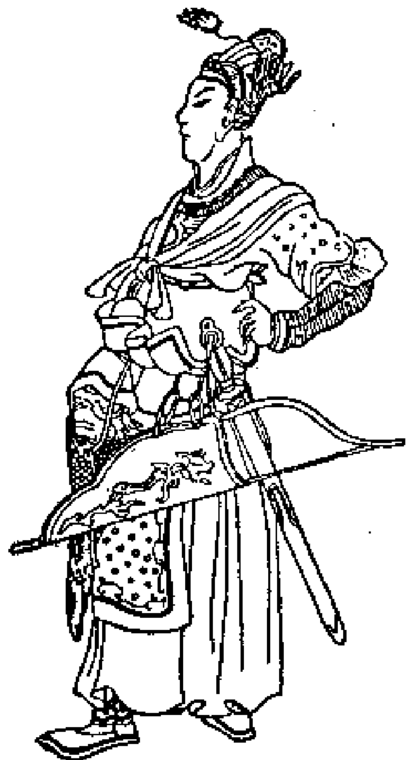
Моңғолдың Бату ханы. Қытай суреті

Әскер қамал сыртында бірнеше қатар болып орналасқан. Шыңғысхан әрбір әскери қолбасшыларды белгілі бір бағытқа жіберді. Ол үлкен ұлы Жошыны бірнеше түмен батырларымен Жент және Баршынкентке, бірнеше қолбасшыларын Ходжент және Бенакентке жіберді. Өзі Бұхарға бет бұрды. Үгедей мен Шағатайға Отырарды қоршауды тапсырды. Атты әскер басқа бағытта аттанғандықтан, Отырар бес ай бойы қорғанысқа шыдады.