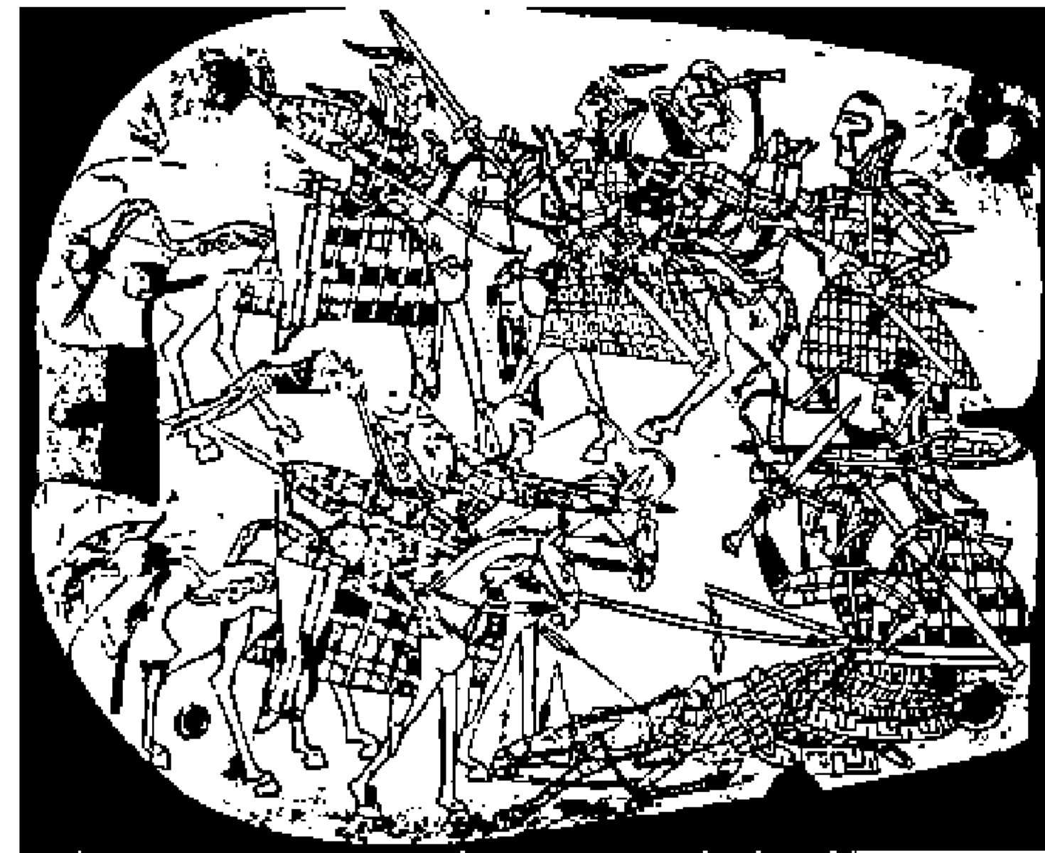
Қанлы жауынгерлерінің шайқасы: бірінші ғасырларда сүйек такта бетіне салынған сурет. (Қорғантөбе)

өзгерді дейді. Кеңес дәуірі зерттеушілерінің бірі Б.А.Литвинский оларды иран тілдес сақтарға жатқызды. Оның пікірі бойынша, қанлы – сақ тайпаларының бірі, атауы «тері киген адамдар» дегенді білдіреді дейді. Кейінгі жылдардағы археологиялық заттар қанлылардың сырт келбеті жайлы бірталай мәліметтер берді. Зерттеушілердің қолында тері киімдері, сүйек такташаларына салынған суреттер бар. Самарқан маңындағы Қорғантөбе қаласының жанында табылған көшпенділер моласының қазба жұмысында табылған сүйек такташасында салынған сурет адамдардың дене құрылысымен қатар, киімдері мен соғыс қару-жарақтарын көрсетеді.