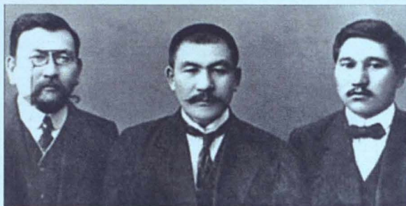
Ахмет Байтұрсынов, Әлихан Бөкейханов, Міржақып Дулатов. Орынбор. XX ғ. 10-шы жэс. ортасы