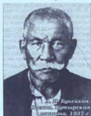
Әлихан Бөкейхан. Мәскеу, НКВД түр- месі, 1937