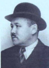
Мұстафа Шоқай эмиграцияда