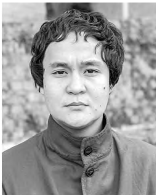
Режиссер Эмир Байгазин

да распался Советский Союз, ему было всего пять лет, поэтому, конечно, он не помнит и не знает, что такое советская цензура. Но на его долю и долю его поколения выпали трудности становления молодого суверенного государства. А с чего начинается Родина? Со школы. Так вот, в фильме «Уроки гармонии» показана школа со всеми ее атрибутами, где старшие школьники бьют младших и заставляют отдавать им деньги – мелочь, которую родители дают на школьные завтраки или на дорогу. Это страшное явление, и изначально оно существовало только в армии, почему и называлось дедовщиной. Название фильма «Уроки гармонии» носит ироничный характер, школа вся беленькая, чистенькая, учителя хорошие, дети тоже хорошо одеты,