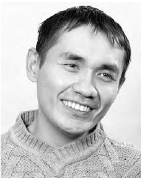
Режиссер Адильхан Ержанов

Картина же снята очень сдержанно, эстетски, в черно-белом изображении, и передает эмоцию страха (перед охраной, милицией, другими строителями), потому что по ночам герои фильма воруют стройматериалы, и желание выжить