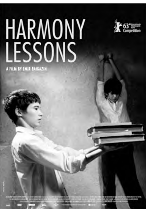
Постер к фильму «Уроки гармонии»

Вторая новелла рассказывает о подростке по имени Балапан, у которого уникальный голос. Он поет «Аве Мария» и отказывается участвовать в мальчишеских потасовках. Возможно, его голос позволит ему вырваться из этого захолустного поселка и стать мировой звездой оперного искусства? Нет, его голос ломается, и он становится как все: драчуном, кулаком отстаивающим свое право сильного. Если в первой новелле Жарас – коренастый мальчик, который просто рано становится «мужичком», то Балапан – утонченный, необычно красивый мальчик с зелеными глазами, который не приемлет ни драки, ни насилия. Его мир – мир прекрасных звуков и заоблачных высот. Его призвание – за-