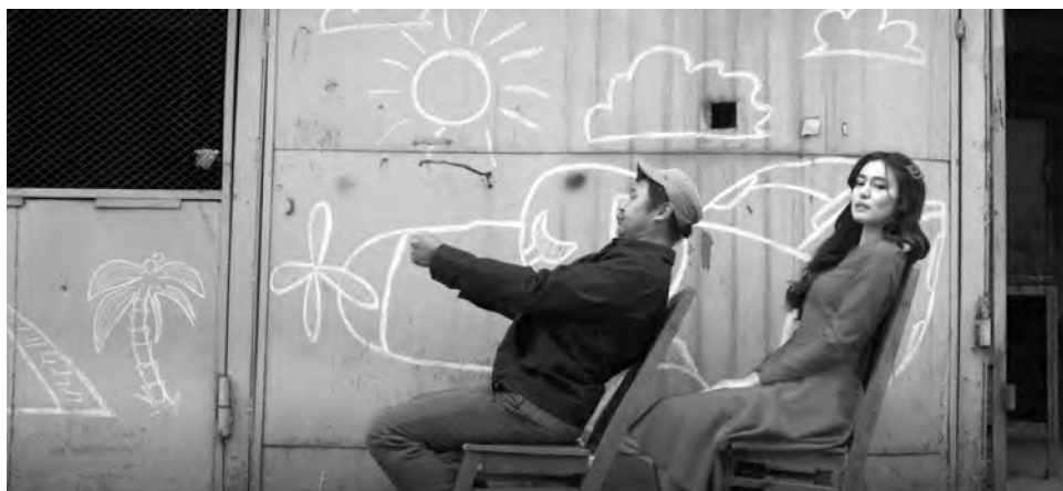
Кадр из фильма «Ласковое безразличие мира»

мира» он снял в 2019 году фильмы «Черный, черный человек» и «Бой Атбая», в 2020 – «Желтую кошку» и «Улболсын», в 2021 завершил работу над лентой «Обучение Адемоки».