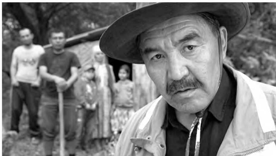
Кадр из фильма «Хозяева»

Вопрос наличия дома – это не только вопрос конкретной семьи, это метафора того, имеет ли нынешнее поколение ощущение дома в своей стране, заботится ли о молодежи государство. На самом деле, у нас высокий процент безработицы среди молодежи и, соответственно, молодым очень сложно купить не то что дом, но и небольшую квартиру, чтобы начать самостоятельную жизнь.