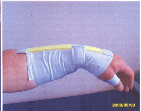
б) внешний вид