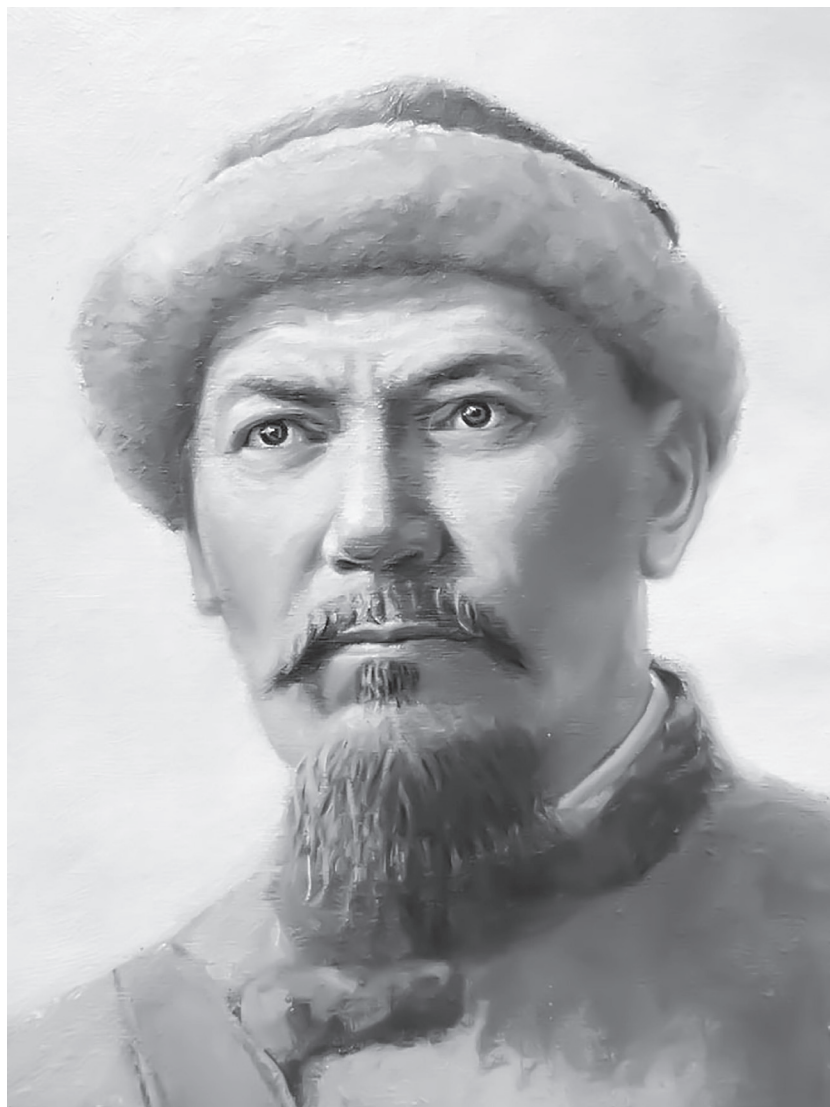
Амангелді Иманов (1873 – 1919)

(Суретші Ә.Қастеевтің картинасынан фрагмент)