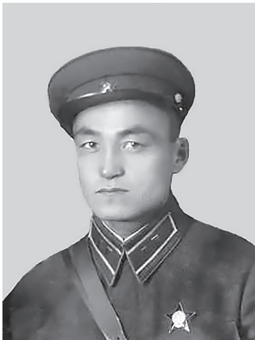
Иманов Шәрип (1914 – 2000)