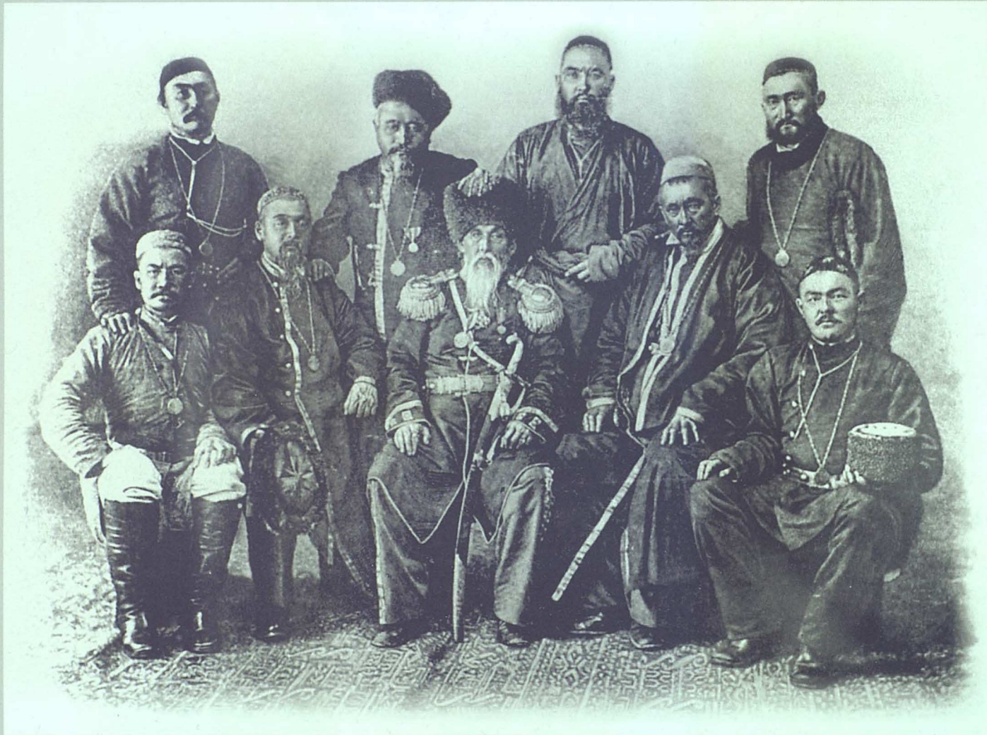
Батыс-сібір сұлтандары. (1890 ж.)