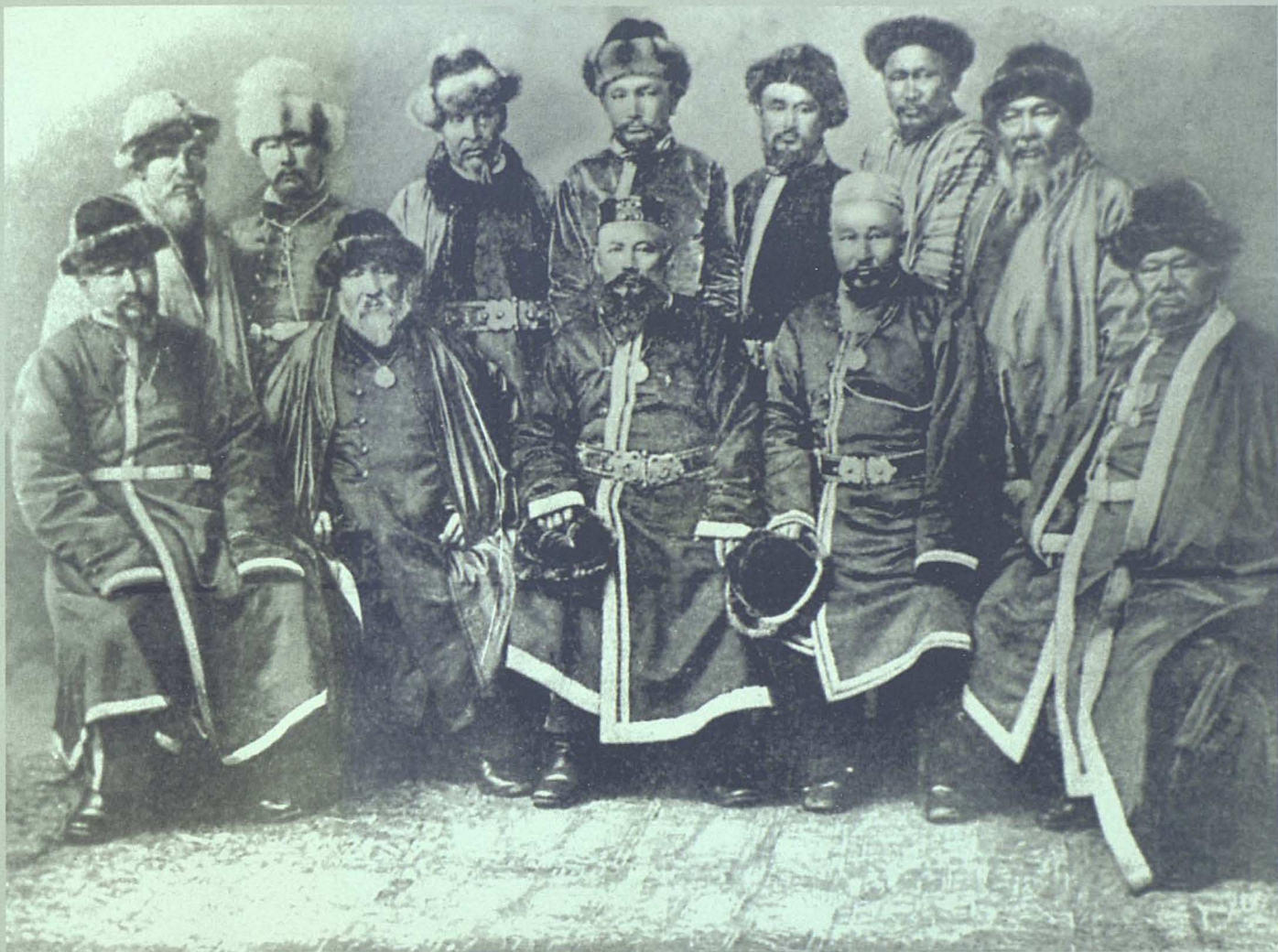
Тұран ақсүйектері. (XIX ғасырдың соңы)