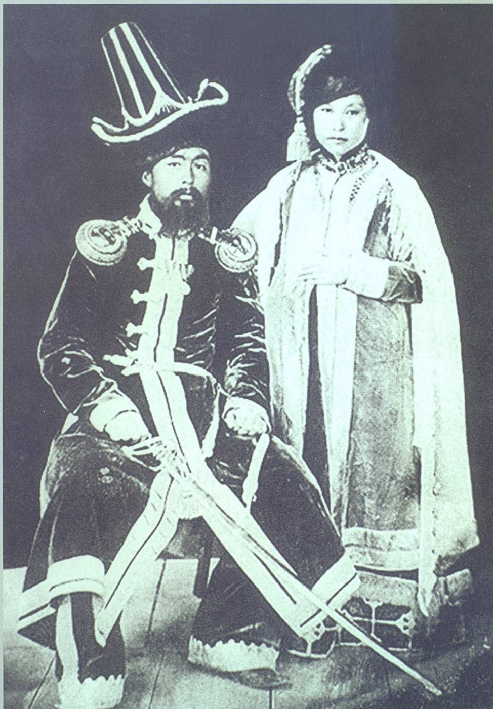
Бөкей Ордасының сұлтаны әйелімен. (XIX ғасырдың соңы)