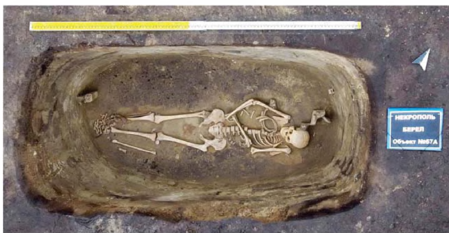
Рисунок 6. Объект № 67А. Погребение человека

нию антропологов погребен мужчина 25-35 лет, «по антропологическому типу монголоидный. Аналогий в синхронное время на территории Восточного Казахстана практически нет, вероятно, своим происхождением связан с территорией Южной Сибири и Монголии» (Китов, Китова, 2018: 2, 3).