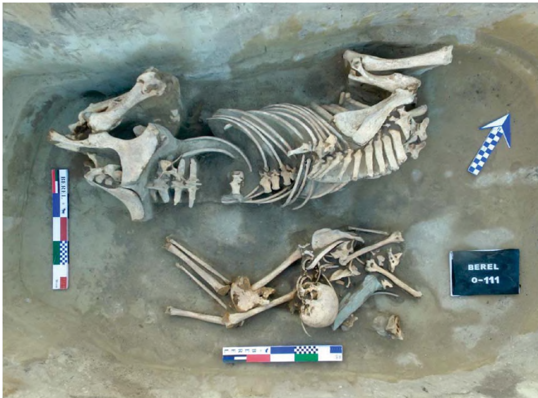
Рисунок 17. Объект № 111. Потревоженное погребение человека и захоронение лошади без черепа

Из инвентаря в перемешанных костях человека найден изделие из кости с элементами из металлической проволоки – подвеска или серьга, а также поделка из рога с отверстиями напоминающее найденное в объекте № 81 изделие, косметического или аксессуарного назначения (Самашев, 2019: 469-473).