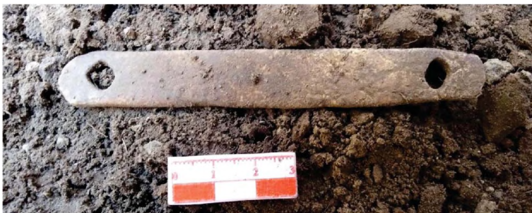
Рисунок 9. Объект № 67В. Роговая пластина