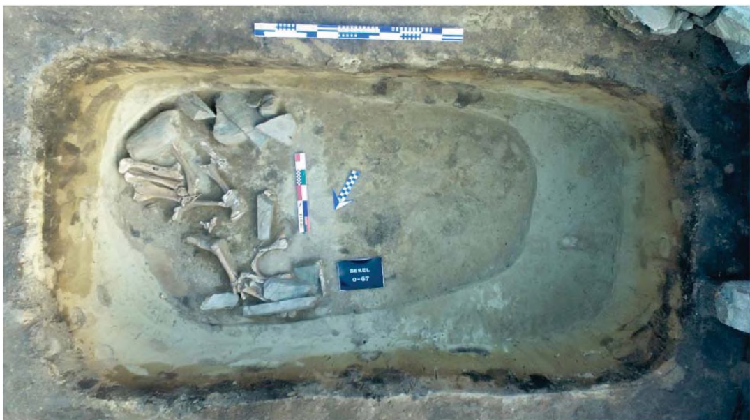
Рисунок 3. Объект № 67. Кости конечностей лошади в погребении