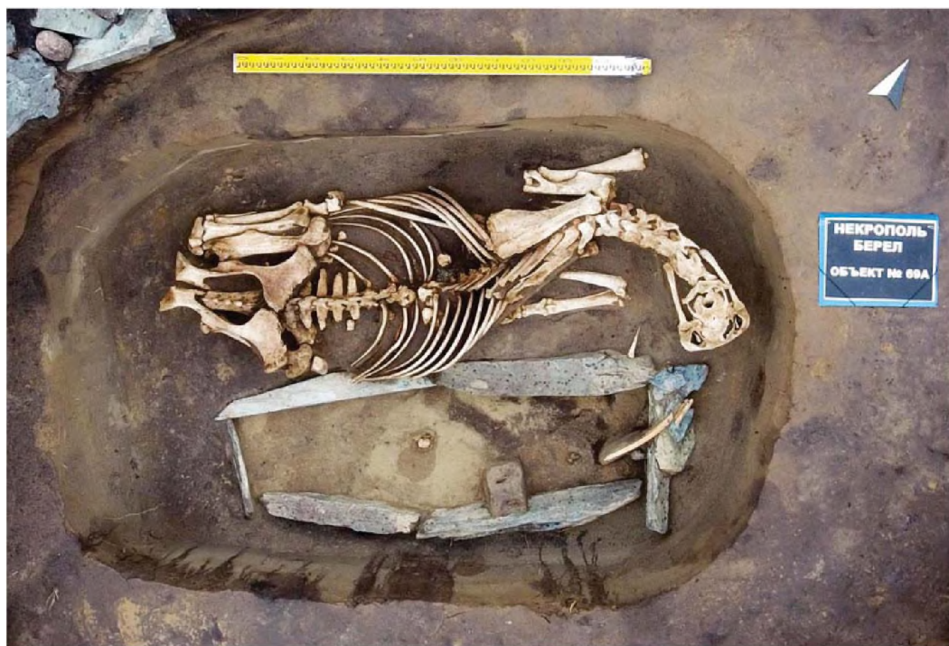
Рисунок 11. Объект № 69А

Кроме отмеченного, других находок в пределах объекта не было (рис. 11) (Самашев, 2017: 89-96).