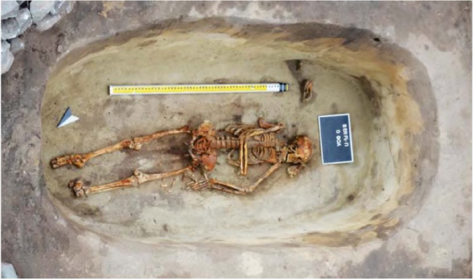
Рисунок 14. Объект № 90А. Погребение человека

могильника Шидерты XVII, курган 1 являющегося носителем культурных традиций коргантасского типа памятников, вероятно, своим происхождением он связан с территорией Прибайкалья» (Китов, Китова, 2018: 9, 10).