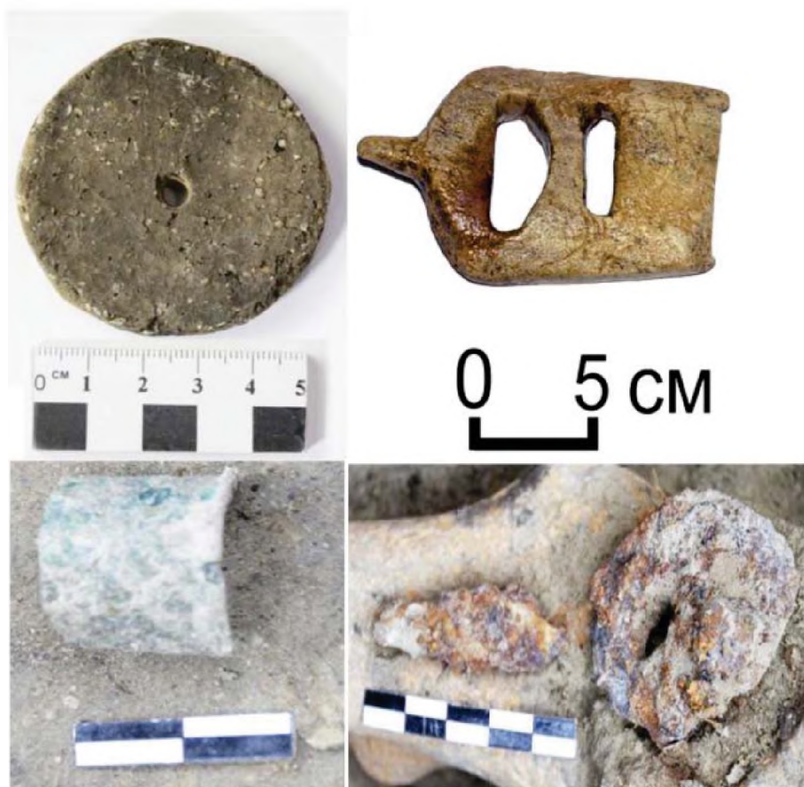
Рисунок 7. Объект № 67А. Инвентарь