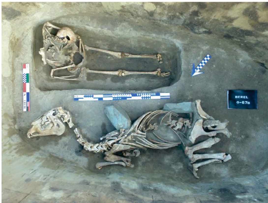
Рисунок 8. Объект № 67В. Погребения человека в сидячей позе и лошади

Объект № 67В. Примыкает с севера к валу оград № 67, 68 и 69, краями соприкасается с наземными конструкциями выкладок № 67А и 67С (рис. 1). В ограде выявлено погребение человека в сидячем положении с вытянутыми ногами, с сопроводительным захоронением коня (рис. 8). Из инвентаря при погребенном человеке в районе таза найдена лишь роговая пластина, которая аналогична подобному изделию из ограды № 67, размеры: 1,6х11 см, диаметры двух отверстий на концах – 0,4-0,5 см, толщина изделия – 0,2-0,3 см (рис. 9) (Самашев, 2019: 479-483).