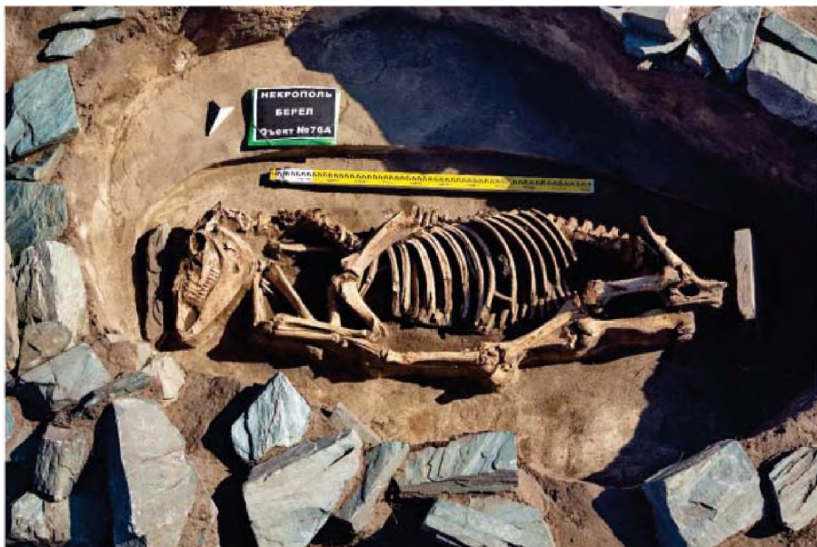
Рисунок 12. Объект № 76А. Захоронение коня

пояса кости не сохранились, левая плечевая кость, левый реберный ряд, левая лопатки и иные кости левой стороны туловища, кроме кости предплечья, также отсутствовали, судя по сохранившимся останкам, костяк был положен на спину, голова находилась в запрокинутом вправо положении. Кости крайне плохой сохранности (рис. 13), предметов инвентаря выявлено не было (Самашев, 2017: 39-44).