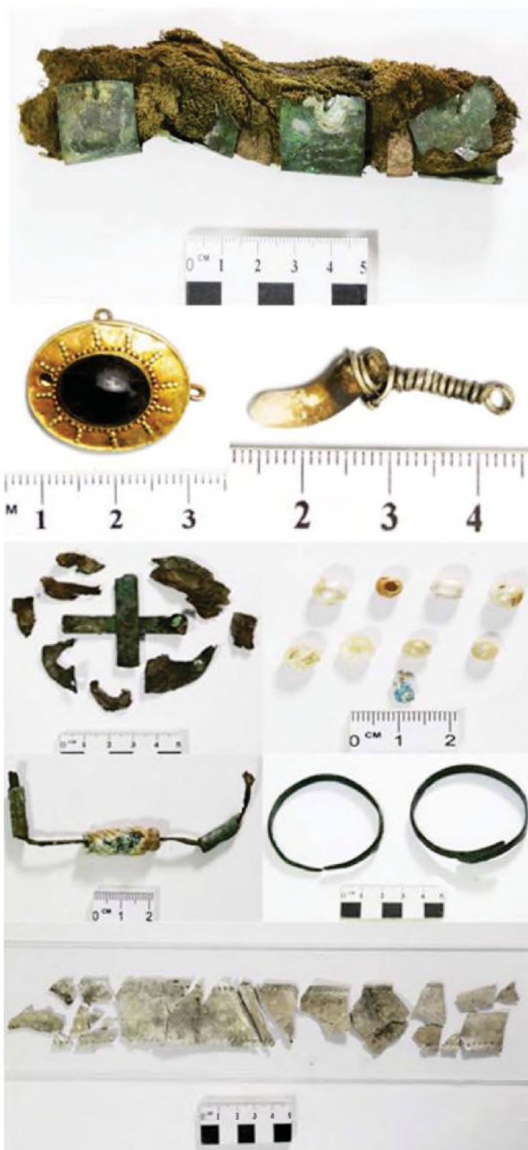
Рисунок 16. Объект № 109. Инвентарь