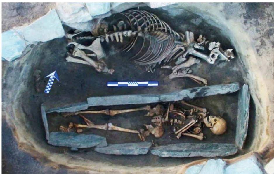
Рисунок 18. Объект № 113. Погребение человека в каменном ящике и захоронение лошади без черепа