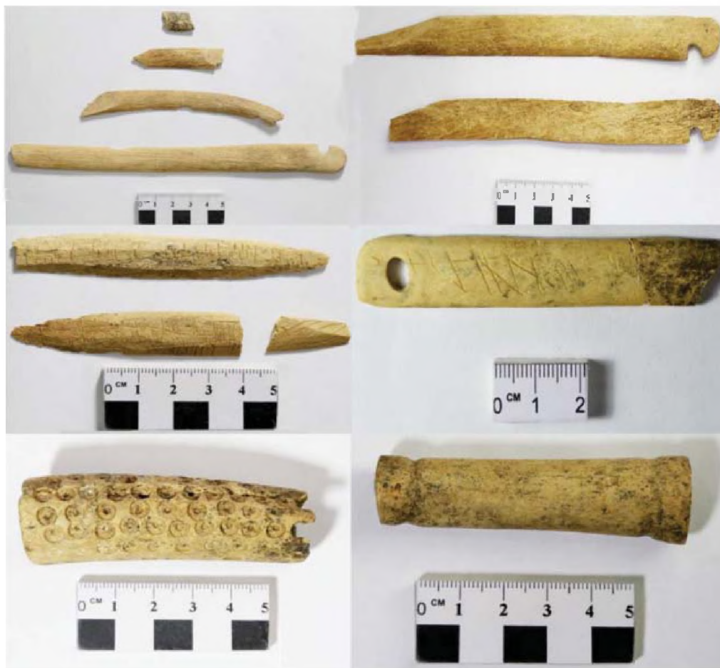
Рисунок 19. Объект № 113. Инвентарь