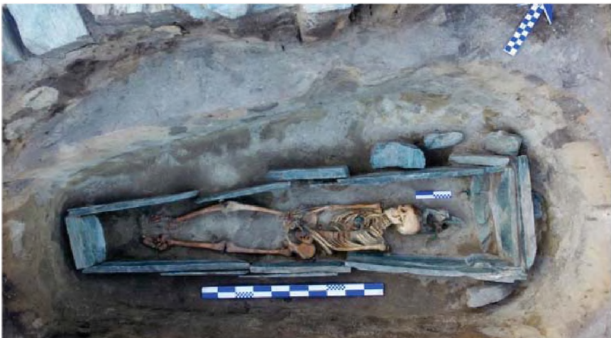
Рисунок 15. Объект № 109. Погребение женщины в каменном ящике

Объект № 109. Исследовано захоронение в каменном ящике с закладом из плит сланца, наземное сооружение представляет собой ограду, выполненную методом кладки камней сланца и галечника в прямоугольной форме с сужением на одном конце, внутреннее заполнение ограды грунтовое с каменной облицовкой в верхней части. Каменный ящик отличается тщательностью исполнения, также имеет сужение на одном конце, человек ориентирован головой на восток-северо-восток (рис. 15). Инвентарь достаточно богат – овальной формы золотой кулон с зернью и со вставкой из темно-синего камня, остатки головного убора в виде элементов органики и патинированных серебряных пластин, нашивные бляшки, бронзовые браслеты на обеих руках, раковина каури, закрученный в серебряную проволоку клык животного, пастовые бусины и изделия из железа (рис. 16) (Самашев 2018: 59-76).