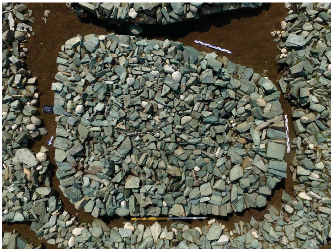
Рисунок 2. Объект № 67. Наземное сооружение