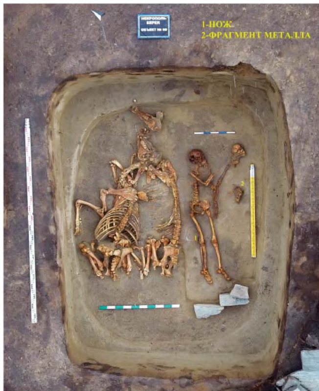
Рисунок 10. Объект № 69. Погребения

Объект № 69. Является крайним с юга объектом в вышеотмеченной группе (рис. 1). Содержал парное захоронение двух лошадей и двух людей. Правая рука крайнего с юга человека находилась под левой рукой второго – вероятно, имело место погребение мужчины и женщины и, возможно, это знак брачного союза. Из инвентаря имелся лишь небольшой железный нож, выявленный у внешней стороны нижней оконечности правой большеберцовой кости крайнего с севера человека и фрагмент металла в районе нижней части груди второго костяка (рис. 10) (Самашев, 2017: 105-112). По определению антропологов это мужской скелет. Второй, возможный женский костяк, практически не сохранился. Останки мужчины по физическому типу соотносим к представителям сакских культур Восточного Казахстана (Китов, Китова, 2018: 6, 7). Кости лошадей также соприкасались.