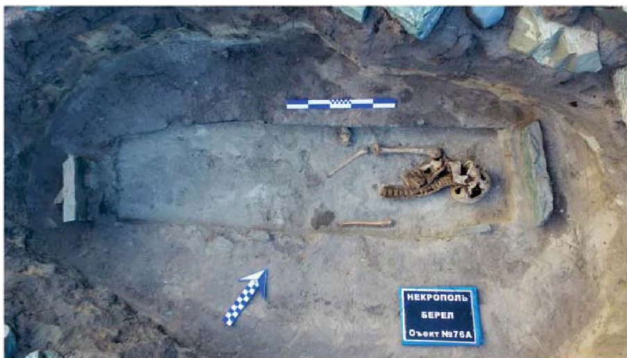
Рисунок 13. Объект № 76А. Останки человека, обнаруженные под скелетом лошади

Объект № 90А. Находится в 12 м к востоку от ограды № 90 (рис. 1). Под наземной выкладкой из камней сланца и галечника выявлено погребение женщины с западной-юго-западной ориентацией в грунтовой яме (рис. 14), из инвентаря имелся небольшой железный нож, серьга и остатки заупокойной пищи в виде нескольких позвонков овцы (Самашев, 2017: 11-20). По определению антропологов женщина в возрасте 35-45 лет, по физическим характеристикам «череп монголоидный». В качестве аналогии можно привести череп из Прииртышья из