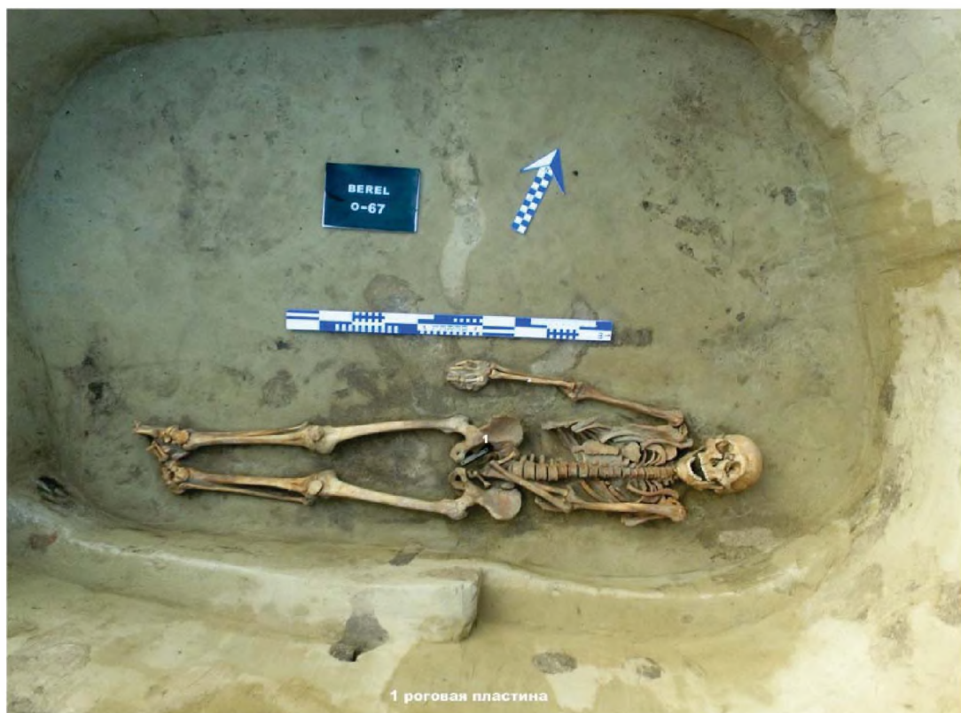
Рисунок 4. Объект № 67. Погребение человека