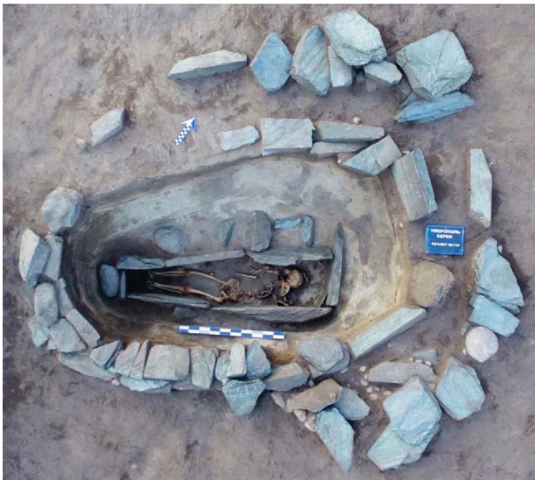
Рисунок 20. Объект № 113. Погребение человека в каменном ящике в пределах сложной, комбинированной наземной конструкции

Объект № 114. Отличается сложной наземной конструкцией, несмотря на значительную деформацию просматривалось несколько уровней – центральная выкладка и порядка двух внешних оград. Сооружение создавала впечатление комбинированной, так как на площади фиксировались участки с разными методами кладки. Под каменной выкладкой зачищена мощная внутренняя забутовка, которая также имела характер разнородного комплекса – концентрированная забутовка и поперечный заклад, как оказалось, каменного ящика, который отличается некоторой массивностью и грубостью форм, при достаточно тщательном исполнении, выраженным в относительно плотном подгоне плит и в их укреплении с внешней стороны подпорками. В каменном ящике располагалось погребение мужчины с северо-восточной ориентировкой, лежал на спине с завалом вправо, верхняя часть туловища значительно потревожена грызунами (рис. 20). Из инвентаря имелись маловыразительные остатки стрел у правой бедренной кости (Самашев, 2018: 105-115).