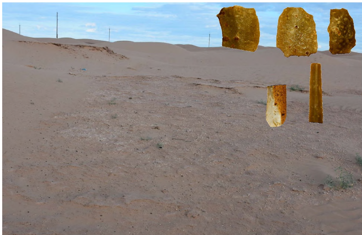
Рисунок 2 – Стоянка Бисен 2