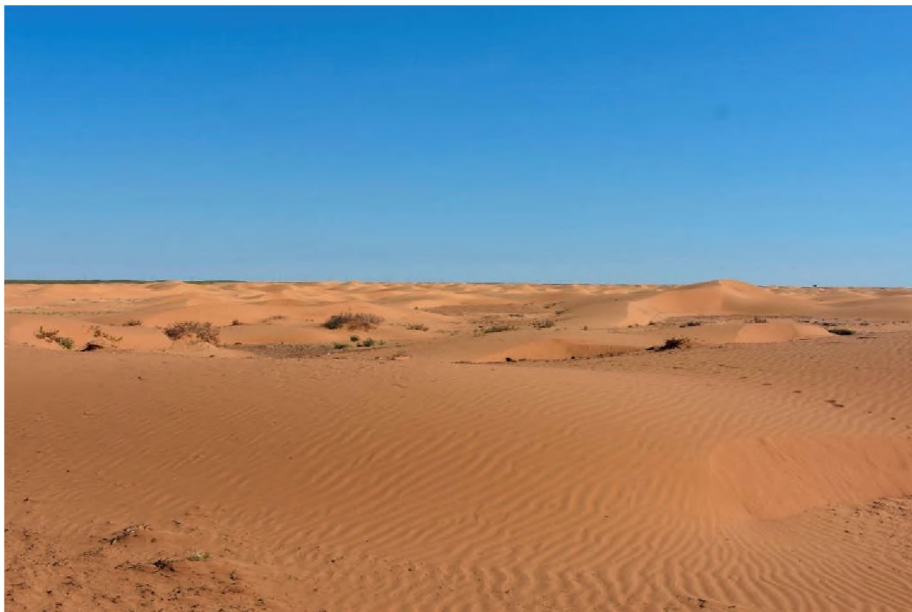
Рисунок 3 – Стоянка Жиеккум