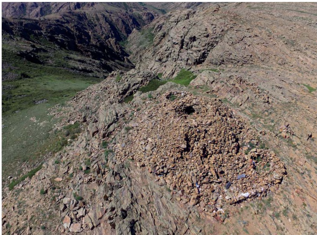
Рис. 1. Ритуальное строение на вершине горы Аулие-Акмечеть.

Из научных публикаций об этом сооружении совсем мало известно. За общим определением «культовое сооружение» скрываются вопросы об историко-культурной при-