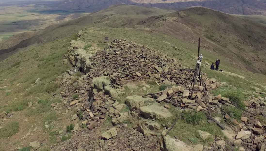
Рис. 5. Ритуальное строение на вершине горы Едыге.

его как национального героя и святого по происхождению, часто приносят на могилу его жертвы. Иногда режут скот, что теперь очень редко, а большей частью привязывают к растущему тут кустарнику лоскутки одежды или конские волосы» [3, с. 224].