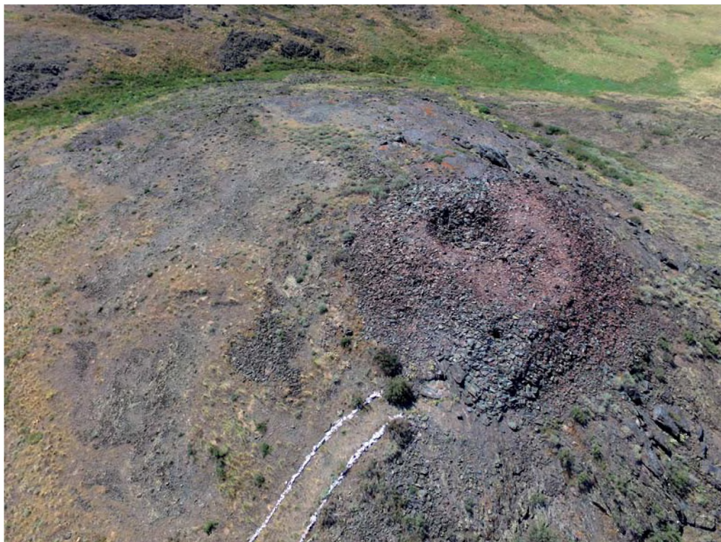
Рис. 6. Ритуальное строение на вершине сопки Алтыншоки.

Если установка камня с надписью о походе, который принес победу Амиру Тимуру над ханом Тохтамышем, становится понятной как свидетельство «знака времени». То курган, построенный как теплотехническое сооружение, вызывает один вопрос: «Зачем Тимур отдает приказ о строительстве кургана своим воинам, изможденным от двухмесячного похода, какая была в этом надобность?» Ответ кроется в обряде поклонения священной Горе, который входит в разряд шаманистических ритуалов, распространенных в общественной жизни монголов. Этот обряд, соотносимый с культом предков, практиковался у Чингисхана и его потомков в виде поминальных жертвоприношений, песнопений в честь умерших предков, проводимых весной [5, с. 9–10]. Культовое сооружение из камней, конической формы, получившее название обо/обоо