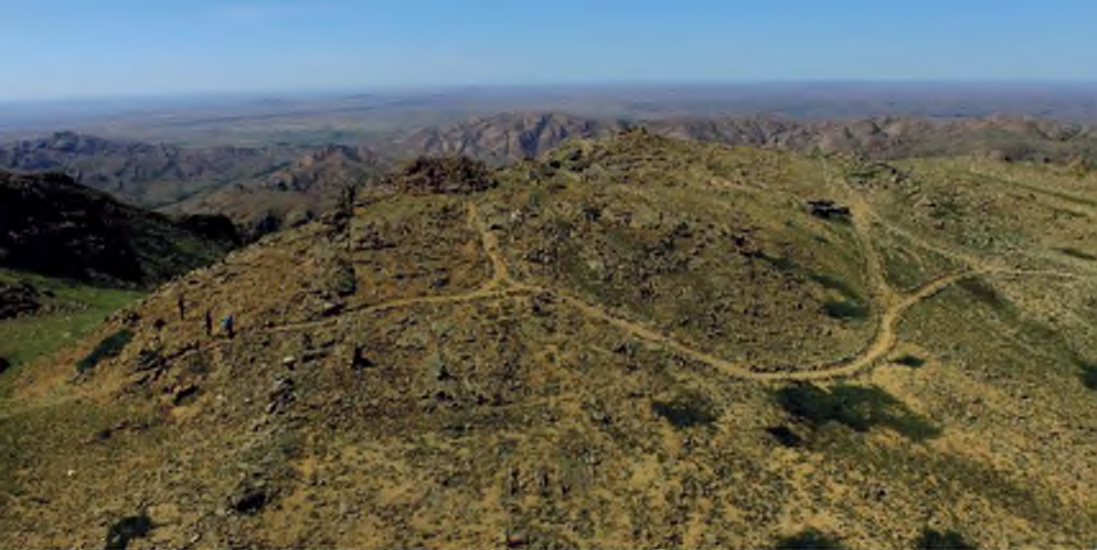
Рис. 4. Вершина горы Аулие-Акмечеть. Общий вид.