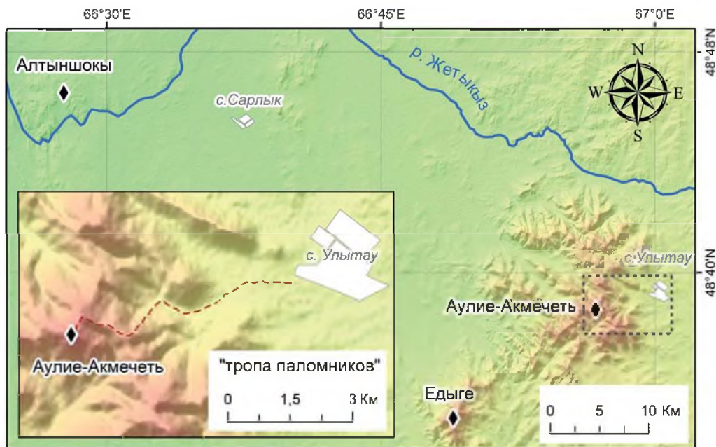
Рис. 2. Карта. Культурные вершины Улытау. Автор: М. А. Антонов

надлежности, времени строительства, мемориального назначения этой курганной постройки. Впервые о комплексе на вершине горы упоминается в статье А. Х. Маргулана «Археологические разведки в бассейне р. Сары-су» [13]. «Еще в 1943 г. нами обнаружена развалина древнего монастыря, находящегося на самой вершине Улытау. Монастырь имеет прямоугольную площадку размером 42×24 м и был сооружен из камня на глиняном растворе. До сих пор хорошо сохранились фундаменты отдельных комнат в виде массивных гранитных глыб высотой до 30–40 см. Каменный монастырь, известный среди местного населения под именем «Ак-мечеть», имеет некоторую аналогию с остатками древнего замка «Тас-ахыр» [Акыртас. — Примеч. авторов] в Джамбульской области. Возле развалин монастыря расположено порядочное количество древних погребений, сложенных из камня в виде курганов. Среди этих памятников выделяется своей формой и размером один сравнительно большой курган, который местное население считает гробницей «святого Акмечет-Аулие», содержателя вышеописанного монастыря» [13, с. 20–21].