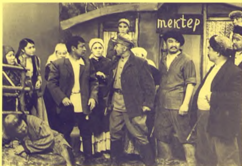
Сол қойылымнан көрініс