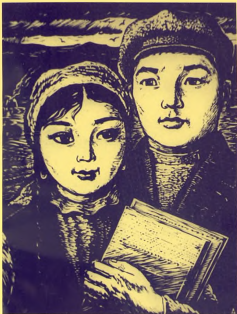
Рәпіш, Рамазан Әбішевтердің суретші А. Шевченко салған бейнелері, 1968 ж.