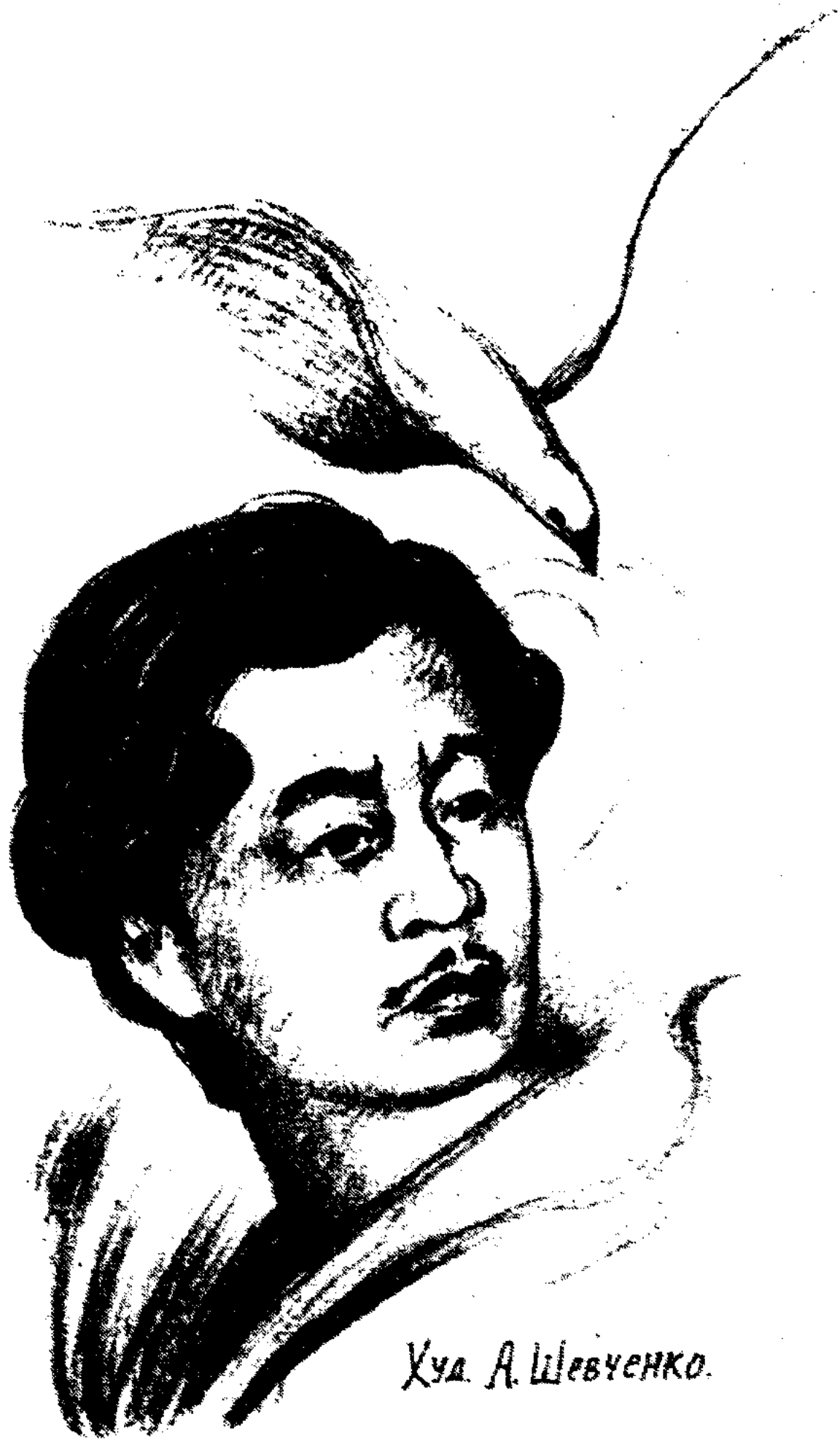
Худ. А. Шевченко.