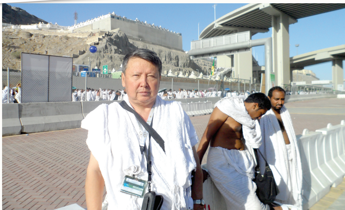
Сауд Аравия Королі Абдалла ибн Абдель Азиз аль-Сауддің жеке қабылдауында болған кезі