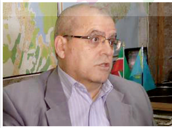
Васви АБДУРАИМОВ, Милли Фирк халық партиясы Кенешінің (Кеңесінің) төрағасы: