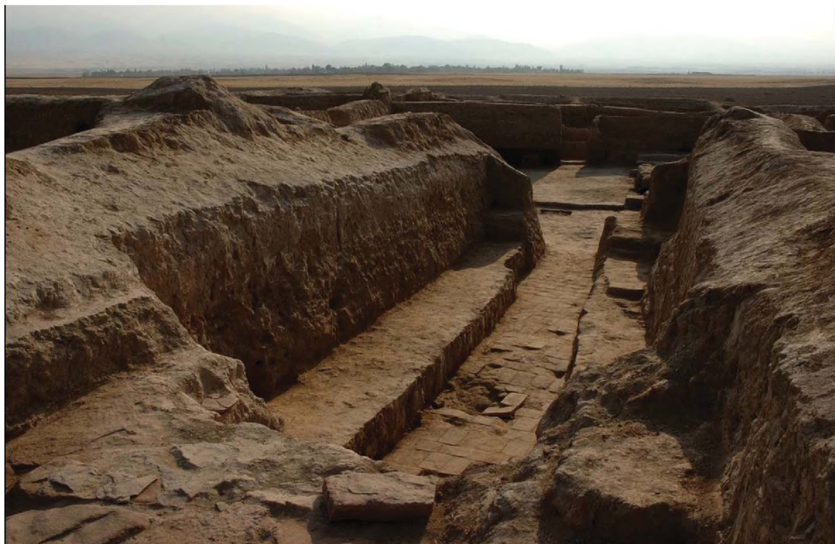
Рис. 3. Две суфы Fig. 3. Two sufas

ченные стебли побега «ислими» с завитками диаметром 9–12 см. Один из концов лепестка «ислими» острый, отогнутый, другой – тупой, обрезанный.