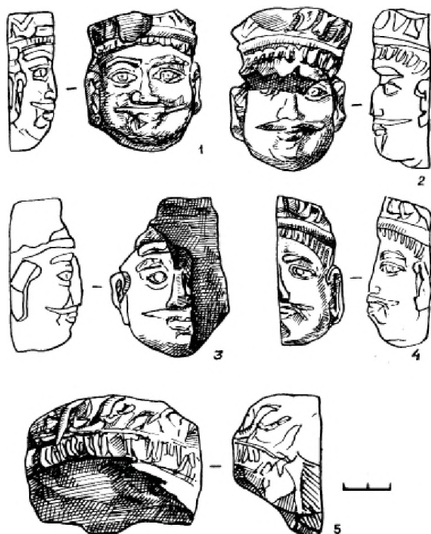
Рис. 7. Скульптурные головы Fig. 7. Sculptured heads

Статуи были выполнены в полный рост, судя по размерам голов (6,7–8 см по высоте, 5 см в ширину). Три скульптурные головки даны в анфас, одна в профиль. Статуи пристенные, выполнены в полном объеме, но без проработки тыльной стороны. Закрепленные скульптуры к стене обеспечивалось силой сцепления глины (Нуржанов, 2003).