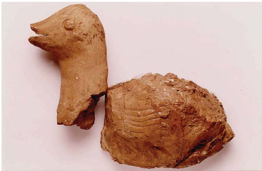
Рис. 6. Терракотовая утка-гусь Fig. 6. Terracotta duck-goose

обитавшего некогда на север от хунну. Первоначально их было 70 братьев, старший из них Нишиду родился от волчицы» (Киселев, 1949).