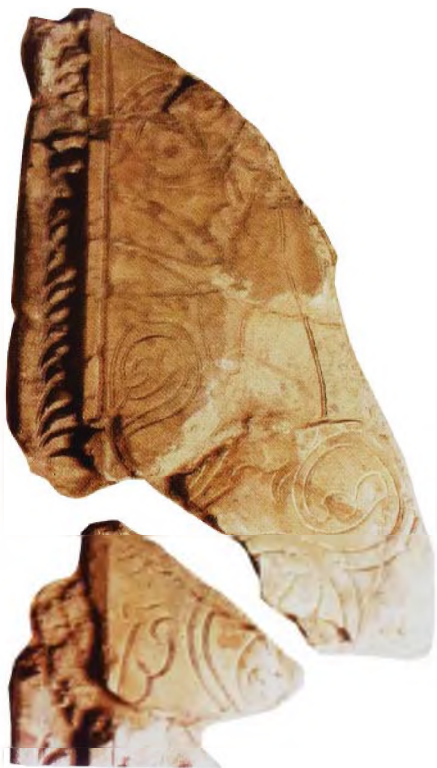
Рис. 4. Изображение лани (оленья) Fig. 4. Image of a doe (deer)