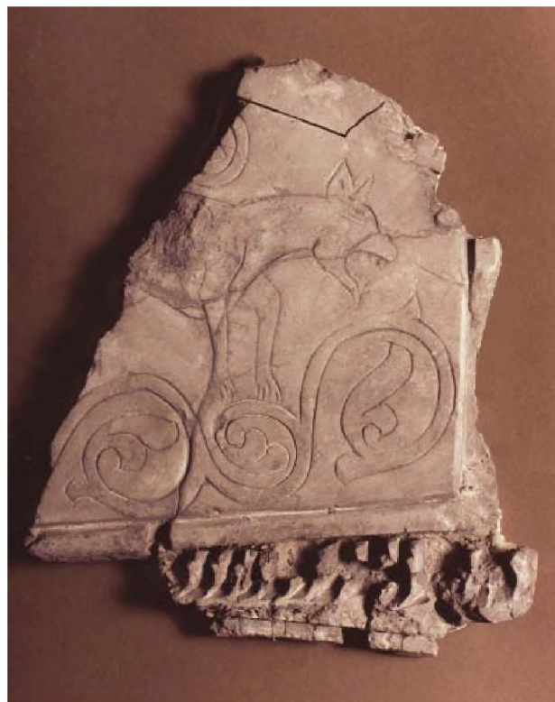
Рис. 5. Изображение волка в стиле граффити Fig. 5. Wolf's image, graffiti style

Продолжение дуг, образующих «сердечки», формирует новый ряд ромбов с треугольниками внутри. Из центрального орнамента сохранились петлеобразный орнамент и бутон трилистник.