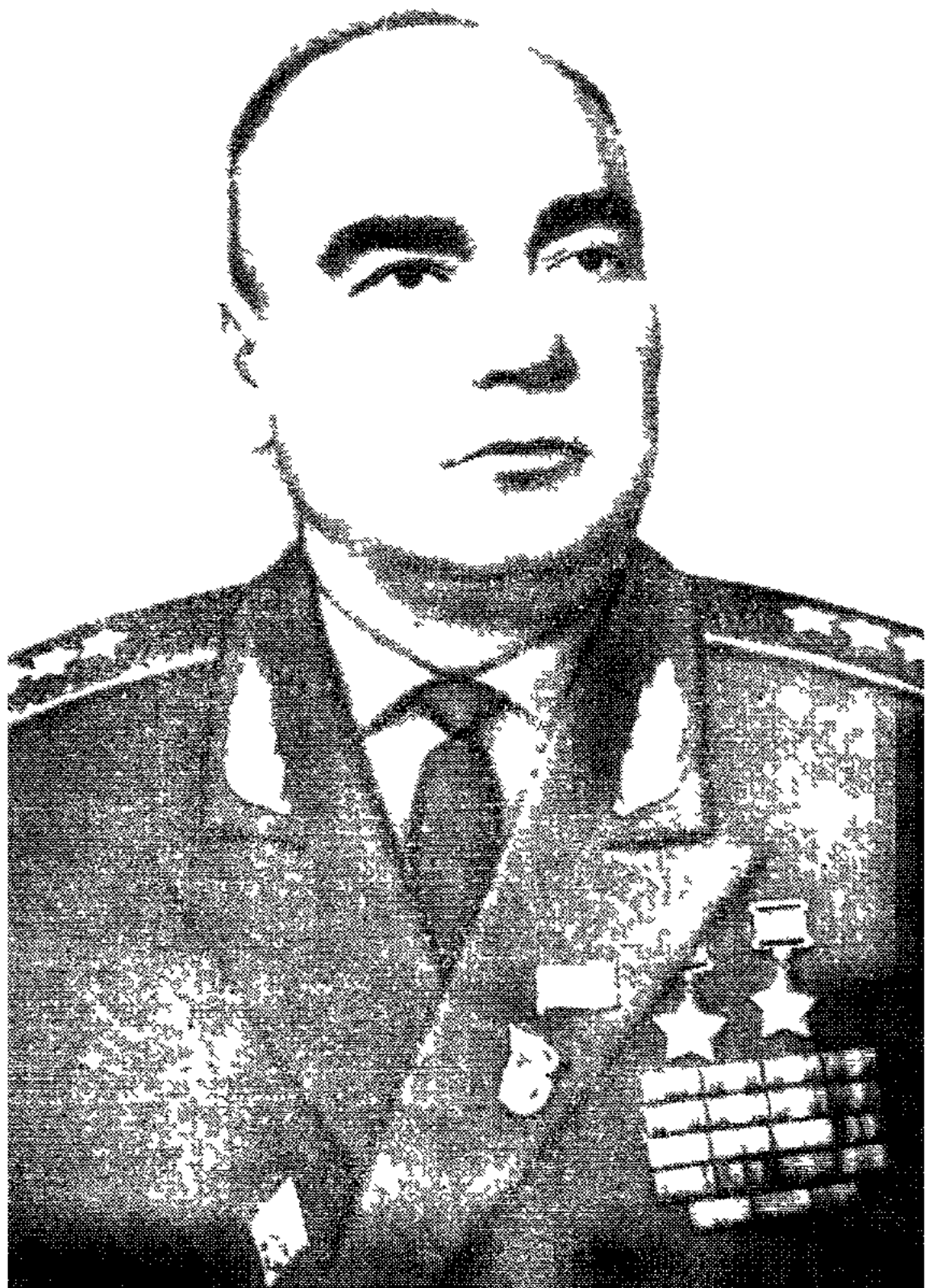
Владимир Дмитриевич Лавриненков