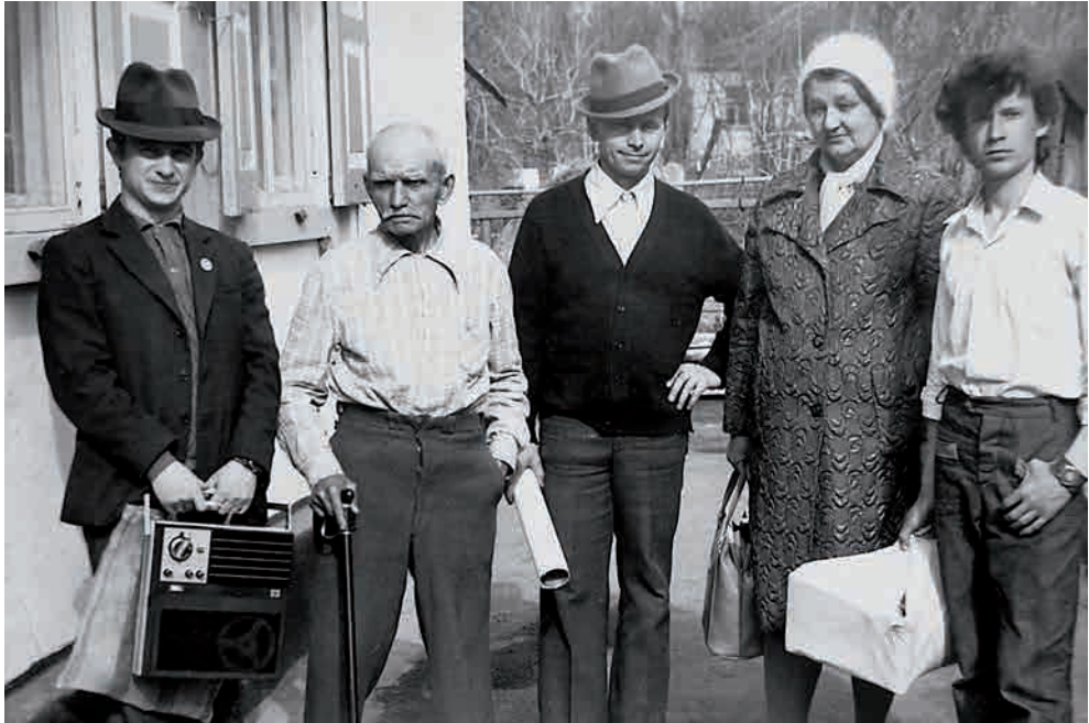
Рис. 2. Полина Андреевна с рабочей группой во дворе старожилы Бирюкова Кузьмы Павловича.