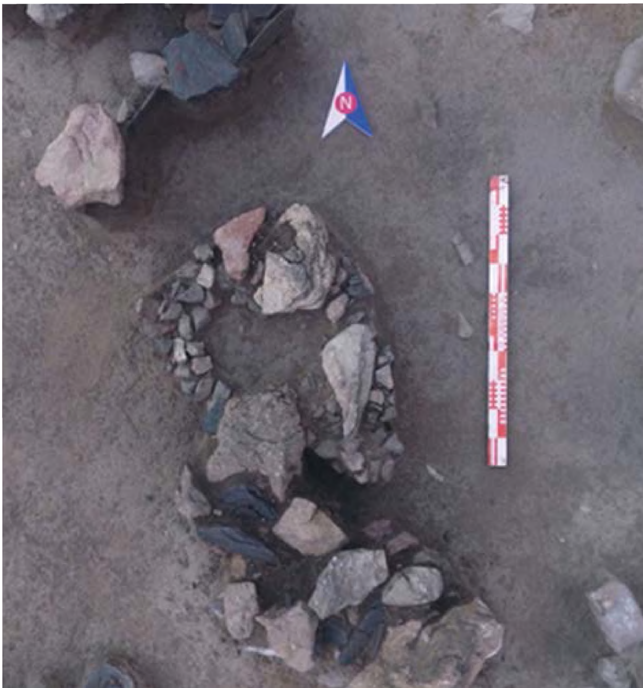
Рисунок 15. Очаг в западной стене Жилища 5.

Очаг расположенный в 34 секторе, на глубине 23 см был зафиксирован скоплением округлой формы камней (рис 15). После удаления упавших камней было явно видно очертания очага. Полное исследование очага было решено провести в 2022 году. Диаметр очага 40 см, высота 35 см. заполнение - смешанная с золой почва.