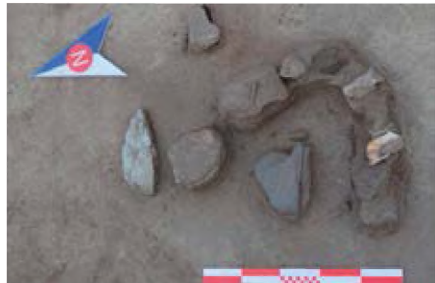
Рисунок 3. Очаг 1 возле северной стены.

Очаг 1 находится в северном секторе жилища в темно-сером культурном слое, в квадратах F14-G11 сектора 14 у северной стены. Очаг с каменной обкладкой полукруглый. Основу очага составляли камни разных размеров, укрепленные кладкой из плашмя уложенных каменных плиток. В заполнении, среди упавших внутрь камней, найдены фрагменты керамики и обожженные кости животных. В центральной части очага расчищен культурный слой, смешанный с золой. Вокруг очага были обнаружены фрагменты глиняной посуды, обгоревшие кости и каменная мотыга. Очаг сооружен из средних камней, поверхность которых обожжена огнем.