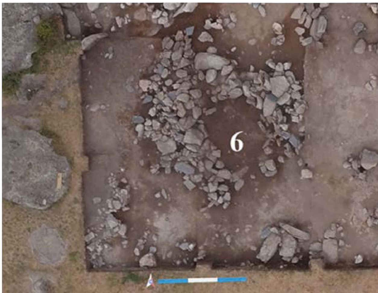
Рисунок 14. Жилище 6.

Жилище 6 расположено в секторах 30-31 и 37-38 (рис 14).. Общая площадь жилища 17,6 м 2 , ориентировано по линии северо-юг. Стены жилища полностью не открыты. Хорошо сохранившаяся западная стена расположена на протяжении секторах 31 и 37, длиной 7,3 м, высота 60-63 см, ширина 65-70 см. Сохраность восточной стены удотворительная. Каменная кладка северной части восточной стены сохранилась местами, длина восточной стены 4 м, высота 65 см, ширина 68 см. Северная стена жилища длиной 5,3 м, высотой 45 см, шириной 50-55 см. Во время работ с внутренней стороны были зафиксированы фрагменты керамики, кости животных, мотыги и молоты, лопатки и оселок. Южная стена жилища сохранилась с юго-восточной стороны. Сохранившийся кусок стены около 1м. Заполнения котлована не доведено до пола, исследование жилища 6 остановлено из-за окончания полевого сезона.