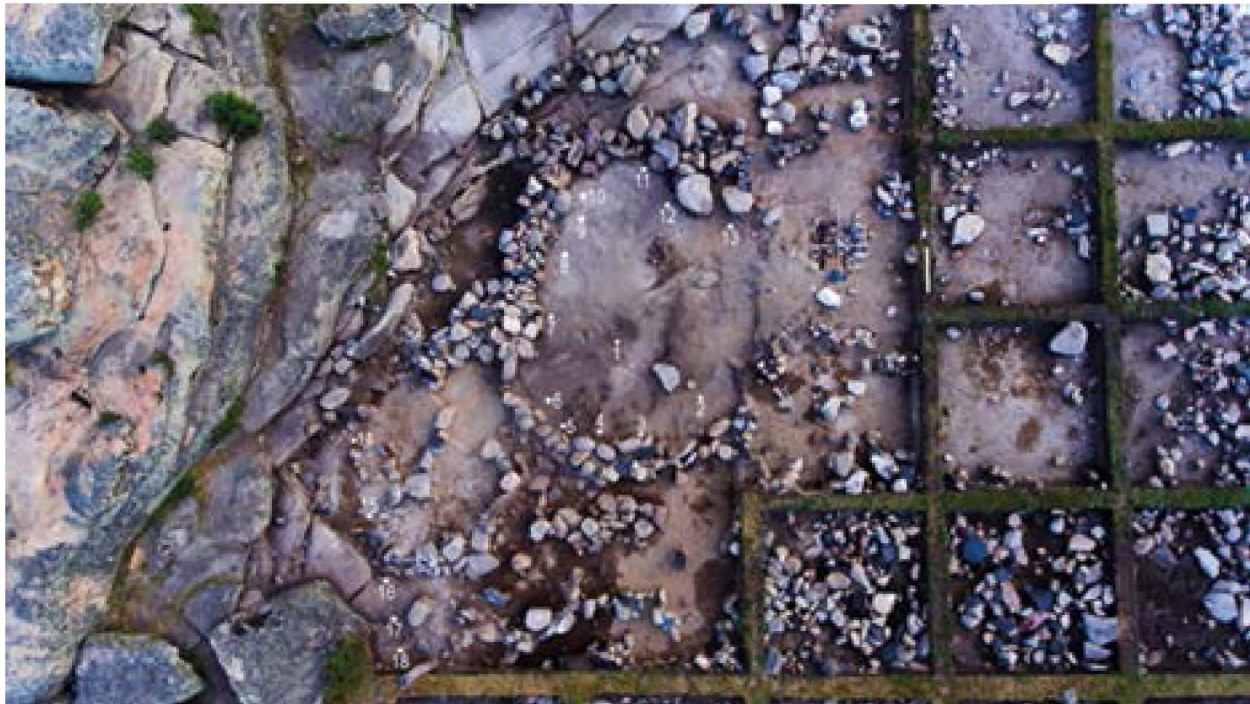
Рисунок 1. Общий план поселения.

боковины, мало встречаются венчики. Под обмазкой находятся плиты от скалы, которые рядом с поселением. После снятия обгоревшей обмазки пола, стало очевидно что жилище стоит у подножья горы. В этом слое зафиксирован очаг с северной стороны и наземная печь (рис 2) с южной стороны. К центру жилища цвет слоя меняется на закопчено-коричневый. Вероятно, это следы пожара.