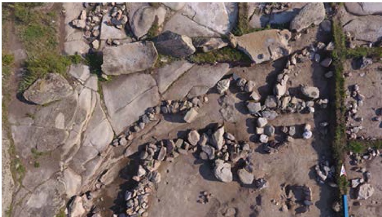
Рисунок 7. Вход с западной стороны жилища.

Во время зачистки наружной стороны западной стены жилища 1 был обнаружен вход в жилище. Ширина входа 70 см., сохранившаяся высота стены 60 см. У входа с двух сторон (внутренней и наружной) лежат горизонтальные большие плиты, в серединной части видны упавшие камни от стен. С внутренней стороны входа с двух сторон имеются ямки от опорного столба (рис 6).