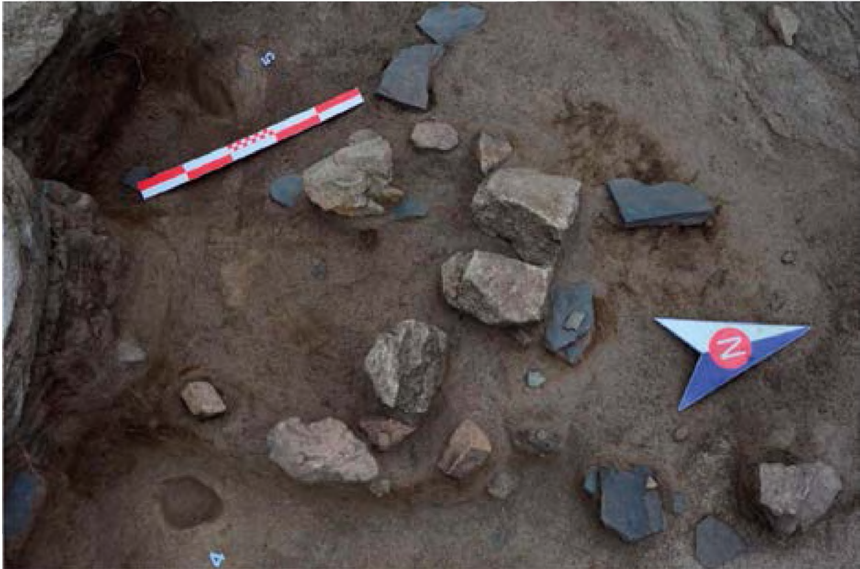
Рисунок 2. Наземная печь 2 возле западной стены.

керамики (боковина). Каменные орудия (ручная наковальня, 2 мотыги для рыхления земли, фрагмент куранта) были найдены в 20 см к западу от печи.