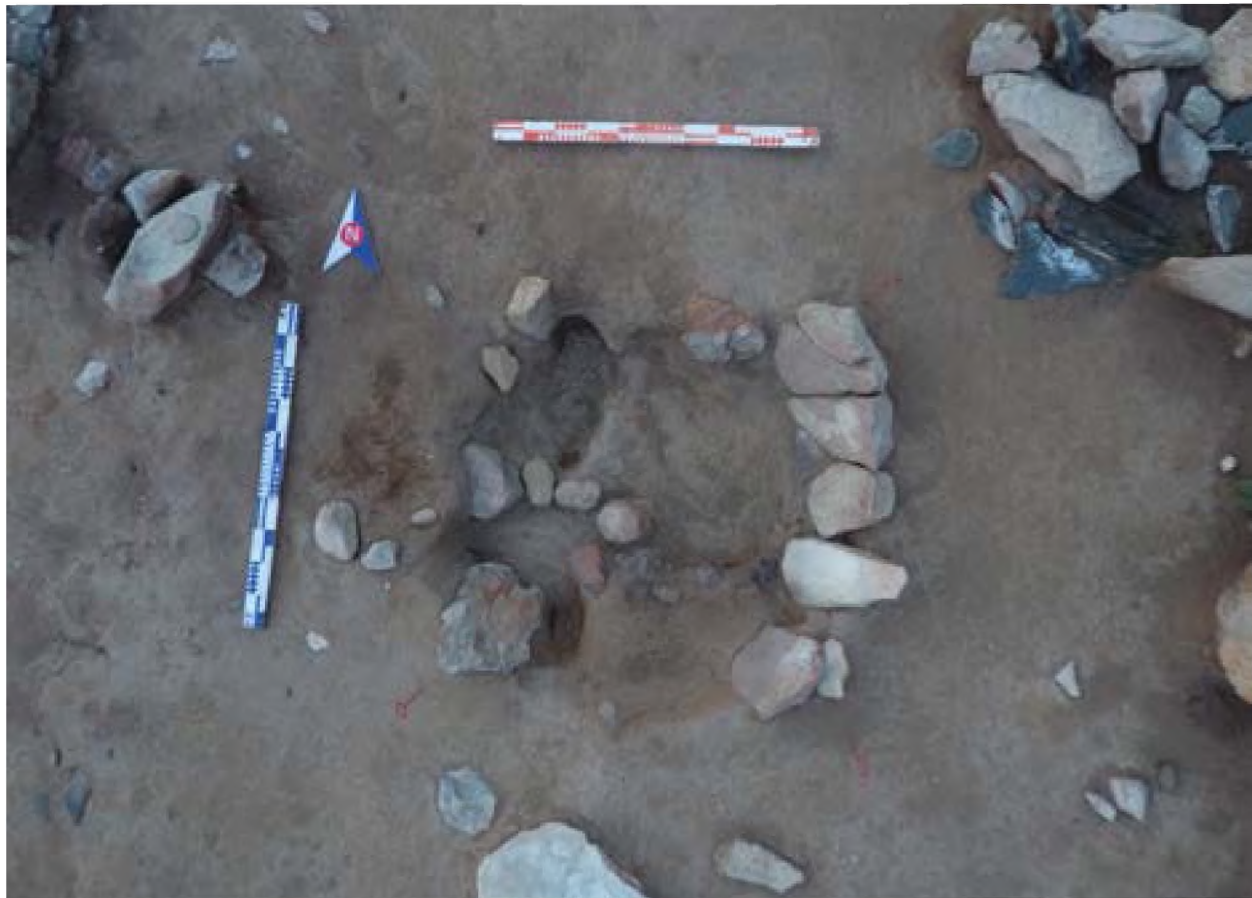
Рисунок 4. Наземная печь 1

У наземной печи 1 расчищено дно, убраны камни, которые находились на дне. Диаметр основания ямы, где расположен мех – 66 см. Диаметр основания основной печи, где горел огонь – 48 см.