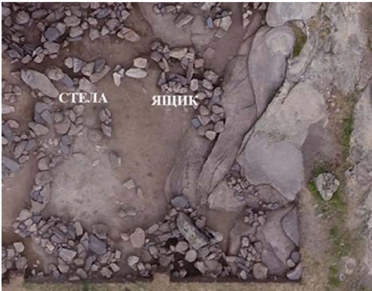
Рисунок 11. Жилище 3.

В северо-западном углу стены жилища 3 расположена стела(рис 11).. Длина 127 см, толщиной 20 см, ширина серединой части 40 см, нижняя часть сужается до 21 см. Верхняя часть стелы скошена к юго-западу, а нижняя часть двух сторон сужается под углом 150С. Края стелы пришлифованы техникой пикетажа. На лицевой стороне видны следы от каменного долота. После такой обработки каменной стелы видны острые края от следов долота. В данный момент для чего поставлено стела не известно, можем только предположить, что вероятно, помещение предназначалось для ритуального характера, так как в этом помещении в юго-восточном углу находится каменный ящик и в северо-западном углу упавшая в одну сторону стела. Начиная от стелы в сторону юга продолжается западная стена помещения.