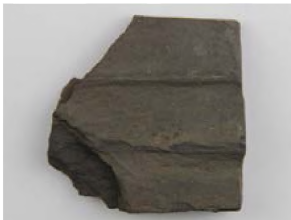
Рисунок 17. Литейная форма