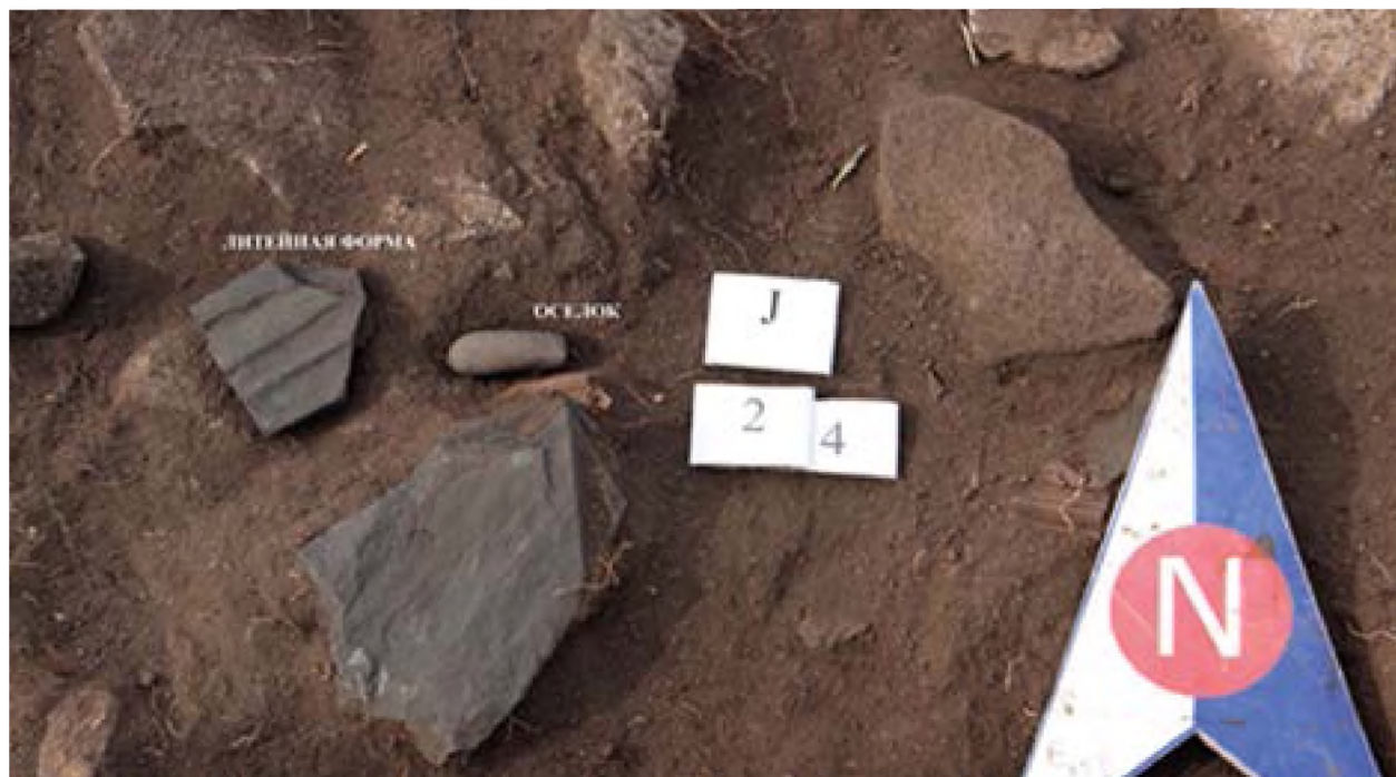
Рисунок 16. Литейная форма и каменный оселок.

В секторе 26 в глубине 44 см в светло-сером слое была найдена медная игла в хорошем состоянии(рис 19). Возле нее с уклоном выпирая, лежат трубчатые кости КРС. Кроме того, в этом квадрате найдены фрагменты керамики, мелкие камни упавшие от заполнения стены, мелкие кости МРС.