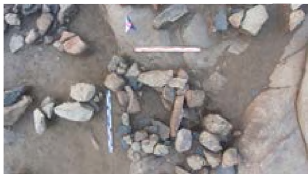
Рисунок 10. Каменный ящик в северной стене жилища 3.

Котлован жилища 3 прямоугольной формы, общей площадью 17,2 м 2 (рис 9). Длина стен 4,6 м, шириной 4 м, расположено у подножья скалы. На северо-восточном углу во время зачистки появился каменный ящик размером 90x77x100x92 см. Заполнение ящика темно-серый слой. Произведена зачистка. Заполнение содержало фрагменты керамики, кости животных, каменные орудия и кусок хрусталя без обработки. Каменный ящик расположен в 36 секторе .