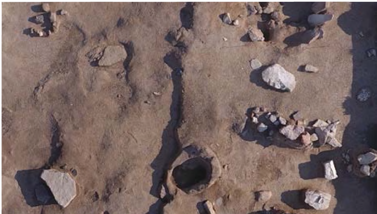
Рисунок 5. Куполообразная печь

В юго-восточной стороне жилища в секторе 21, в квадрате I14 находилось устройство куполообразной формы. Вокруг куполообразной печи найдены керамические изделия, в том числе бронзовый стержень (в 2020 году), каменные орудия. Данная находка ориентирована с северо-запада к юго-востоку. Диаметр печи 40 см. Высота сохранившегося купола с восточной стороны 30 см, с южной стороны 18 см, с северной стороны 11 см, с западной стороны 6 см. Заполнением куполообразной печи была зола с перемешанной почвой (взято на анализ).