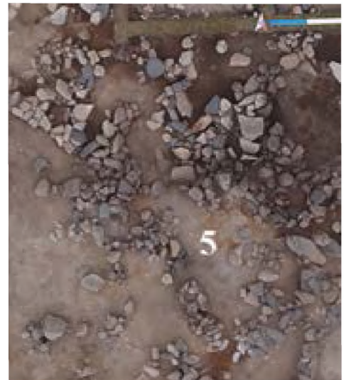
Рисунок 13. Жилище 5.

Жилище 5 ориентировано по линии северо-запад, общей площадью 24,4 м 2 , размером 9,2х2,7 м. Жилища 5 находится в секторах 27 и 28, 34 и делится на две камеры, одна расположена северо-западной стороне раскопа, вторая в юго-восточной стороне(рис 13).. Очертания жилища полностью открылись после зачистки темно-серого слоя. Жилище прямоугольное, углы закругленные, на западной стене находится проем, вероятно, вход. Первоначально жилище было 5,2х2,5 м. потом в юго-восточную сторону соорудили еще одну комнату размером 4х 2,5 м. Камера жилища расположена на темно-сером слое и находится в северной части раскопа. Вторая камера расположена на 10 см выше, чем первая камера. Вторая камера жилища вырыта в светло-сером суглинистом слое, вероятно, после забутовки соорудили вторую камеру жилища 5.