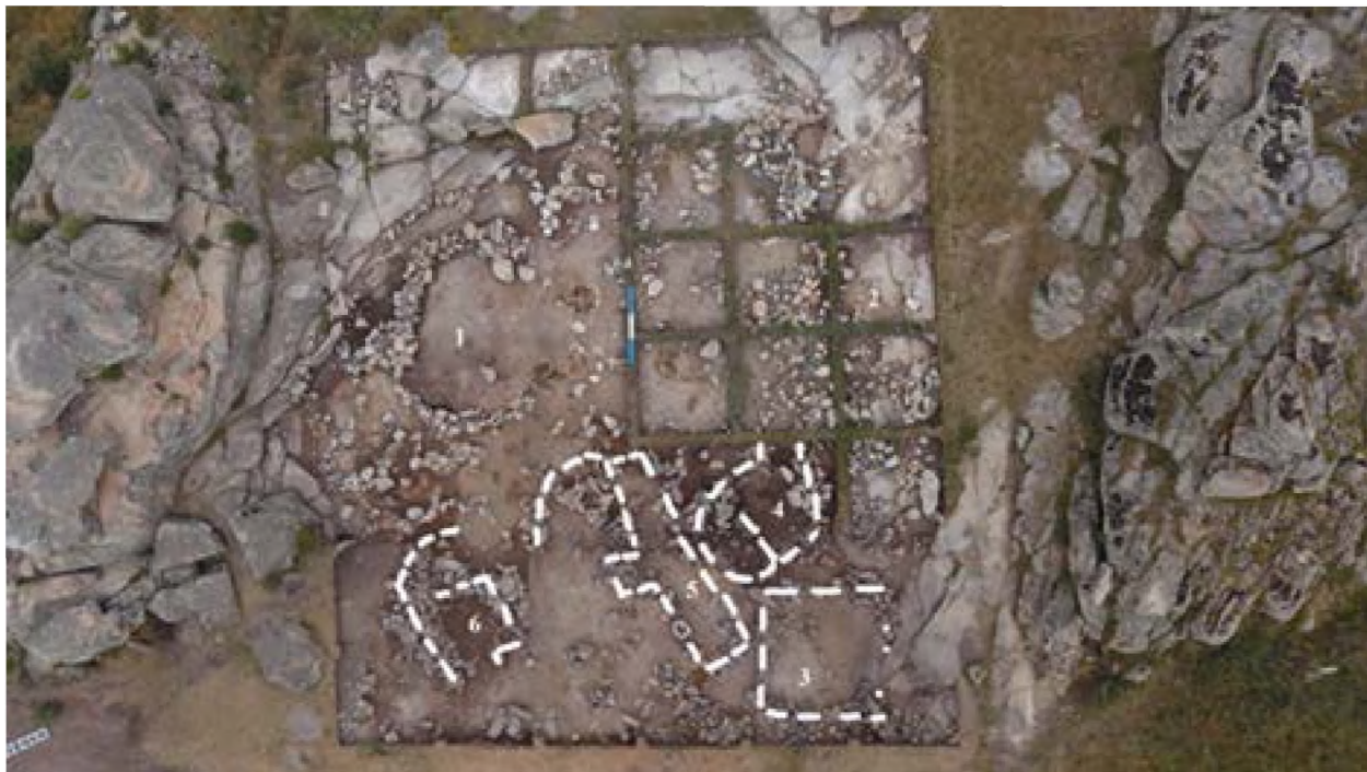
Рисунок 9. расположение жилищ

Первоначально вскрывались сектора 31, 32, 33, 34, 35, 36. На глубине 10-12 см были отмечены первые четкие очертания каменной стены жилища в секторах 31 и 32, затем были скрыты сектора 37, 38. В результате были выявлены каменные конструкции по всему периметру сектора. Конструкция жилищ расположена на темно-сером слое. После снятия на глубине 25-30 см появился светло-серый слой. Продолжение вскрытия секторов производилось на 39, 40, 41, 42 слое.