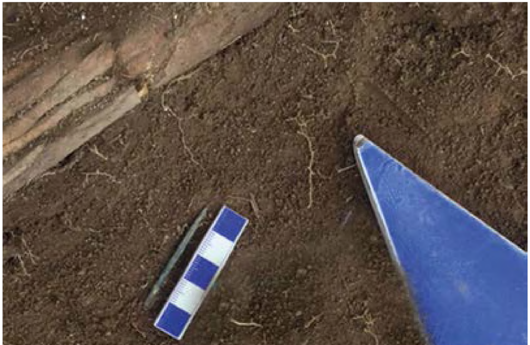
Рисунок 19. Медная игла в квадрате G20 сектор 26.

В квадрате M27, на втором светло-сером слое на глубине 23 см, от западной бровки 78 см, от южной бровки 100 см найден шлак керамзита(рис 20).