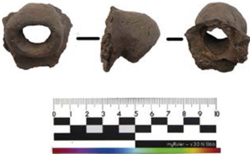
Рисунок 18. Керамическое сопла.