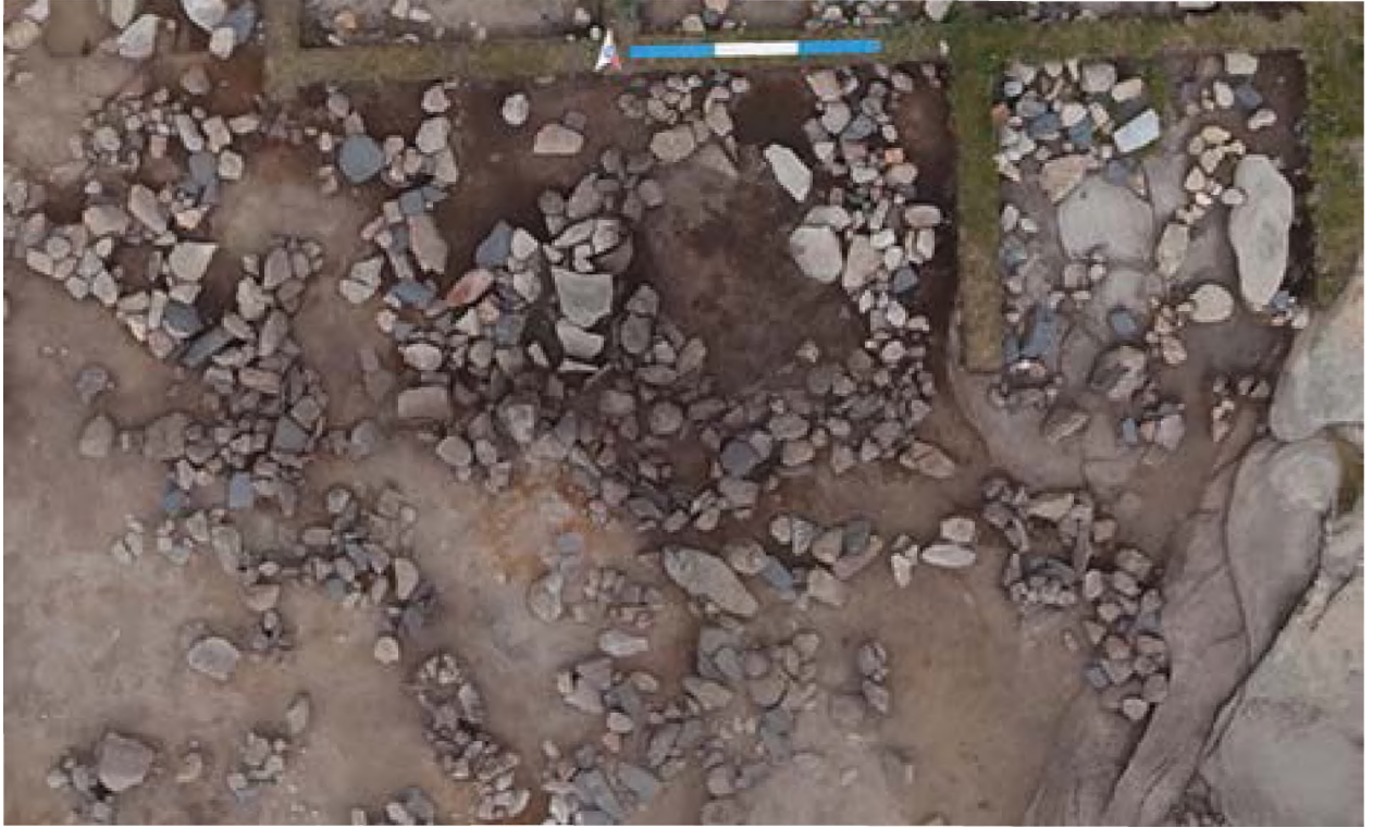
Рисунок 12. Жилище 4.

был расчищен в 2020 году. В этом году был вскрыт сектор 35 и очертание жилища стало явным. Судя по профилю все стенки котлована находятся на темно-сером слое. На этот год мы поставили цель – убрать упавшие камни внутри жилища и определить полные очертания стены жилища 4.