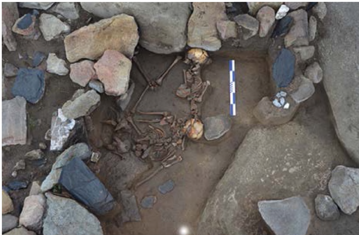
Рисунок 8. Погребение (жертвенная площадка).

Кости ребер, позвонков находится In Situ. Руки находятся вдоль тела. Кости левой руки отсутствуют. Нижняя челюсть раздроблена. Кости бедер так же находятся в анатомически правильном положении. Бедренные кости ног уходят под стену. Череп погребенного положен на камень, который является орудием. Кусок черепа, затылка выпал и находится над ключицей левой руки в 30 см от кости левой руки, вероятно, она перемещена грызунами. Между этой костью и скелетом положена мотыжка. Погребения совершены на скальнике.