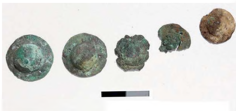
Рис. 10. Берел. Ограда № 108А. Бляшки шляповидной формы