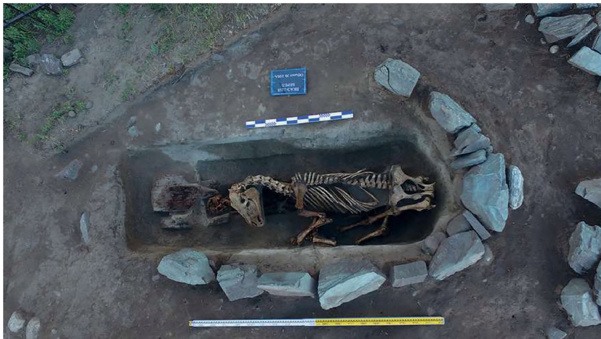
Рис. 8. Берел. Ограда № 108А. Могильная яма

Из предметного комплекса ограды № 109 в культурно-хронологическом отношении интересен предмет, выполненный в полихромном стиле. Аналогично оформленные изделия найдены в ходе изучения круга памятников гуннского времени из Канаттаса в Сарыарке [Кадырбаев 1959: 193, 197], Борового [Бернштам 1951: 218–221], Атасу-2 [Бейсенов и др. 2018], Актасты в Жетысу [Акишев К.А., Акишев А.К. 1983: 180–182], Кызыл-Кайнар-тобе на юге страны [Мерциев 1970], у Сибинских озер в Восточном Казахстане [Самашев 2013: рис. 363], Солончанки-I и т. д. [Любчанский 2009: 12]. В ряду вышеперечисленных аналогий рассматри-