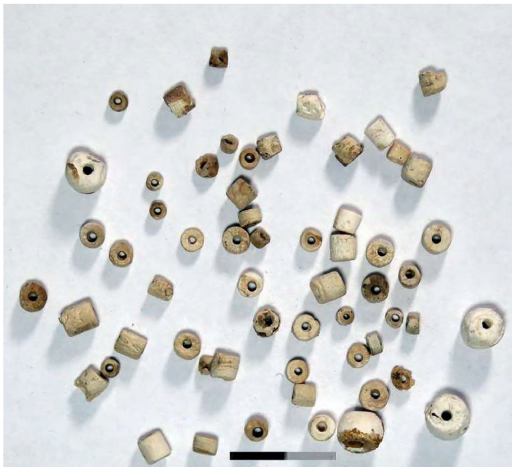
Рис. 9. Берел. Ограда № 108А. Каменные бусы