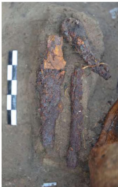
Рис. 7. Берел. Ограда № 90А. Железный нож

с использованием дерева, вероятно, говорят в пользу разнородности этнического состава женских погребений. Напротив, наземные сооружения, ориентировка и положение умерших демонстрируют однотипность и тем самым высокую степень унификации погребального обряда. Большинство описанных могил представительниц слабого пола не содержат сопроводительного инвентаря либо их количество минимальное, что затрудняет обнаружение признаков социального порядка. Из числа исследованных памятников богатством сопроводительного инвентаря выделяются лишь две ограды (№ 81, 109), где, вполне вероятно, могли быть захоронены представительницы элиты общества сяньби.