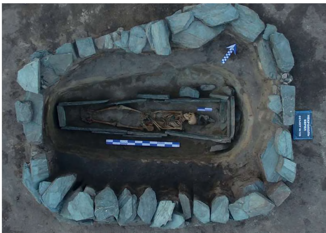
Рис. 11. Берел. Ограда № 109. Могильная яма