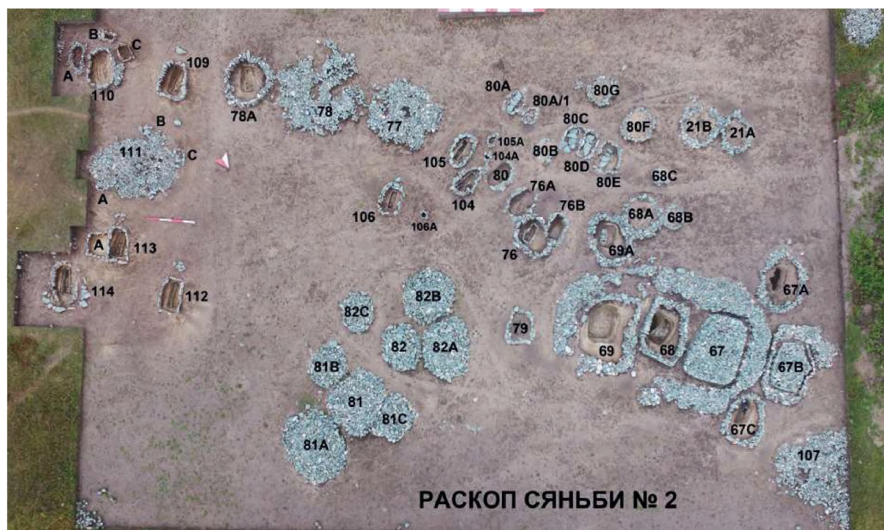
Рис. 1. Берел. Погребально-поминальные выкладки-ограды хунно-сяньбийского периода

Наши исследования в данном направлении позволили обнаружить новые данные о наличии на территории Казахстана хунно-сяньбийского компонента и расширить границы этого круга памятников. Научно-исследовательские работы последних лет показывают, что после распада империи хунну (примерно в III–IV вв. н.э.) это объединение кочевых племен проникает в верховья реки Бухтарма и частично на юго-