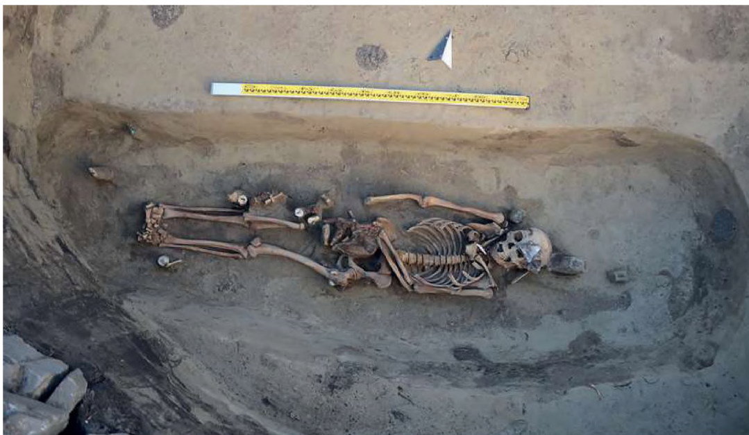
Рис. 2. Берел. Ограда № 81. Могильная яма