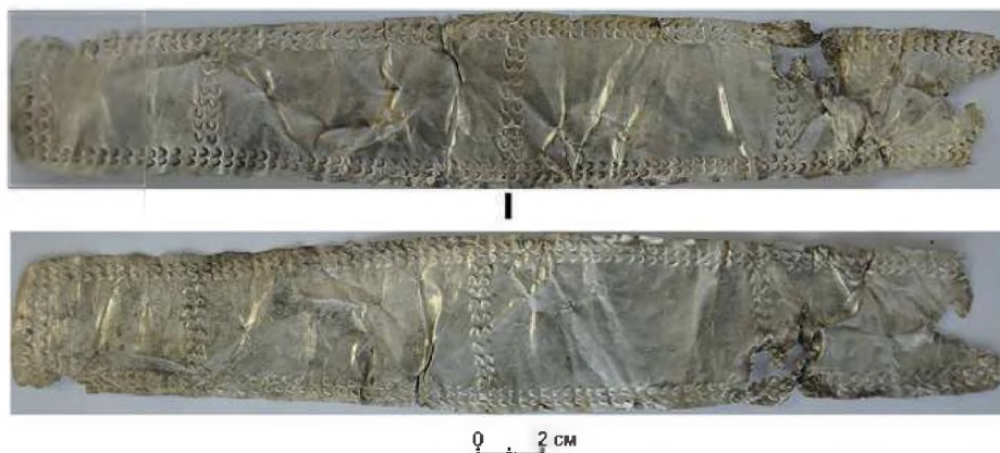
Рис. 5. Берел. Ограда № 81. Серебряная орнаментированная пластина

инвентаря зафиксированы небольшой железный нож (рис. 7), серьга и остатки заупокойной пищи в виде нескольких овечьих позвонков. По определению антропологов, захороненная была в возрасте 35–45 лет, черты лица монголоидные.