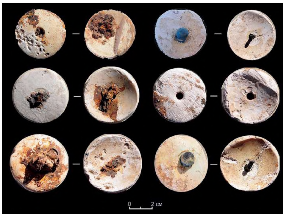
Рис. 4. Берел. Ограда № 81. Дисквидные изделия из погребения