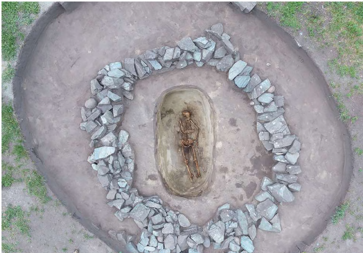
Рис. 6. Берел. Ограда № 90А. Могильная яма

Таким образом, материалы оградок некрополя Берел пополняют немногочисленные данные о женских погребениях хунно-сяньбийской эпохи. Представленная серия из девяти погребений позволяет изучить специфические показатели, характерные для этих объектов, и обряд погребения. Наличие фактов труположения в простой грунтовой яме, в каменном ящике, в сопровождении коня и внутримогильные сооружения