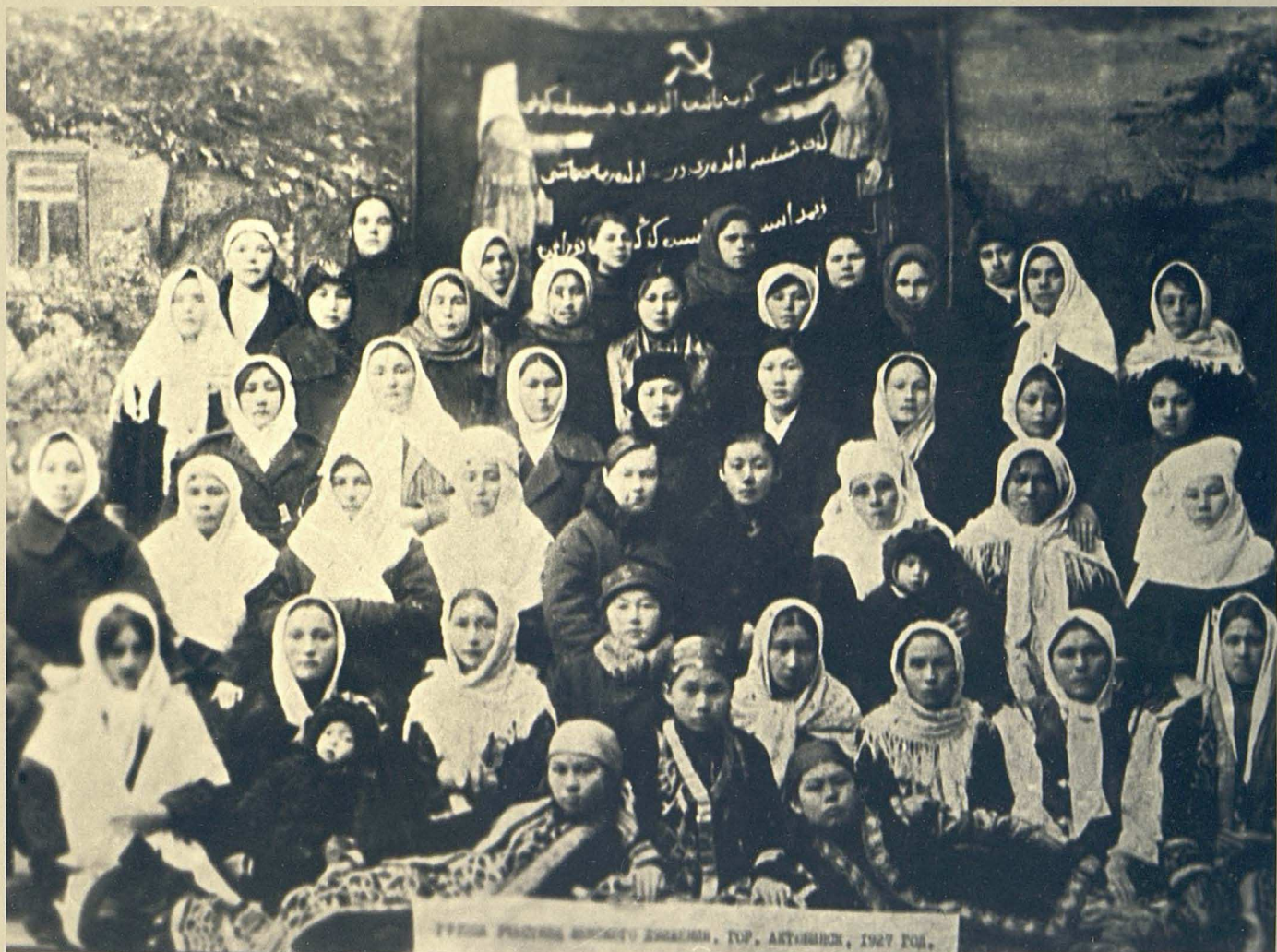
Әйелдер қозғалысына қатысушылар. (Ақтөбе. 1927 ж.)