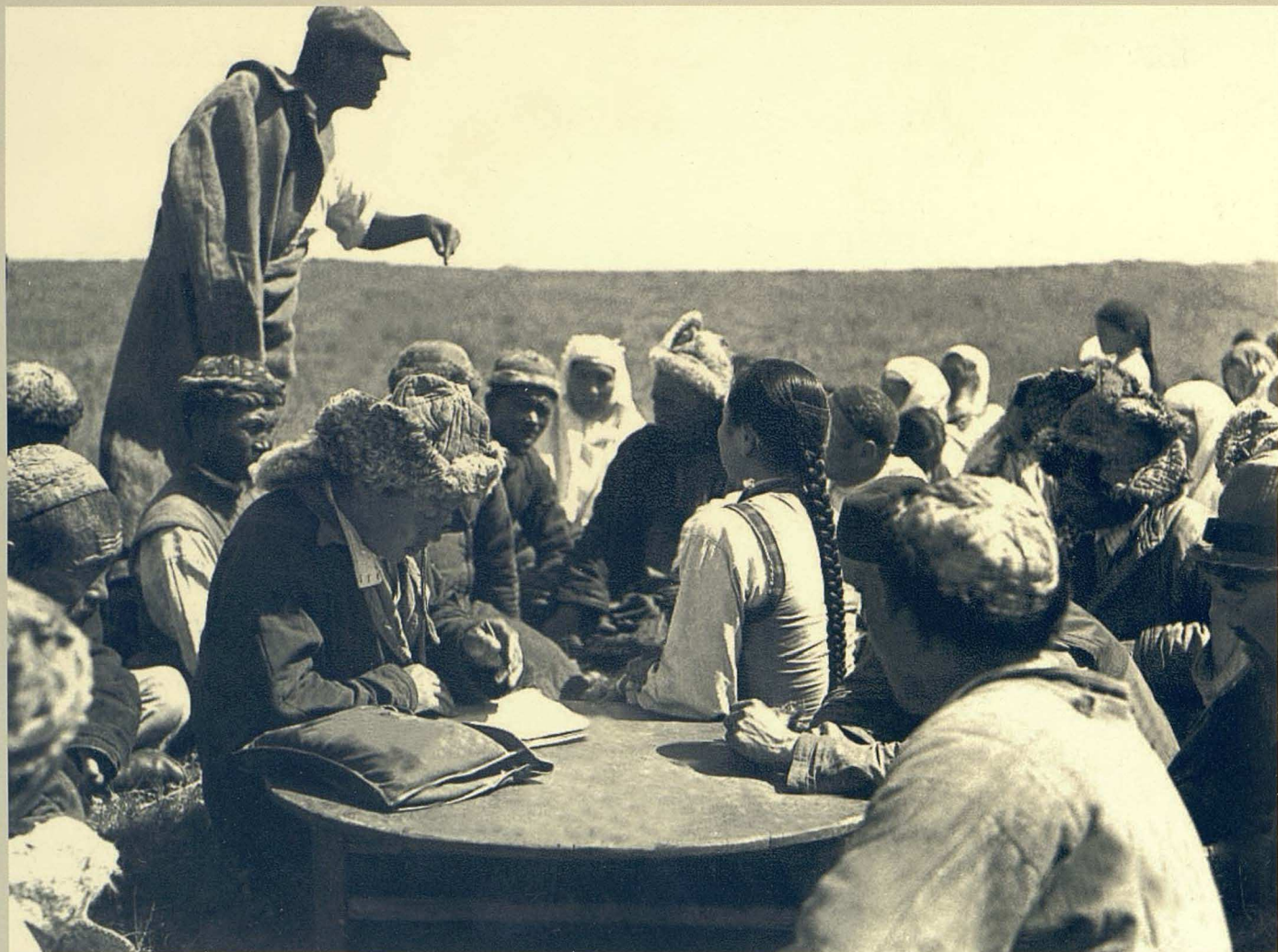
Колхозшылардың алғашқы жиналысы. (1928 ж.)