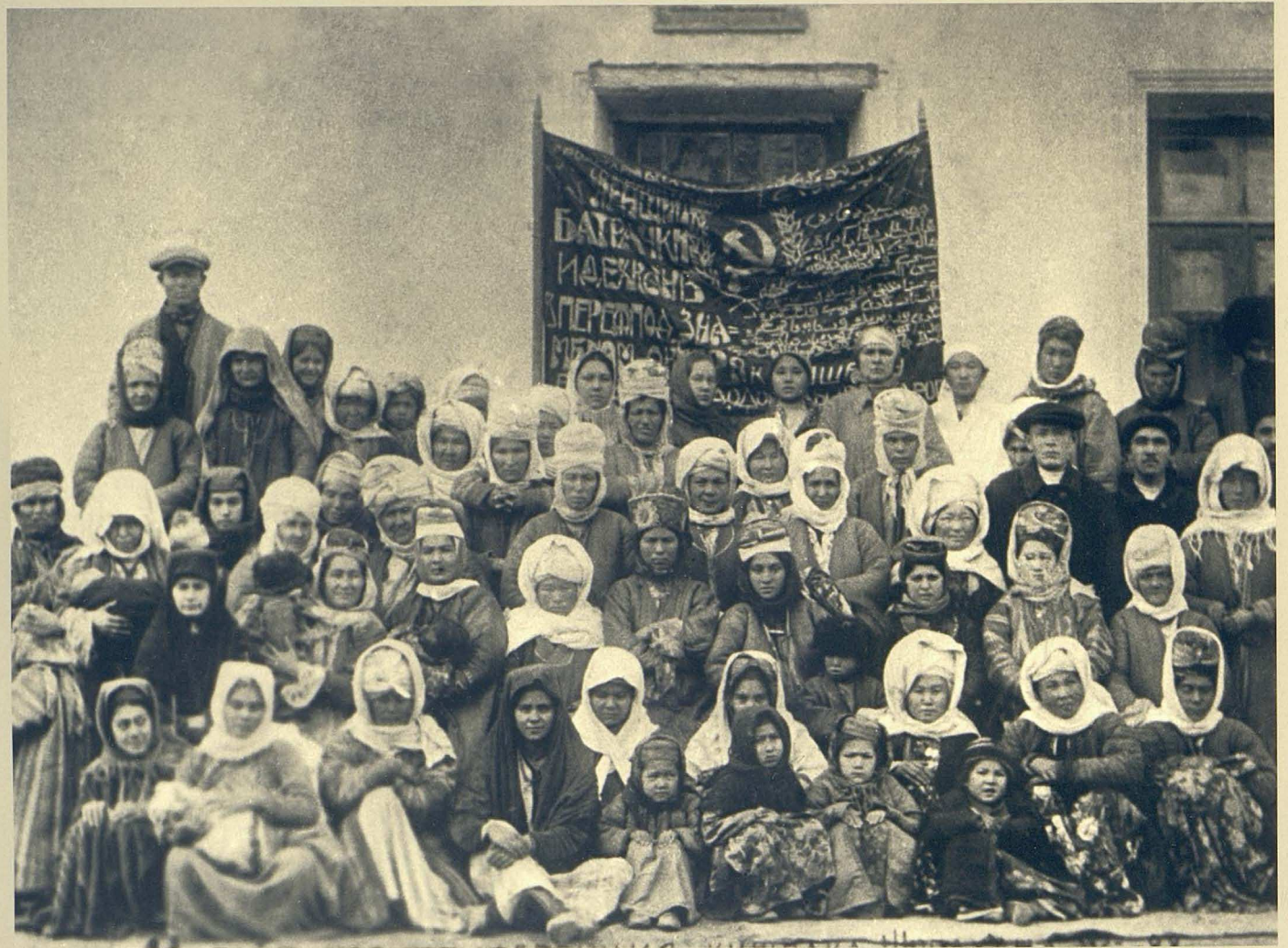
Қарақалпақ автономды облысының Шурахан қыстағындағы 1-ші аудандық конференциясы, парәнжа шешу күні. (1928 ж.)