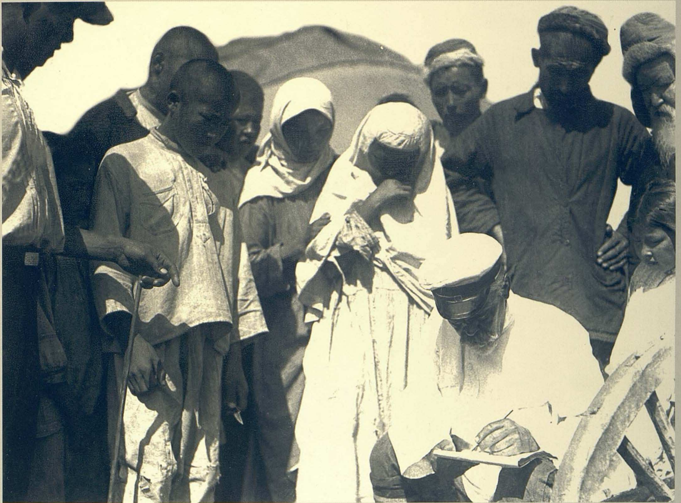
Халық санағы. (1928 ж.)