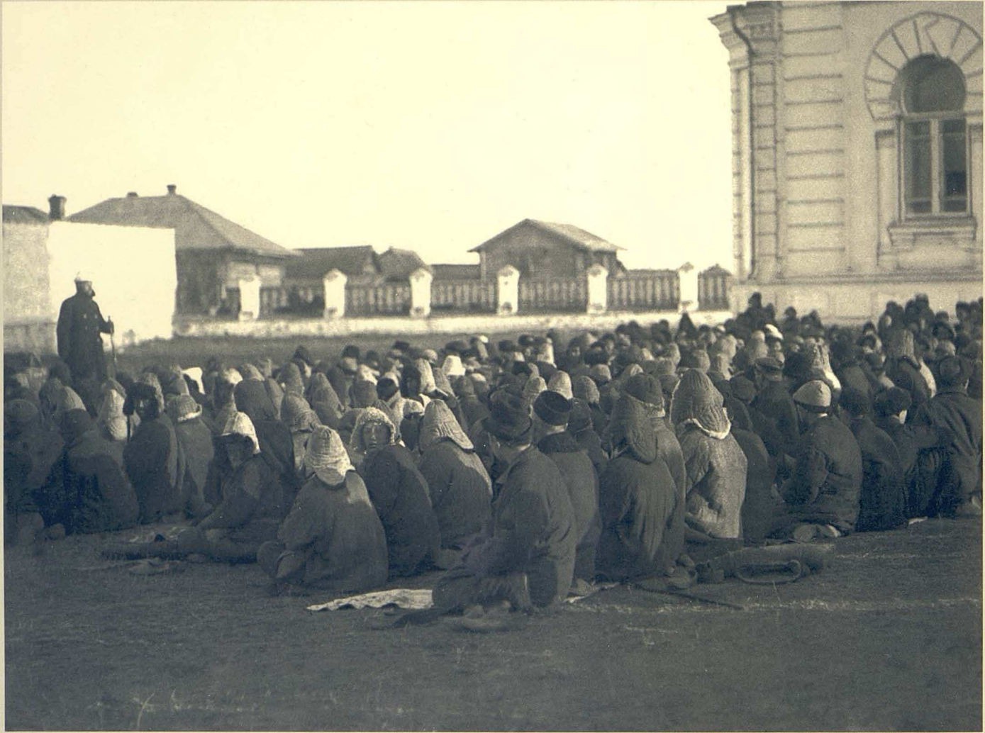
Үгітші. (1920 жж.)